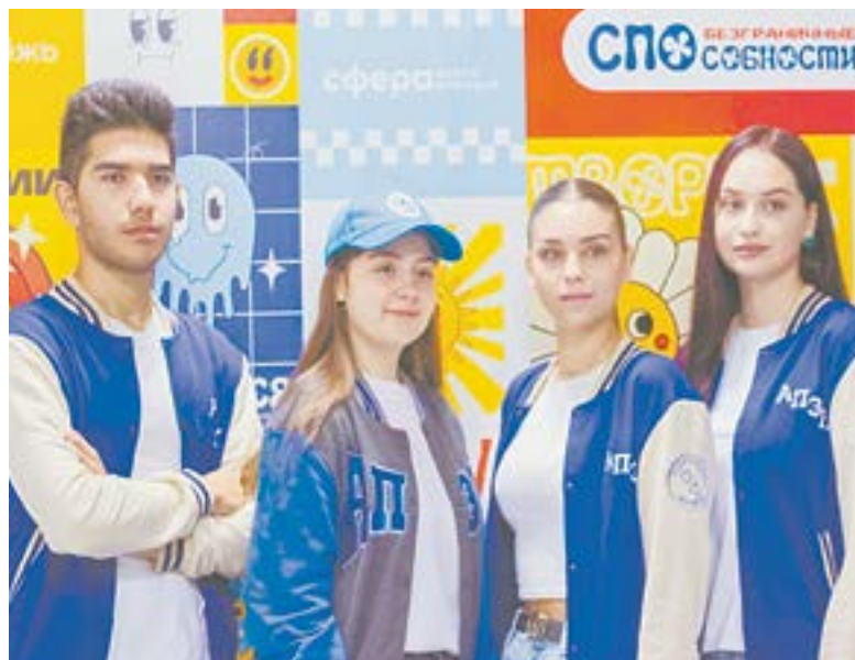
Студенты на фестивале «Безграничные СПОСпособности».

На уроки пригласили учеников школ, расположенных вблизи магистрали. За один день важ-