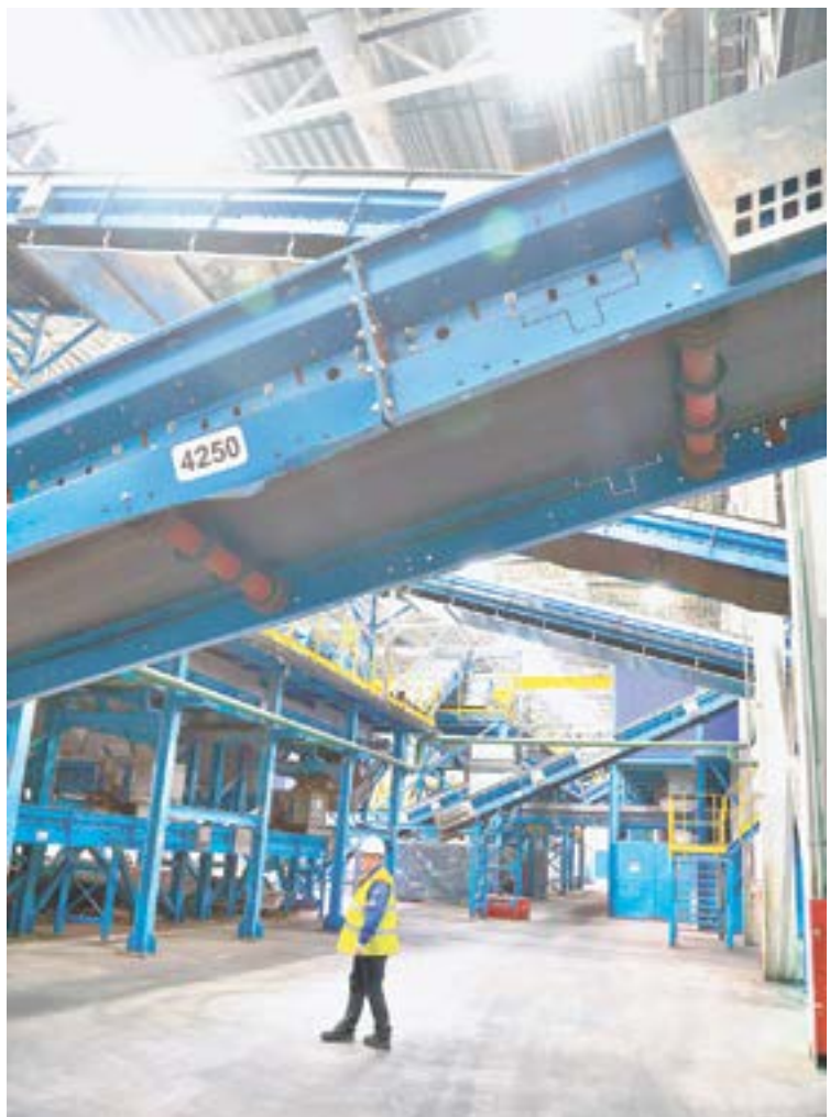
Многие процессы на заводе автоматизированы.