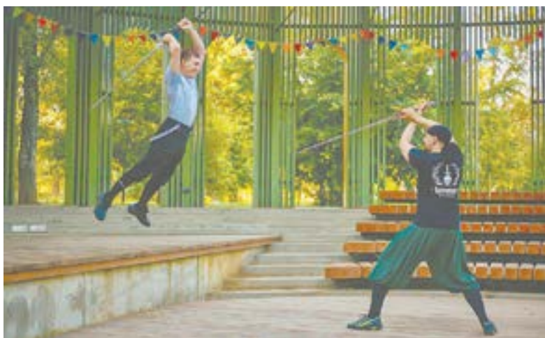
Приемы владения оружием прошлого инструкторы черпают из исторических источников: трактатов, пособий, которые составляли средневековые учителя.