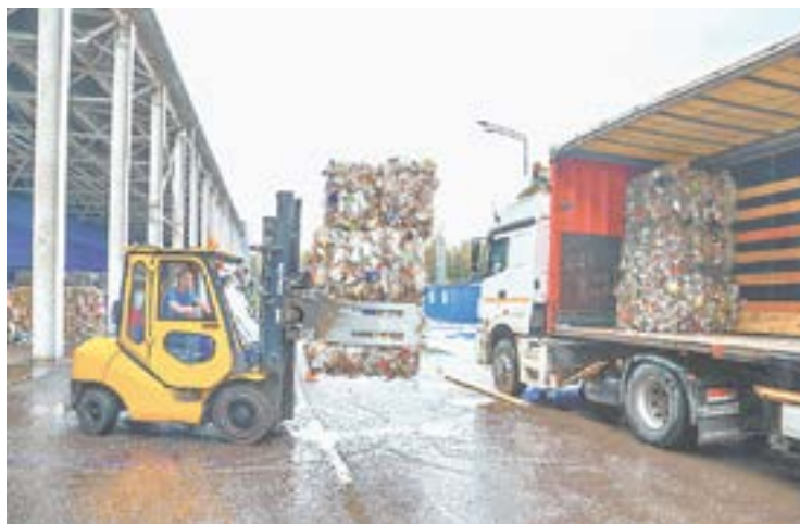
Спрессованный мусор отправят на переработку.

Когда карта заполнилась отходами, ее рекультивируют, наносят плодородный слой почвы, высаживают многолетние травы и зеленые насаждения. Результат – то, что мы при въезде приняли за природный арт-объект рядом с территорией солнечного завода.