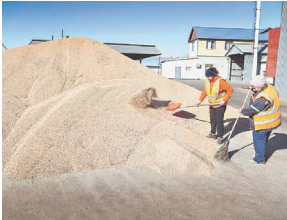
В КХ Гунова большой урожай пшеницы.

– Планово обновляем общественный транспорт по всему краю. Это вопрос и комфорта, и, самое главное, безопасности движения.