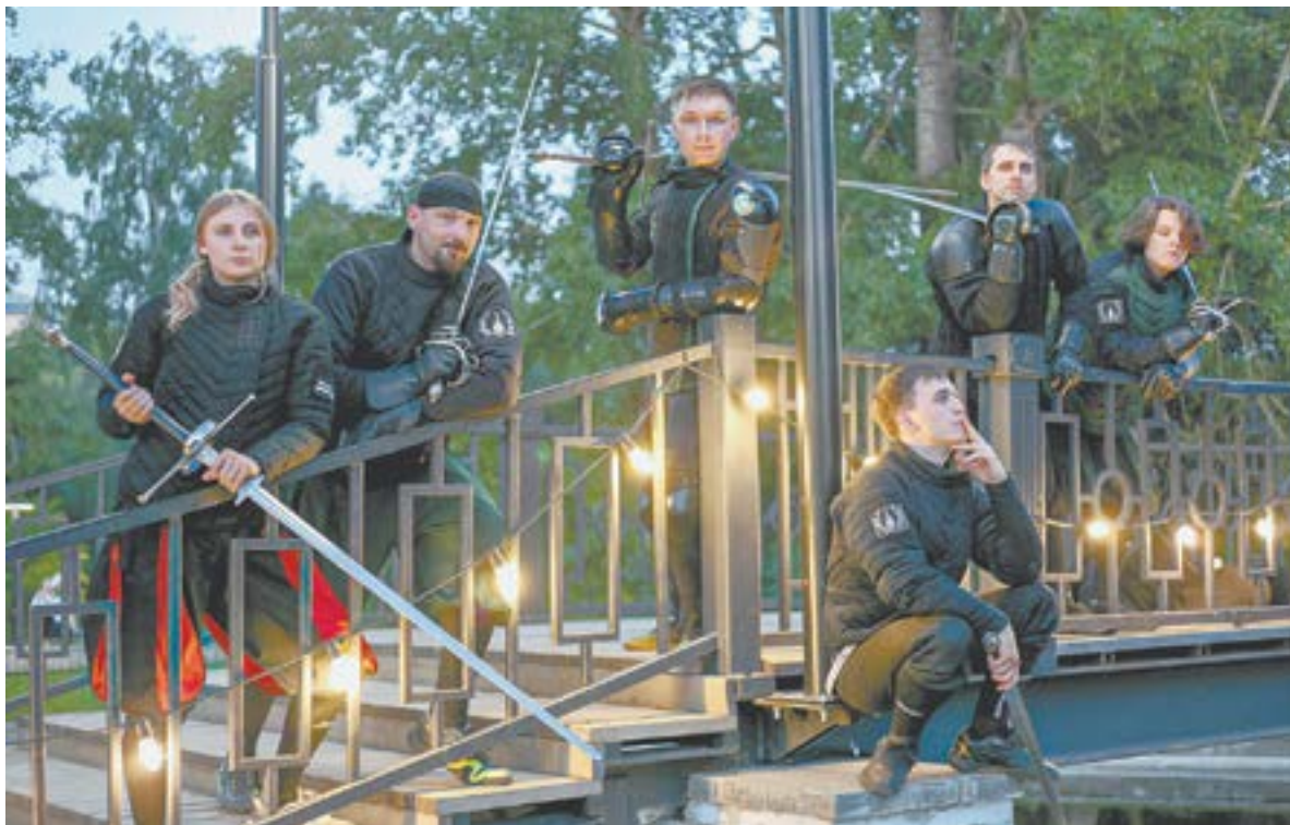
В стране около 4000 человек, которые занимаются реконструкцией европейских боевых искусств.

«Мы занимаемся теми направлениями, которые практиковали