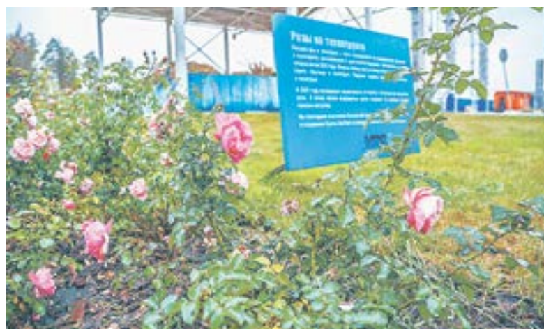
Растут на технологическом грунте.

Пока идем через проходную, к воротам подъезжает машина с мусором. Ее пропускают через весовую. На обратном пути, после разгрузки на строго закрытой площадке, машина будет не только проходить вторичное взвешивание, но и дезинфекцию колес. Хотя, шагая по предприятию, отметили чистоту: оказывается, полы здесь регулярно моют.