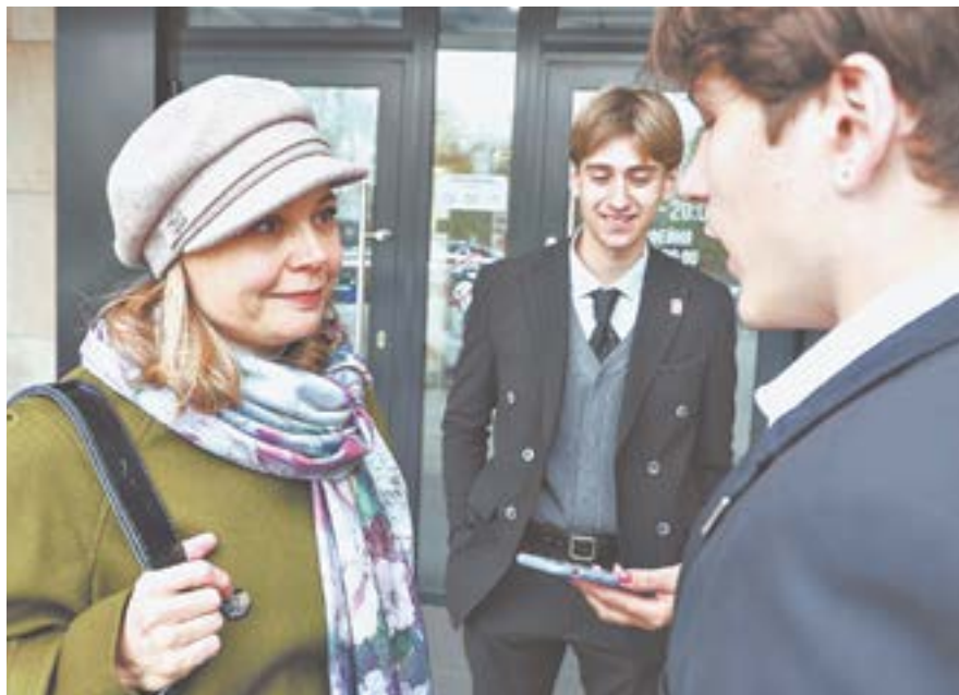
Школьникам понравилось быть в роли журналистов.