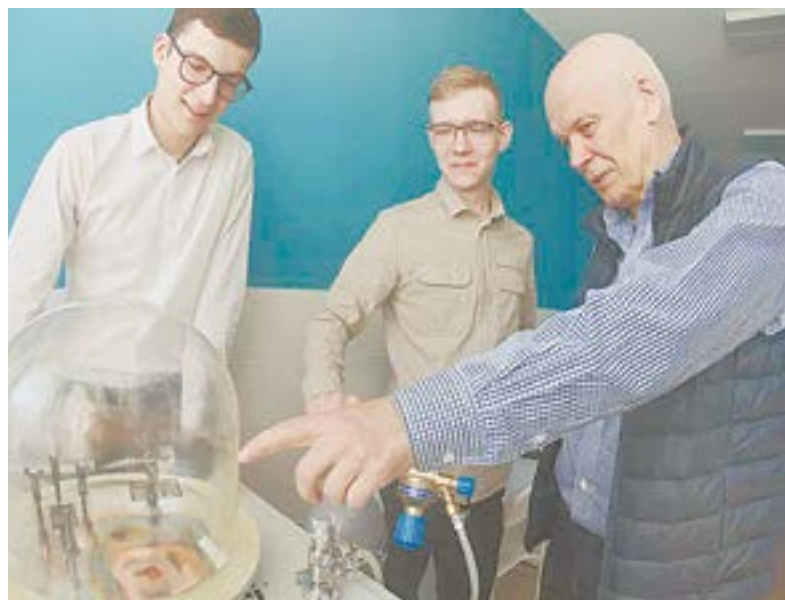
Александр Аполонский подготовил сотни успешных физиков.