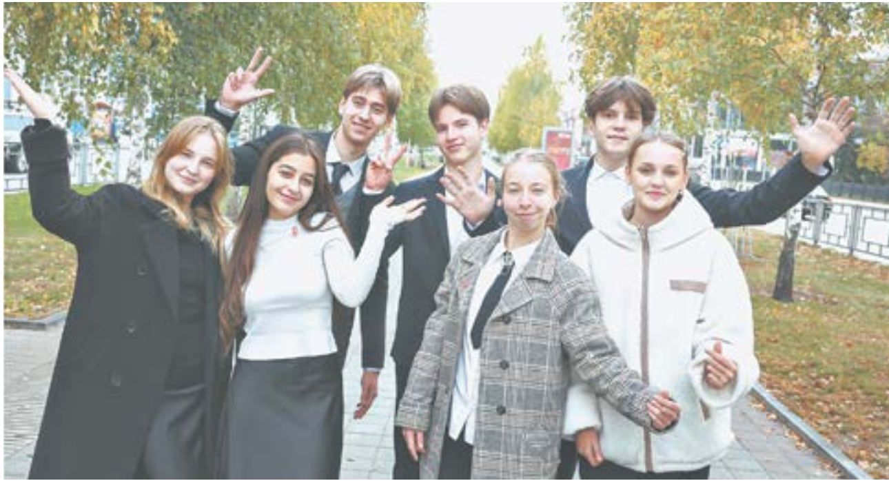
Активисты из гимназии № 79.