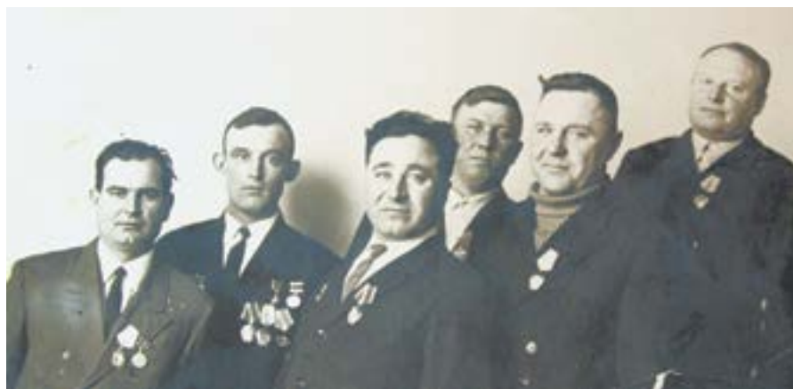
Ветренно-телеутские передовики, механизаторы и комбайнеры.