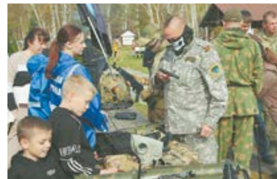
Фестиваль «Сила духа Алтая» с каждым годом собирает все больше участников разных возрастов.

военно-патриотического воспитания молодежи. Любил спорт, занимался несколькими видами, участвовал в соревнованиях.