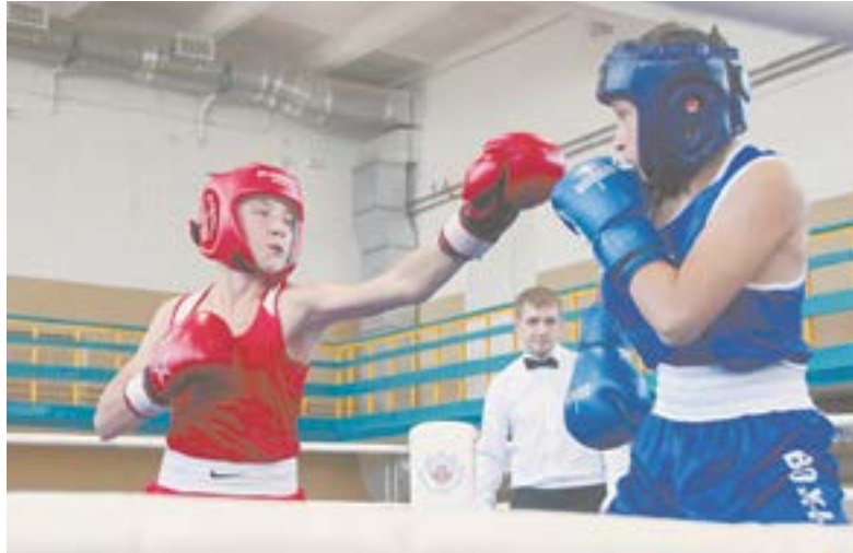
Юные спортсмены показывают отработанную технику боя.