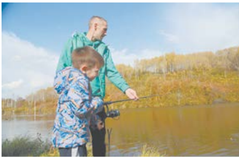
Молодежный клуб объединил всех интересующихся местной природой.

мейный экоклуб и начали образовательные занятия. К слову, на первом сборе участники уже научились ставить метки в Яндекс.Картах, делиться GPS-координатами, создавать свои персональные карты. Эти знания и умения упрощают обмен информацией о местоположении того или иного объекта между членами клуба и позволяют быстрее найти к нему дорогу.