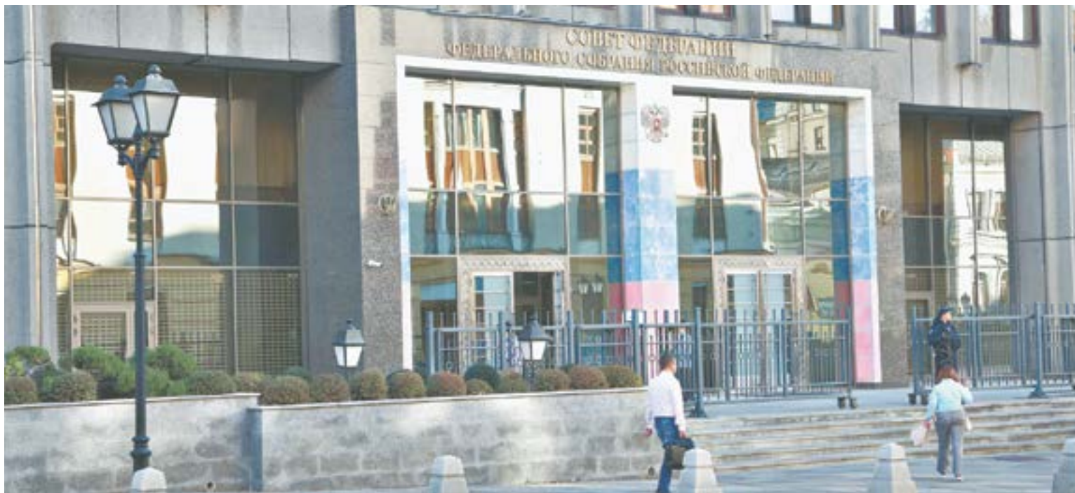
Совет Федерации – палата регионов.