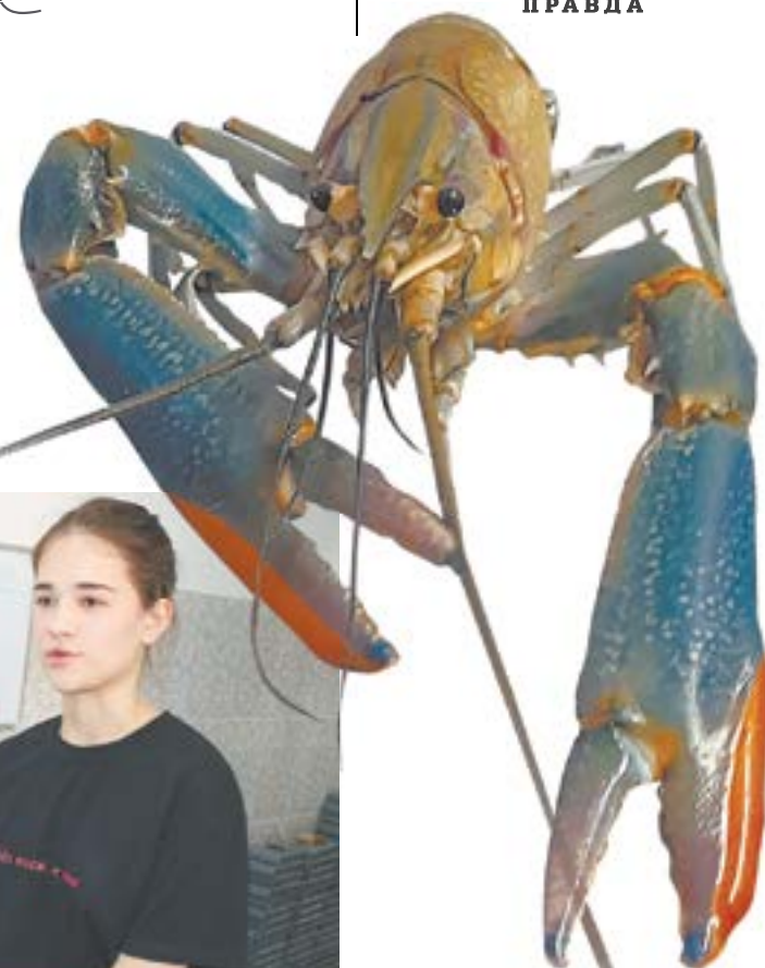
Этот самец-репродуктор за полтора года набрал вес 150 граммов.

В этом году впервые в прудах Павловского района выращено около 2 тонн красноклешневых австралийских раков. Культивированием теплолюбивых выходцев с зеленого континента занимались сотрудники «Раковой фермы Алтая». Свежий улов предполагается постепенно реализовать в кафе, расположенном по соседству с предприятием.