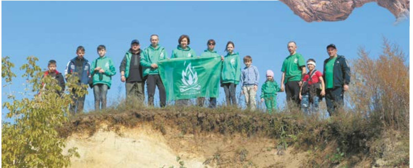
Экскурсия на выходы цветных глин у села Семёно-Красилово.

Работа объединения уже началась. Так, в минувшие выходные провели организационное собрание для желающих вступить в се-