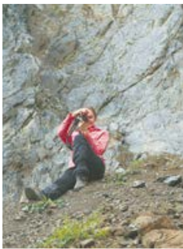
Внести в 2ГИС.