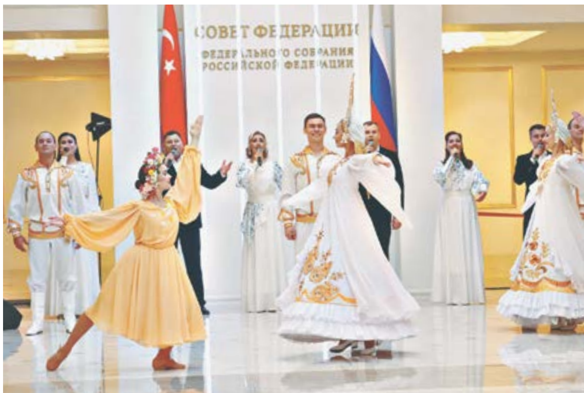
Выступает Государственный молодежный ансамбль песни и танца «Алтай».

Губернатор региона Виктор Томенко и спикер АКЗС Александр Романенко в унисон подчеркнули значимость сохранения села Сростки – родины Василия Шукшина. И были услышаны сенаторами. Бесспорную поддержку получил еще один дорогостоящий проект – в более чем 600 млн рублей – строительство двух защитных