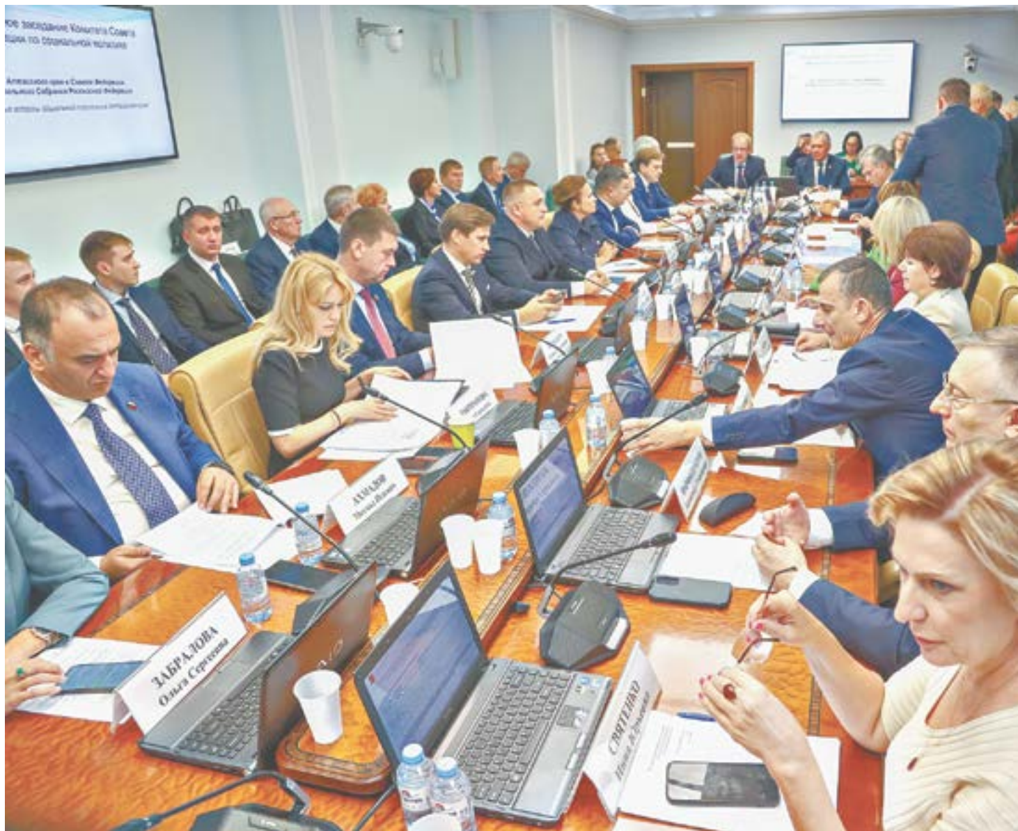
Развитие Алтайского края обсуждается на расширенном заседании Комитета Совета Федерации по социальной политике.