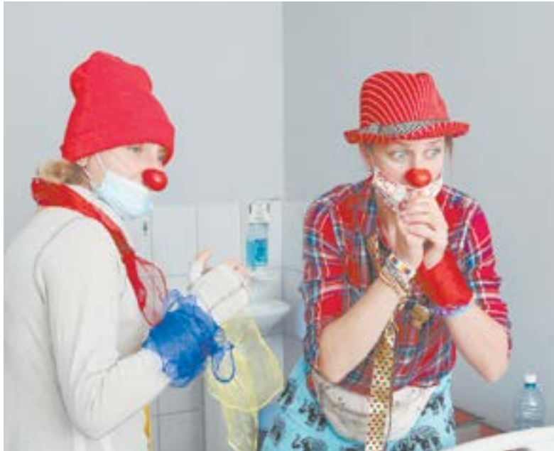
Камерный глубокий контакт человека с человеком.

«В КАЖДЫЙ СВОЙ ВИЗИТ МЫ СТОЛКИВАЕМСЯ С ЛЮДЬМИ, КОТОРЫЕ БОРЮТСЯ С ТЯЖЕЛЫМ НЕДУГОМ. КТО-ТО НАЧИНАЕТ РАССКАЗЫВАТЬ СВОЮ ЛИЧНУЮ ИСТОРИЮ, ИЗЛИВАЯ ДУШУ, КТО-ТО ДЕЛИТСЯ ПЕРЕЖИВАНИЯМИ ЗА БЛИЗКОГО. ТОГДА НА МГНОВЕНИЕ НАСТУПАЕТ ВНУТРЕННИЙ СТУПОР. ПОСЛЕ МЫ БЕРЕМ СЕБЯ В РУКИ, ПОТОМУ ЧТО НУЖНО ЗДЕСЬ И СЕЙЧАС СОРИЕНТИРОВАТЬСЯ, КАК ЛУЧШЕ ПОДДЕРЖАТЬ».