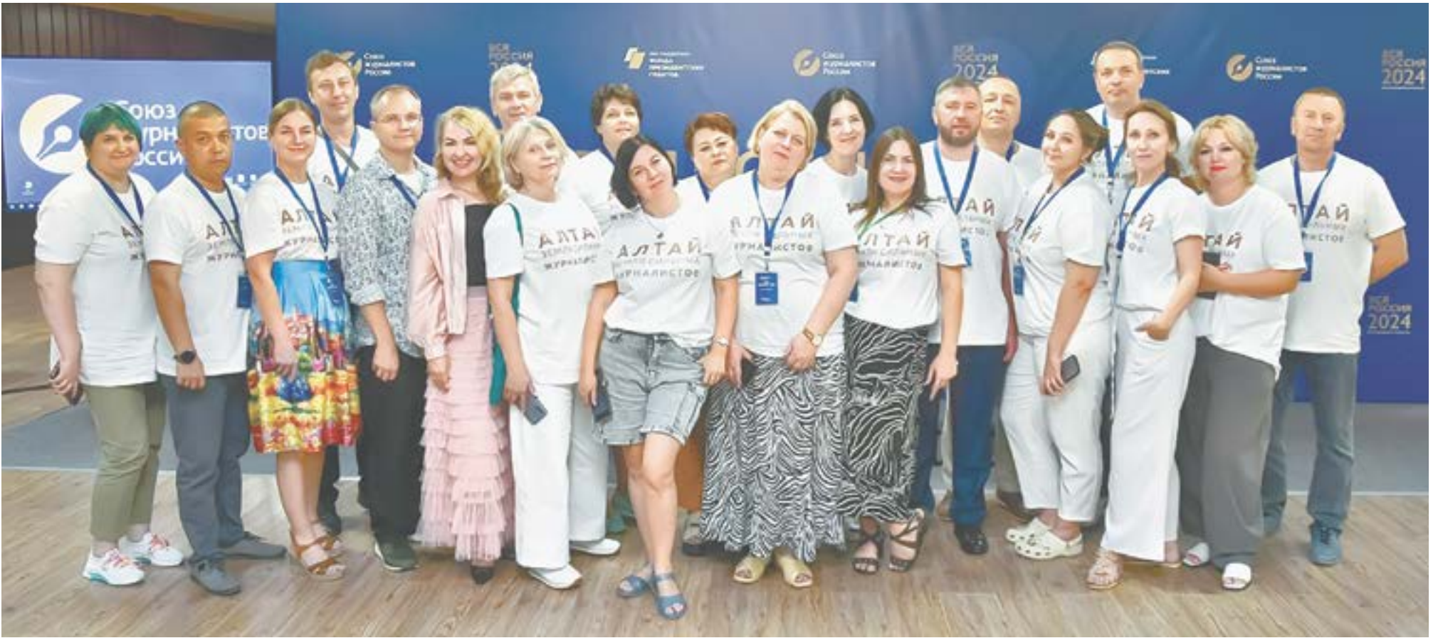
Алтай – земля сильных журналистов.