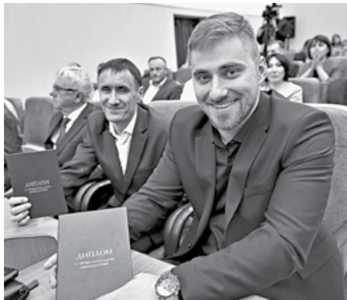
Для бизнесменов учеба – важный этап в развитии.