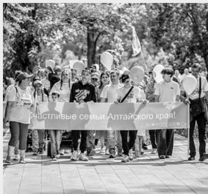
Динамика законодательства в интересах многодетных семей быстро меняется.