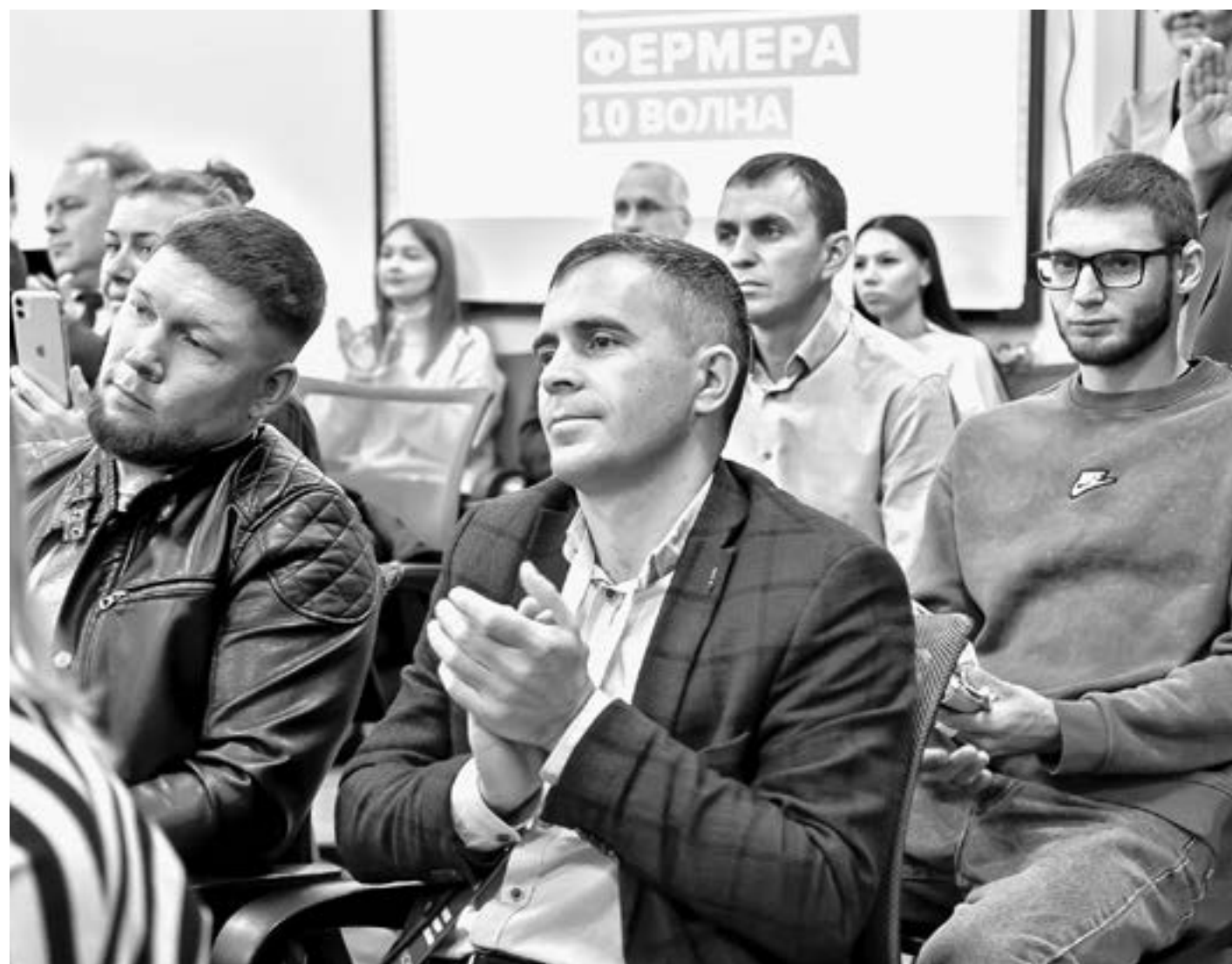
Слушатели отобраны по конкурсу.

Ректор АГАУ напомнил, что каждый набор имеет свою историю, заложенную в учебную программу. В этом году это знакомство слушателей с опытом