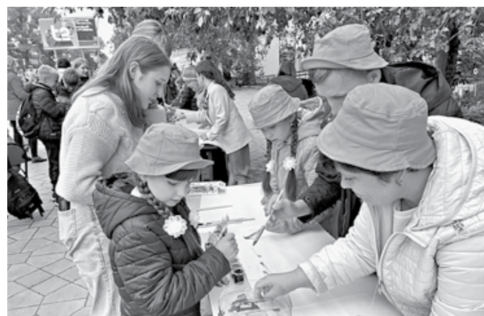
Команды приняли участие в конкурсе рисунков.

Ключ был брошен, и желающие нашлись. Ведь обязательно у участника должны