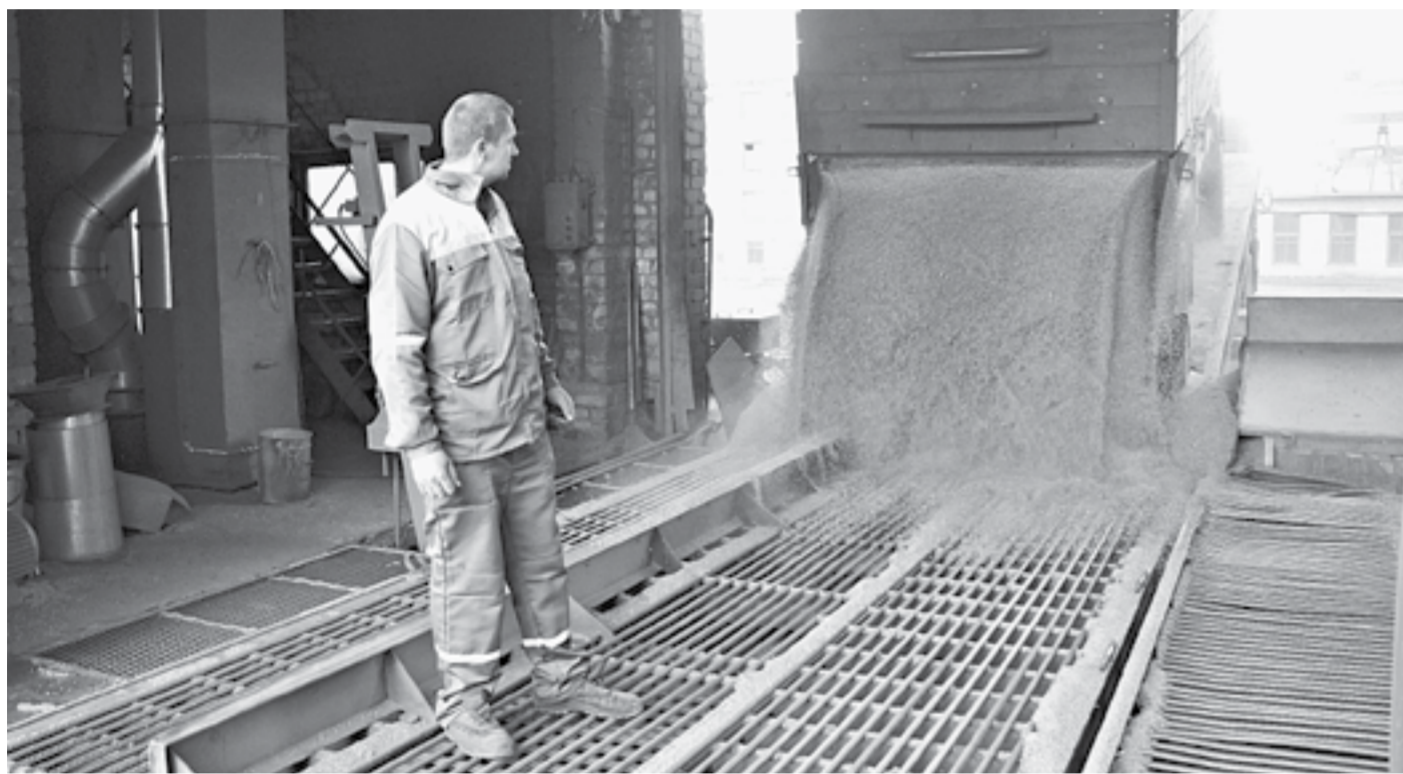
Наменский элеватор принимает 7 тысяч тонн зерна в день.