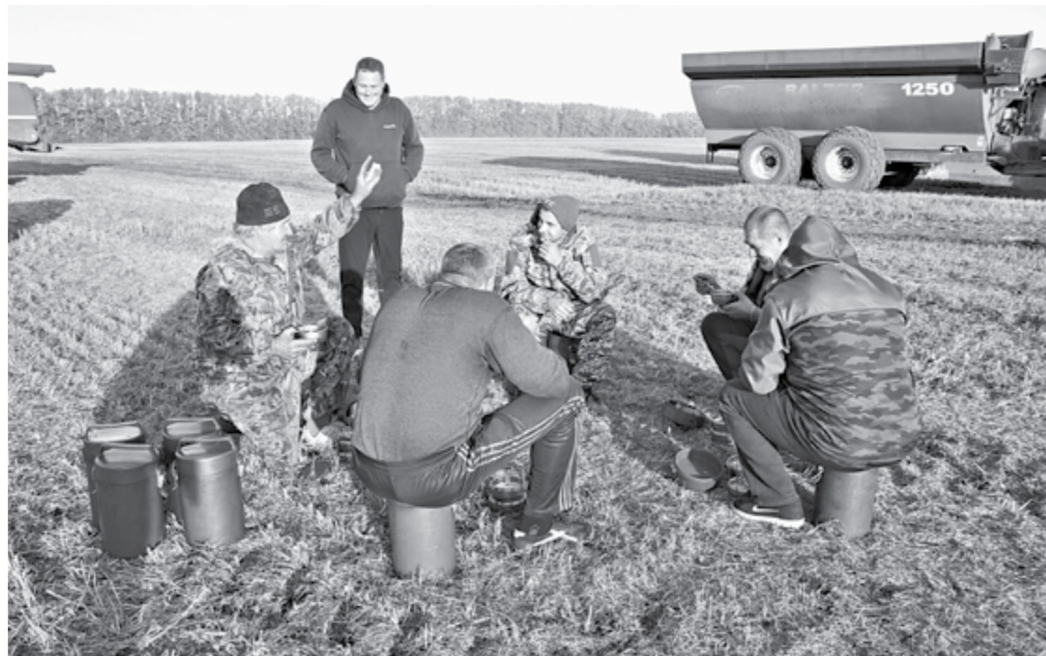
Обеды механизаторам привозят на поле из Грязново.