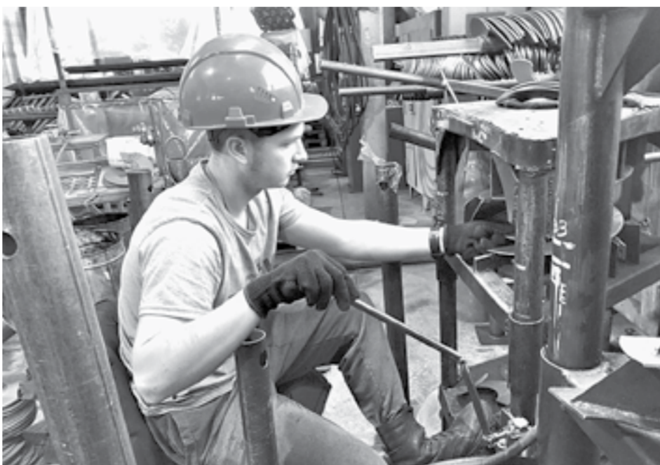
Штат сотрудников будет расширяться.

Так в 2016 году начинающий предприниматель открыл завод по изготовлению