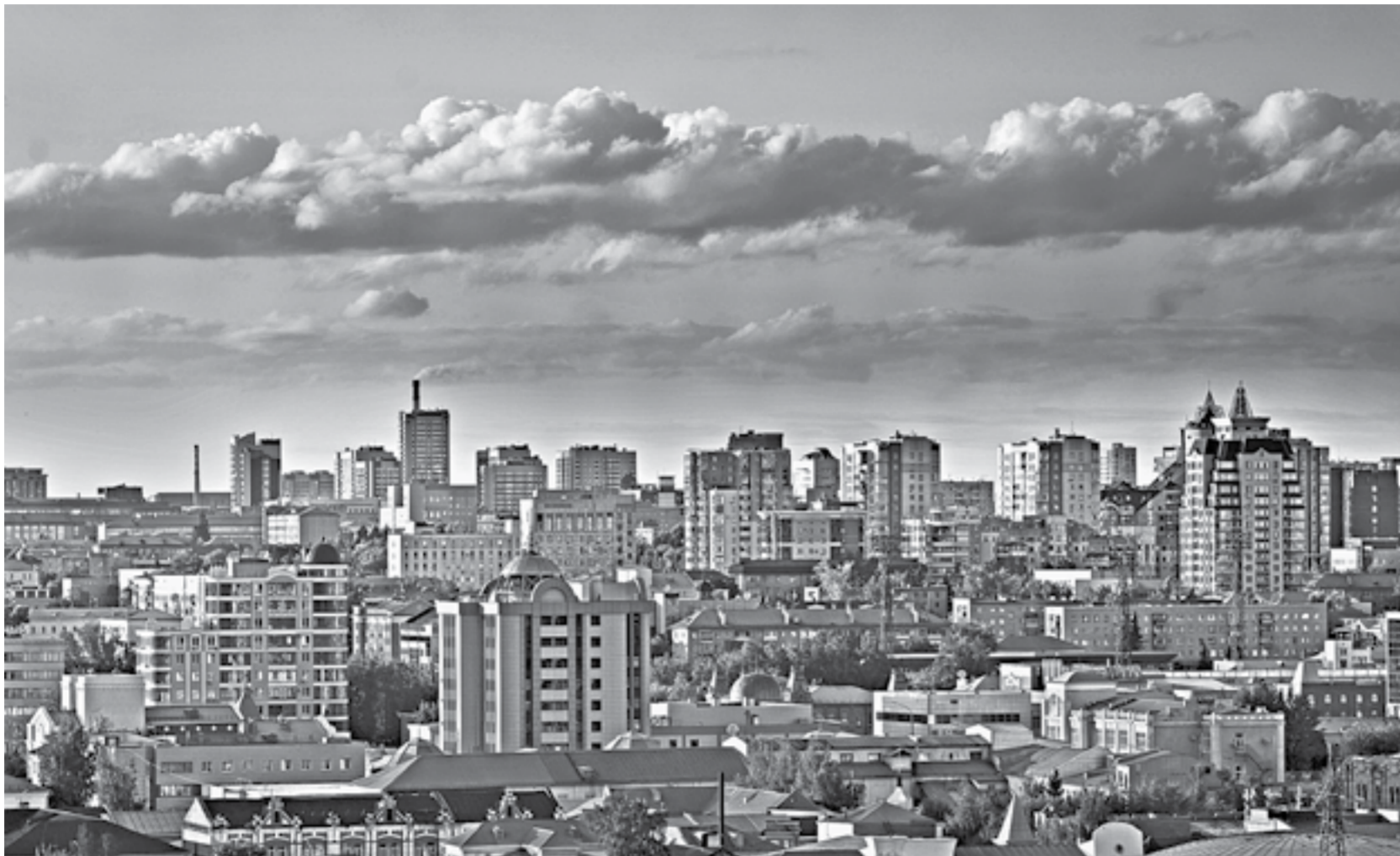
Кварталы к приему тепла готовы.