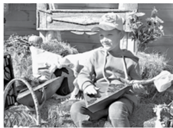
Юное поколение талантливых каменцев.

нировали ставить тот самый завод по производству грузовиков КамАЗ, название это отражает.