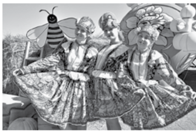
Праздничная программа удивила всех.