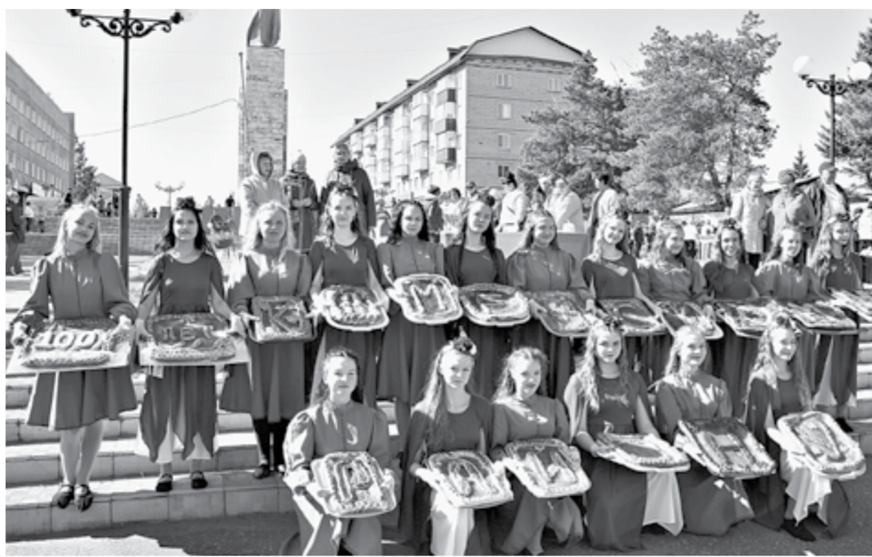
Вкусный подарок району.

В советские годы каменцы в шутку и всерьез говорили: «Закрой завтра Каменский район на замок, он не пропадет, сам себя прокормит». И в этом была большая доля правды. Здесь в свое время были налажены все сферы производства – сельскохозяйственная, продовольственная, перерабатывающая, промышленная, строительная. Все объекты строились из своих материалов, на прилавках магазинов были свои продукты питания, ткани, одежда. Разве только нефть и газ привозные. Развитые речная, автомобильная и железнодорожная логистика позволяли району развиваться. Здесь в свое время пла-