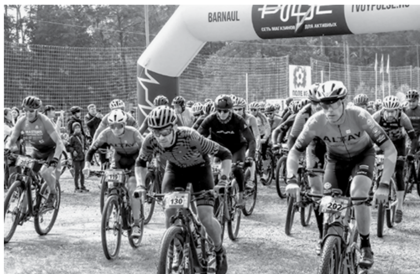
В такой толпе нужно уметь вести себя правильно.

спортсмена сопровождал папа, который после финиша обтер лицо сына платком и отпиривался на разминку перед ответственной гонкой.