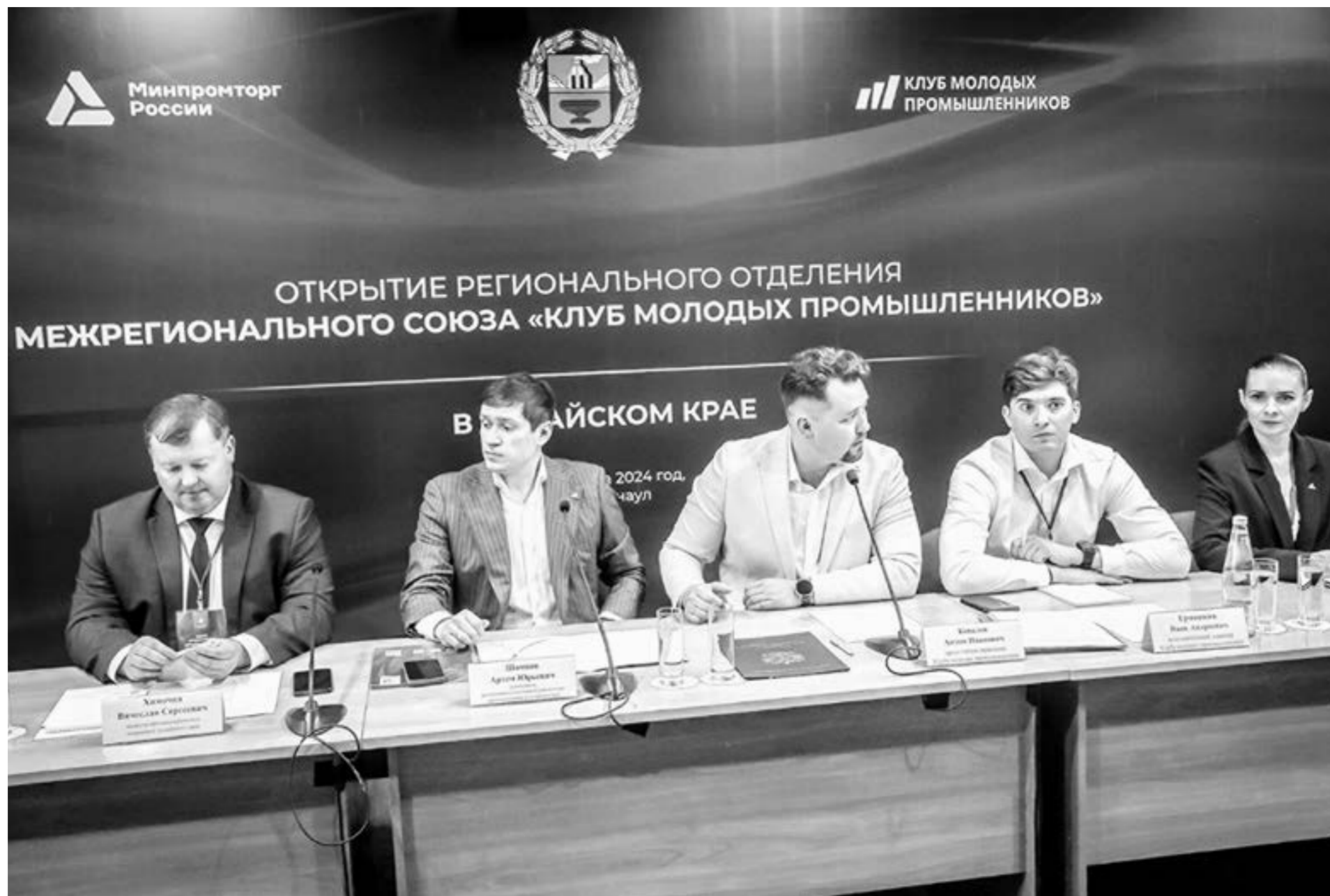
Первое заседание Алтайского регионального отделения КМП прошло результативно.

АЦИР уже разработал несколько наиболее перспективных инвестиционных проектов, которые могут быть востребованы экономикой края. Среди них животноводческая мегаферма по производству молока, логистический мультимодальный комплекс класса «А» площадью 90 тыс. м 2 . Весьма востребованной алтайскими сыроделами может