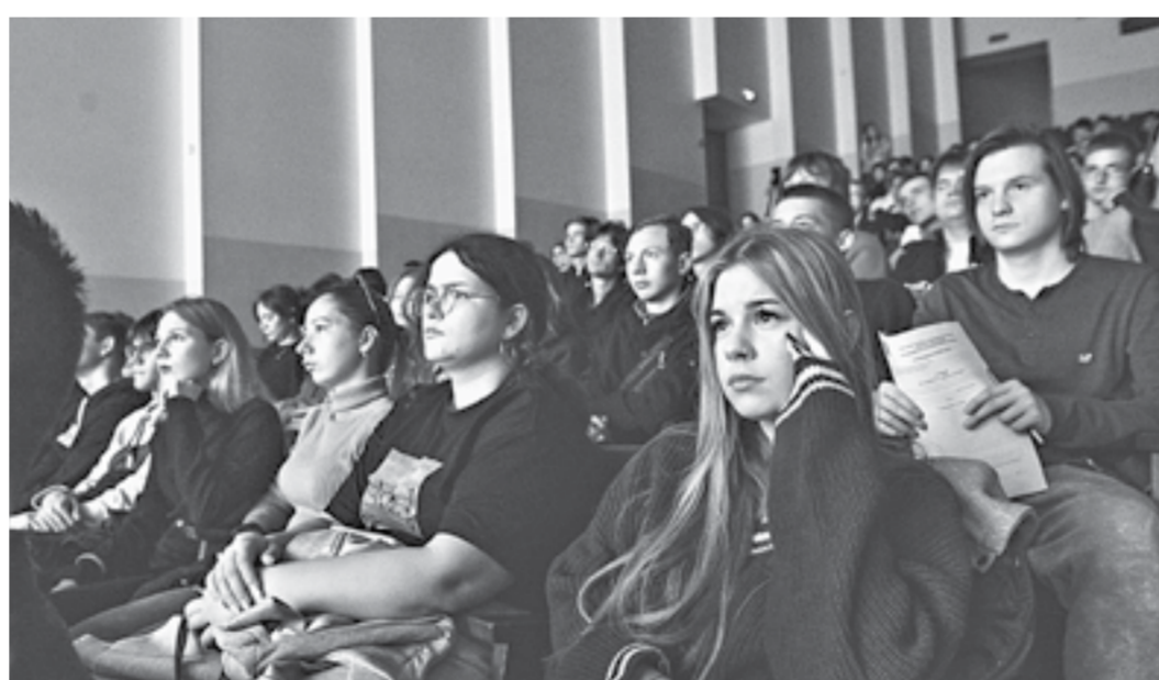
Мероприятие посетили более 300 человек.

Лента повествует о наиболее распространенных вымыслах западной пропаганды и спорах их контраргументации. Этот новый проект посвящен развенчанию мифов об исто-