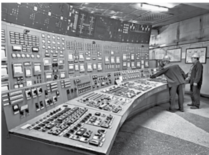
Пульт управления ТЭЦ-3.