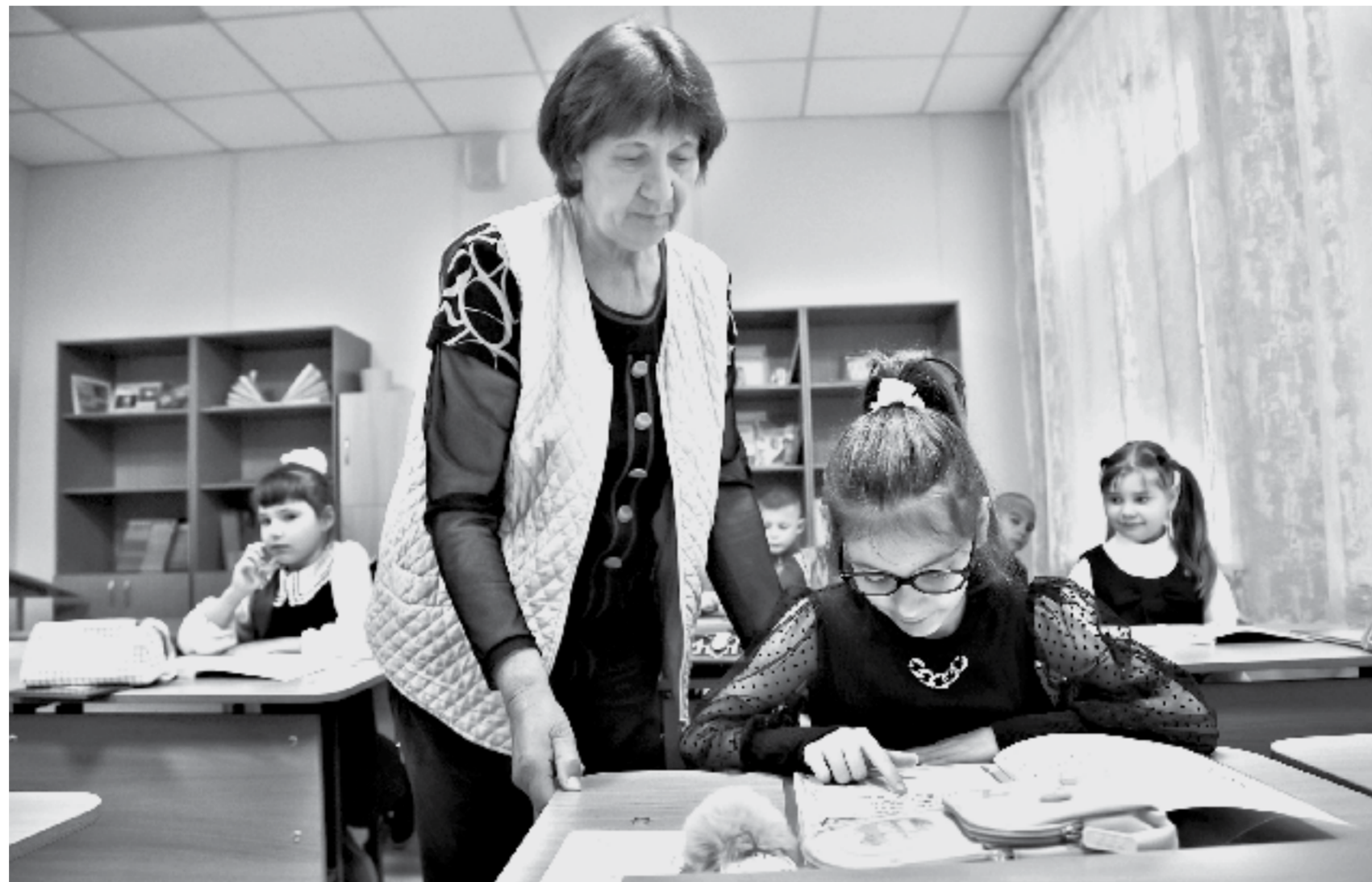
Труд учителей в разных регионах должен цениться одинаково. Урок в начальных классах Подойкинской школы Панкрушихинского района.

Вместе с этим парламентарий подтвердил, что сейчас в регионе действительно рассматривается вопрос о введении ЧС. Прошедшие дожди резко снизили темпы уборки зерновых культур и существенно повлияли на качество собираемого зерна. За неделю аграрии края смогли убрать всего 20 тысяч гектаров. Во многих