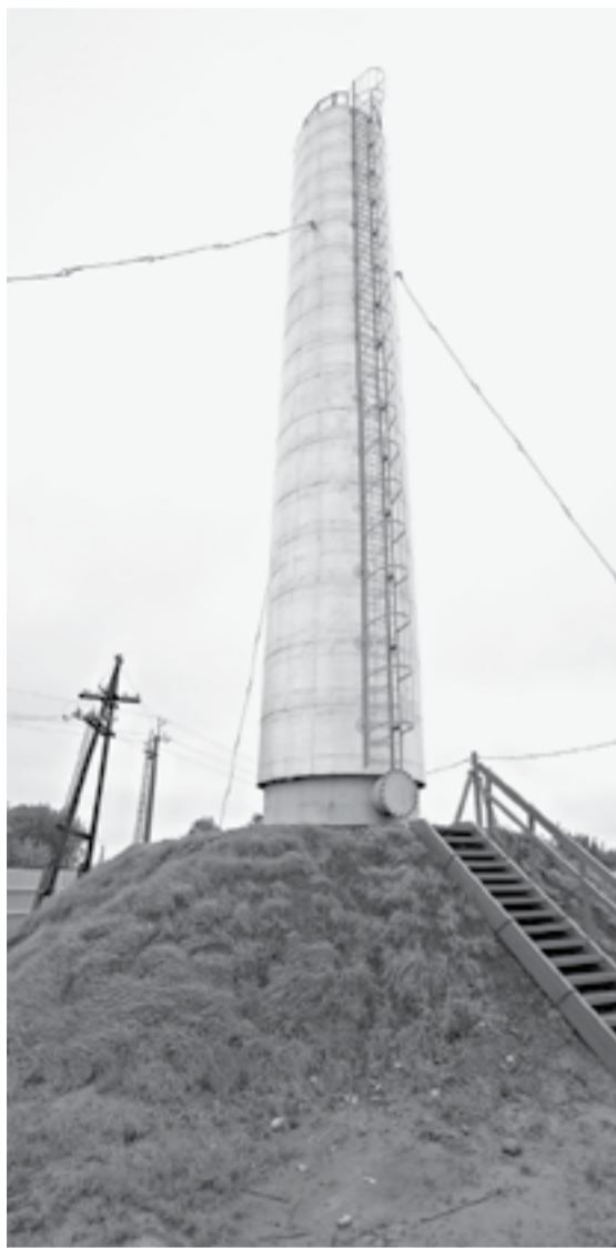
Новая башня. Таких теперь в Родино три.