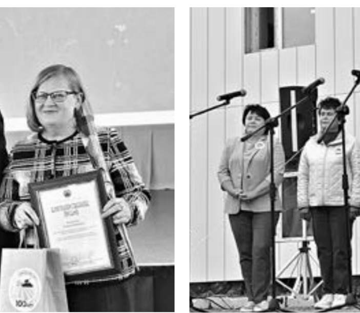
Вверх-Намышенские девчата зазывали гостей песнями.

Десятки палаток растянулись по площади, зазывая к себе посетителей. Пройди от начала до конца – и весь район предстанет перед тобой во всем многообразии!