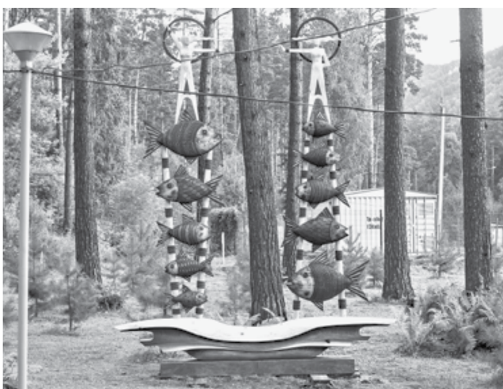
Скульптуру «Спящие» признали лучшей в командной номинации.