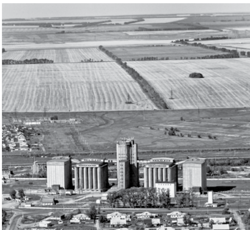
Алтайские элеваторы хранят больше 300 тыс. тонн государственного зерна.

Топ-менеджер ОЗК подчеркнул, что перед компанией государством поставлена задача сохранить в нормальном состоянии зерно, чтобы потом его можно было продать в рамках товарных интервенций. Поэтому большое внимание уделяется количественному и качественному контролю продукции. С этой целью про-