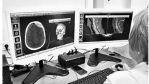
Глазами оператора томографа.

спинномозговой, тяжелой сочетанной травмами, острой хирургической патологией, также больных, находящихся на искусственной вентиляции легких.