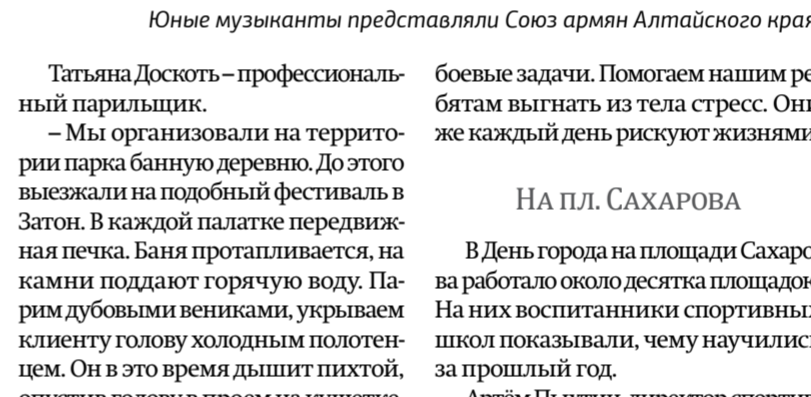
Юные музыканты представляли Союз армян Алтайского края.