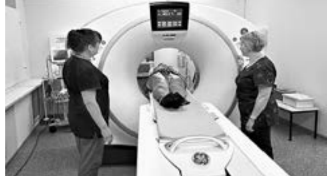
Аппарат КТ в действии.