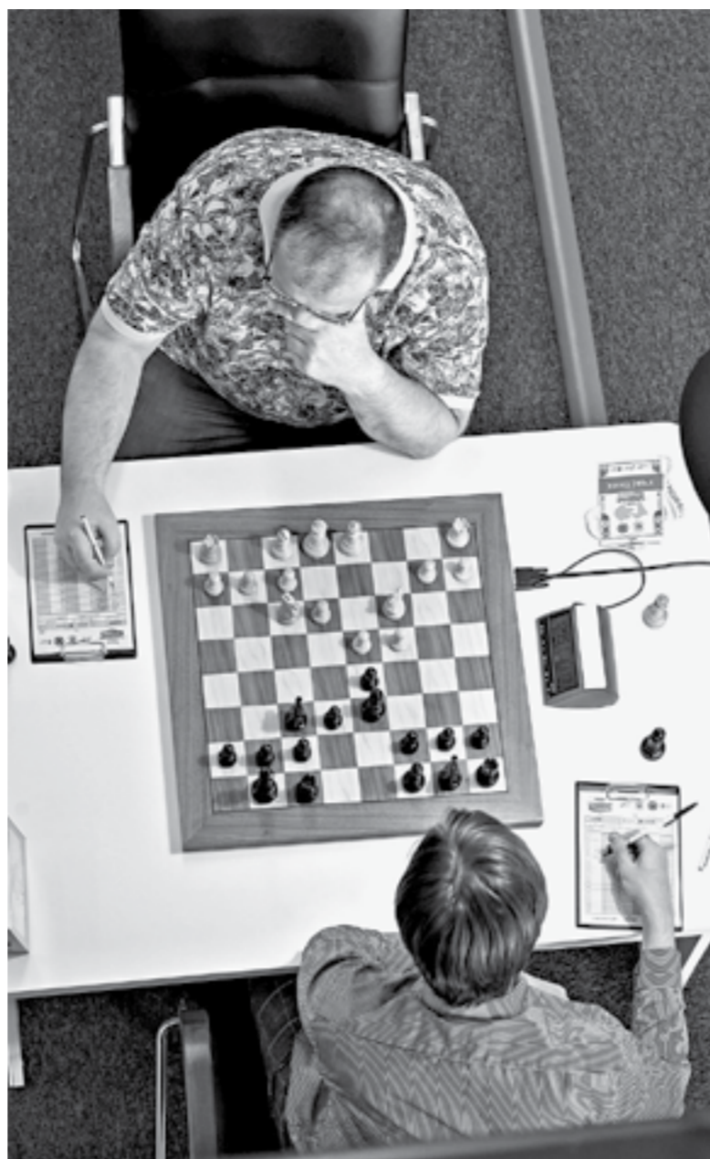
Каждый ход очень важен.

Вообще, оба турнира протекали по-разному. Мужчины были где-то даже чересчур осторожны и расчетливы. А вот женщины бились до упора, неслись с шашками наголо,