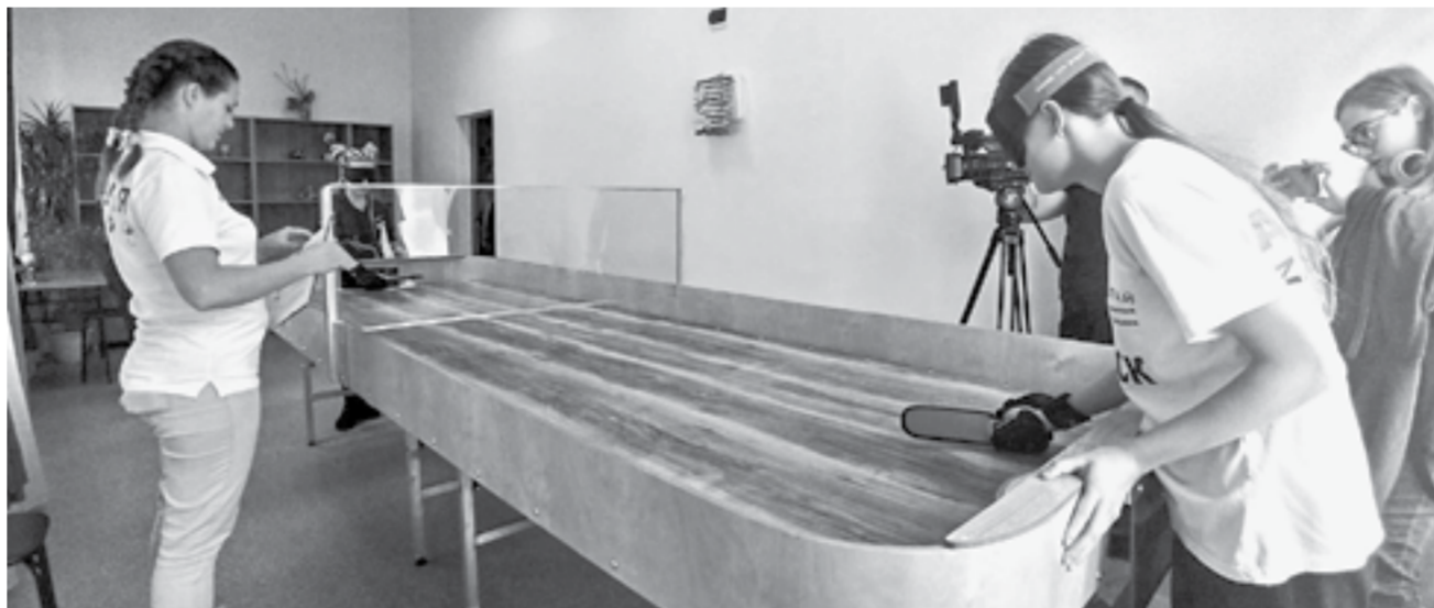
Оборудование не имеет аналогов.

Спортивные состязания начались заранее, а затем в уютном актовом зале на торжественном открытии спортсменов поприветствовало немало гостей. – Проведение соревнований такого высокого уровня – это не только