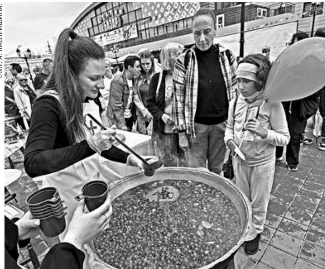
Жители города угощались сбитнем.