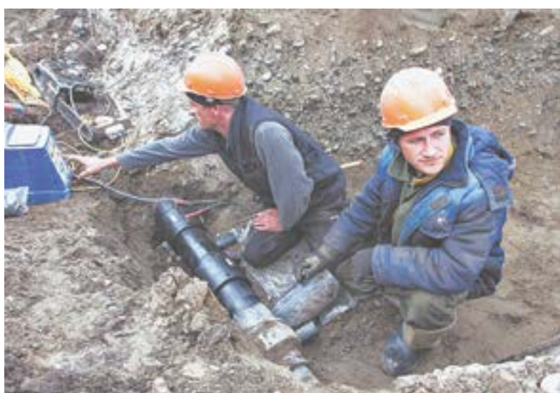
Многие вопросы касались коммунальной сферы.