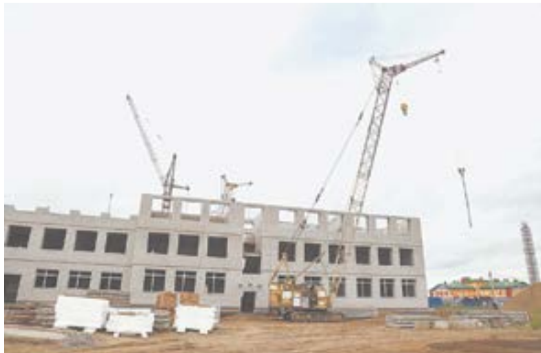
В крае постоянно строят новые объекты.