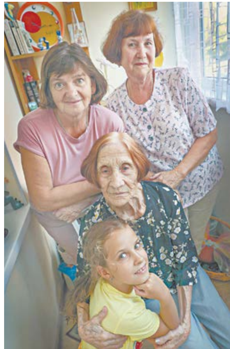
В первые дни августа талантливый учитель (в центре) принимает поздравления.

– Мы из Барнаула в Новосибирск летели самолетом. Директор школы договорилась, чтобы на месте нас заселили в общежитие рядом с театром. Некоторые из ребят тогда пытались юлить, чтобы не идти на спектакль, – рассказывает учительница. – Я тогда им сказала: «Вы только придите посмотрите, и душа скажет,