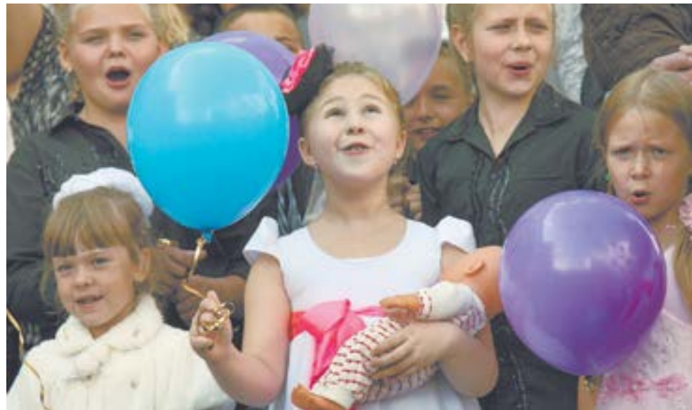
Надо, чтобы детям хватало родительской близости, учительской преданности, общечеловеческого соучастия.

– Жертвами в войну становились слабые – старики, женщины, дети. А зрелые, сильные и совестные шли воевать. У этой решимости, конечно же, была духовная пружина. Нынешние болтуны, оговаривающие советскую общность изо