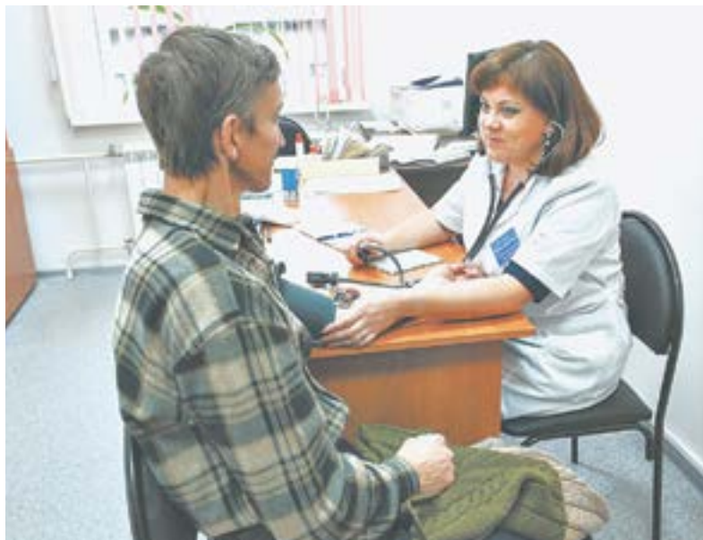
Медучреждения нацелены на помощь людям.