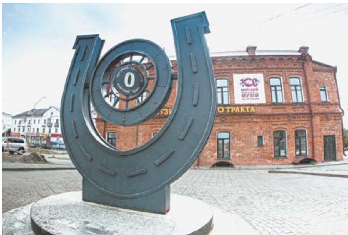
Только крупных музеев на Алтае набирается около 100.

Республики Алтай и Алтайского края: только крупных набирается около ста. Кроме того, здесь же расскажем об инфраструктуре, что находится поблизости. Так и на экскурсию можно будет попасть, и дух перевести в чайной или кафе, и остановиться на ночевку», – уточняет Виктория.