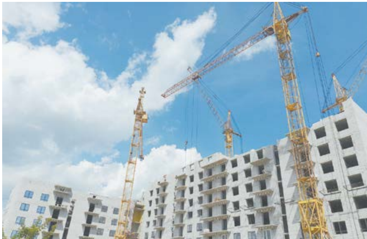
Дома в Барнауле возводятся хорошими темпами, значит, их есть кому строить.

Начальник отдела профессионального образования Минобра Алтайского края говорит, что выпускники СПО сразу уходят в армию и треть из них не возвращается в профессию. Тем более в нынешней геополитической обстановке молодые люди заключают кон-