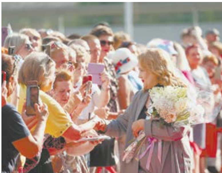
Барнаульцы с воодушевлением встречали звезд российского кино и театра.