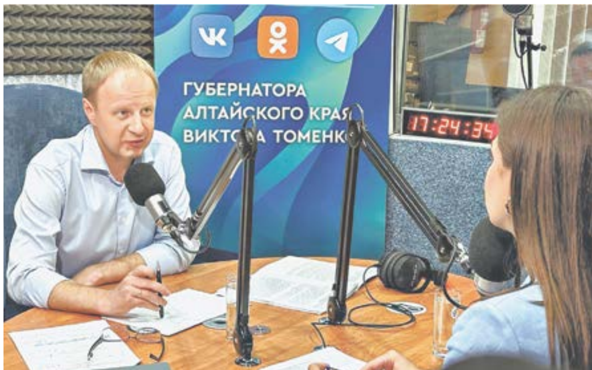
На прямую линию с губернатором прислали 1775 обращений.

По предварительным прогнозам, магистраль и газораспределительная станция будут готовы под Рубцовском в 2027 году. А уже