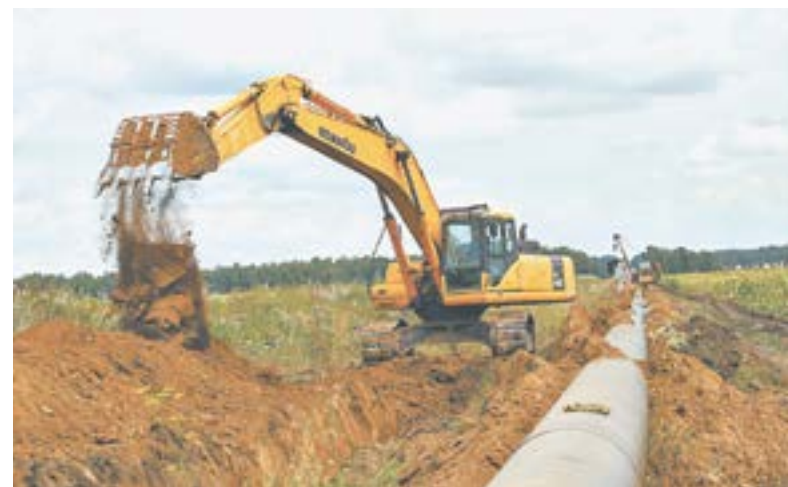
Догазификация затронет 56 тысяч домовладений.

В регионе работают филиал Фонда «Защитники Отечества», профильные ведомства, общественные движения и волонтеры. Также родственники военнослужащих могут обратиться и к местным органам власти. Если речь идет о бытовых вопросах, то зачастую помощь ока-