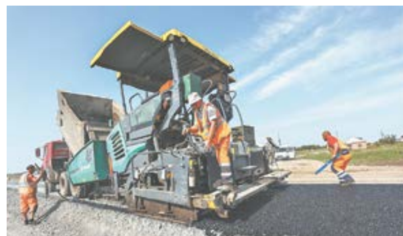
20 миллиардов рублей потратят в 2024 году на ремонт дорог.