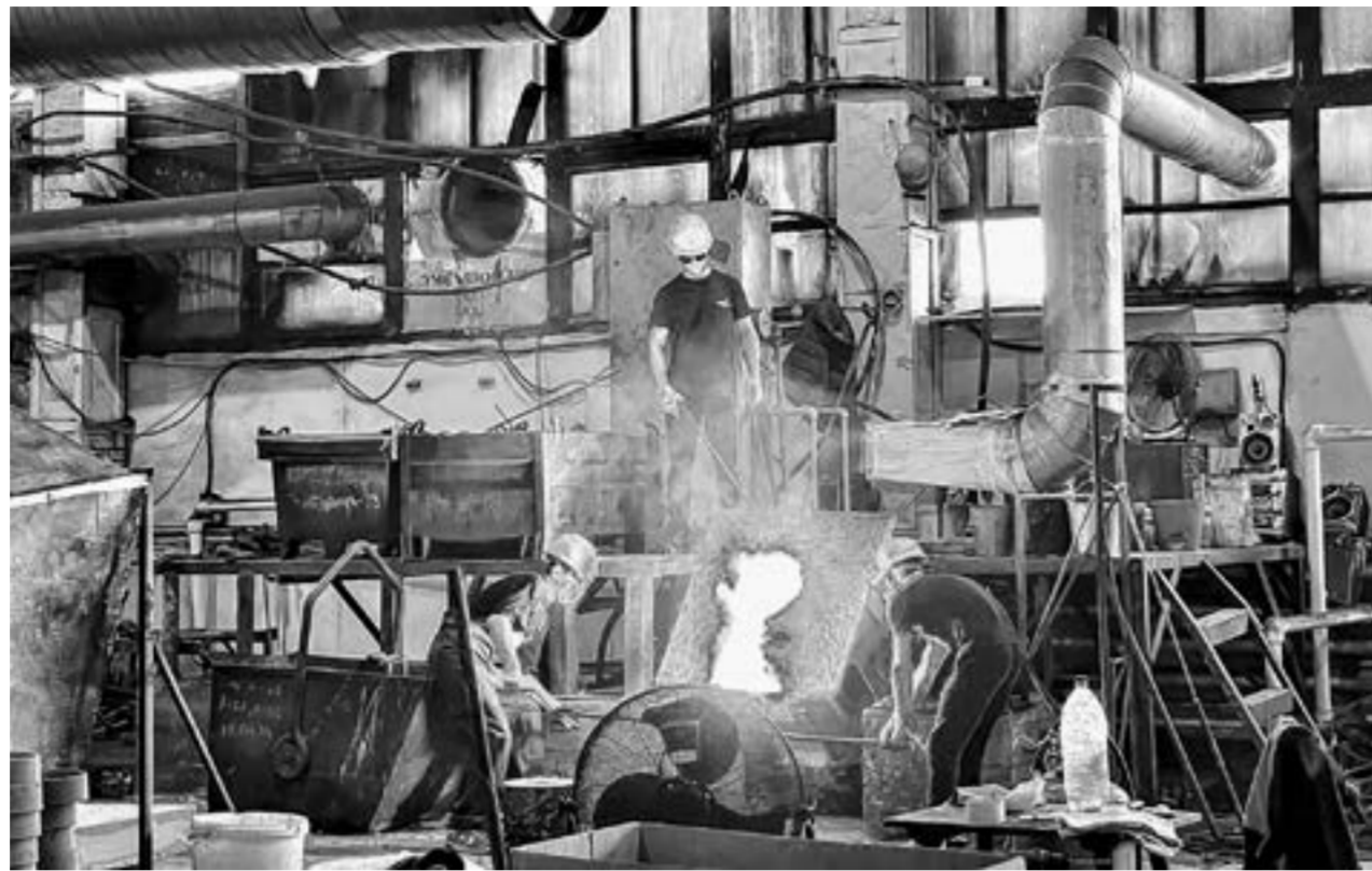
Идет плавка металла.

Основные заказчики из Москвы, потому что головные компании там. Много заказов для железнодорожной отрасли, горнодобывающей промышленности. — Производим выпускные коллекторы на самосвалы «Коммац», кроме нас, в стране их никто не делает. Изготавливаем ихники ковша под технику «Либхер». Выпускаем железнодорожные подкладки под рельсы, которые идут на строительство железнодорожных веток в Якутии и на Дальнем Востоке, — приводит примеры директор. — Это требует определенных усилий, компетенций. Но данная ниша не занята во всей России.