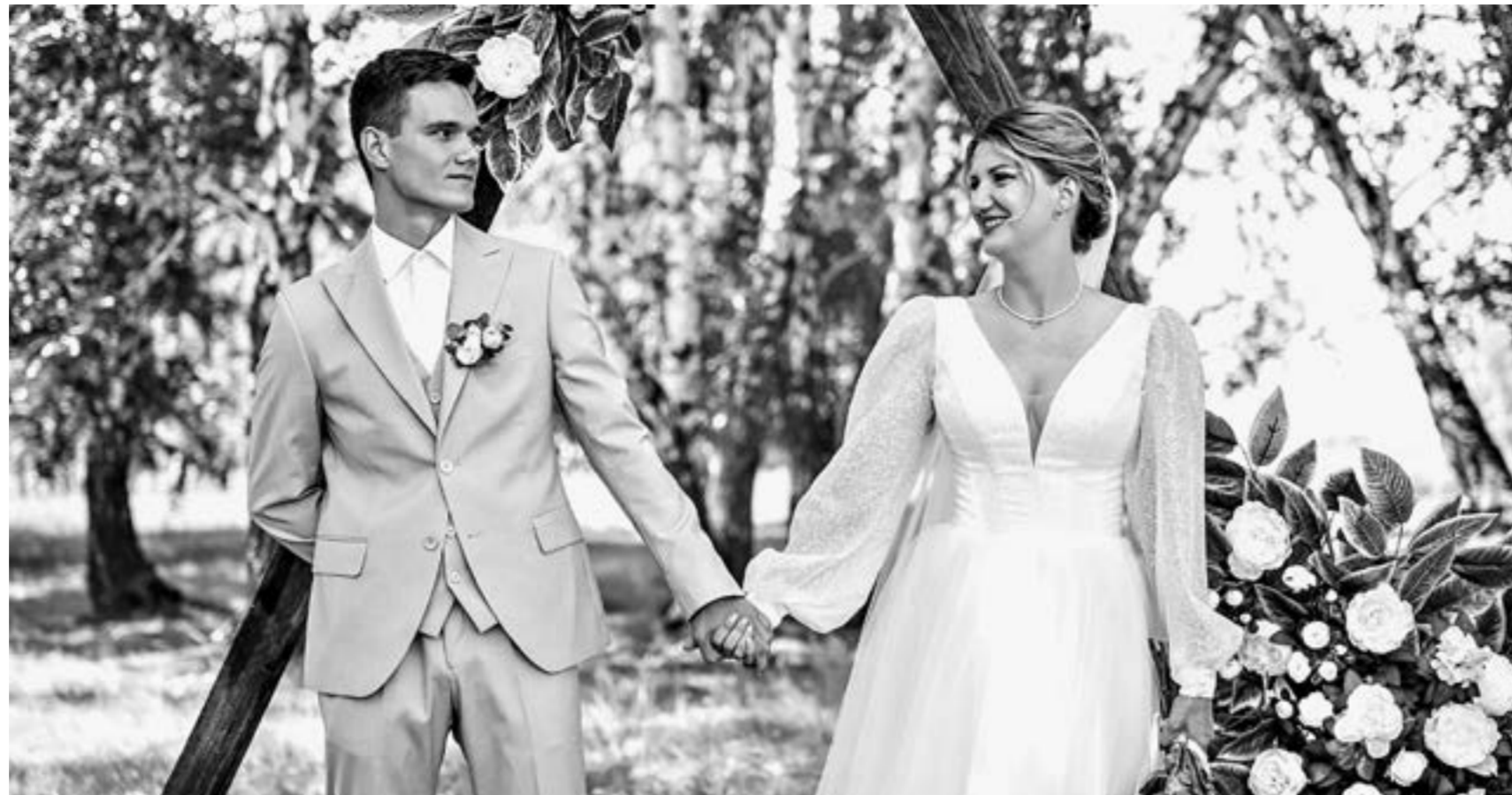
Молодожены счастливы и без цветов.

Молодожены из Камня-Оби отказались от свадебных букетов в день регистрации брака и попросили подарить вместо них корм для бездомных животных.