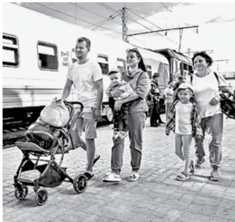
До отправления несколько минут.