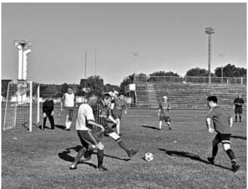
Товарищеский матч ветеранов «Торпедо» и «Стоуна».