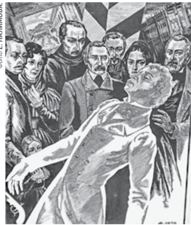
Ксилография В. Сыслова. Художественный музей.

«Взгляд в мечту» – выставка к 130-летию со дня рождения советского живописца и графика Александра Самохвалова (1893–1971). Произведения из коллекции музея (0+).