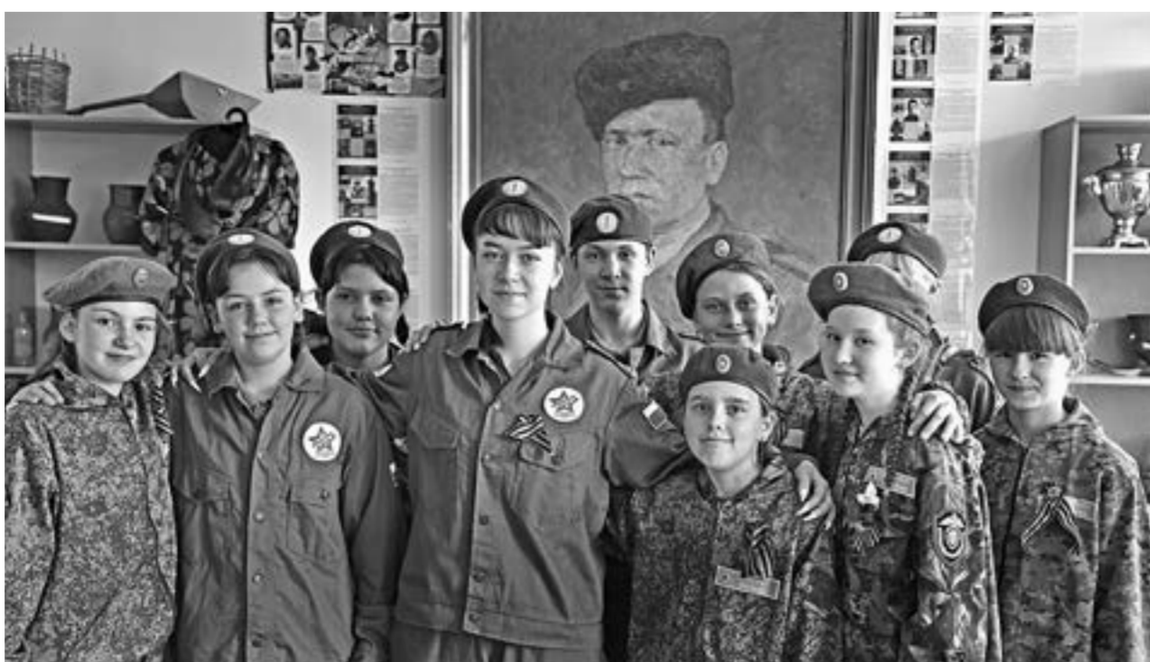
В составе «Фанела» – более 30 ребят.