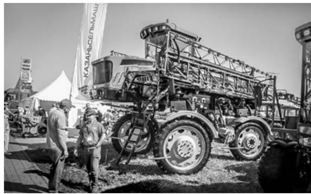
Здесь можно увидеть все виды отечественной сельхозтехники.