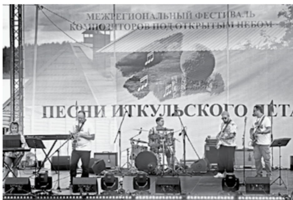
Сцена под открытым небом оборудована всем необходимым.