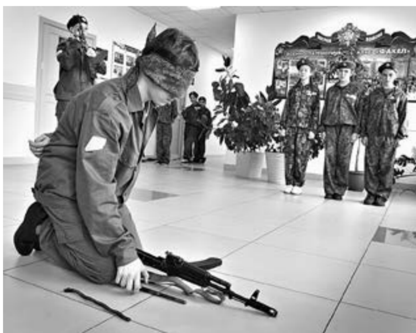
Любой может найти занятие по душе.