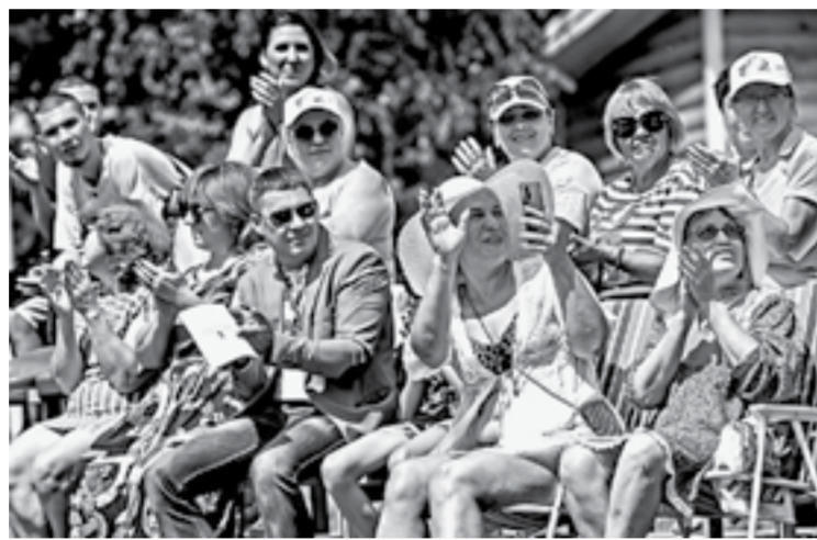
Поддержка от коллег и зрителей.

В следующий раз, возможно, с гуслими приеду».