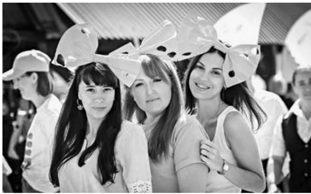
Агрофорум стал ярким праздником.