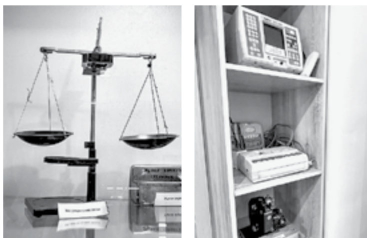
Экспонаты музея показывают развитие отрасли.