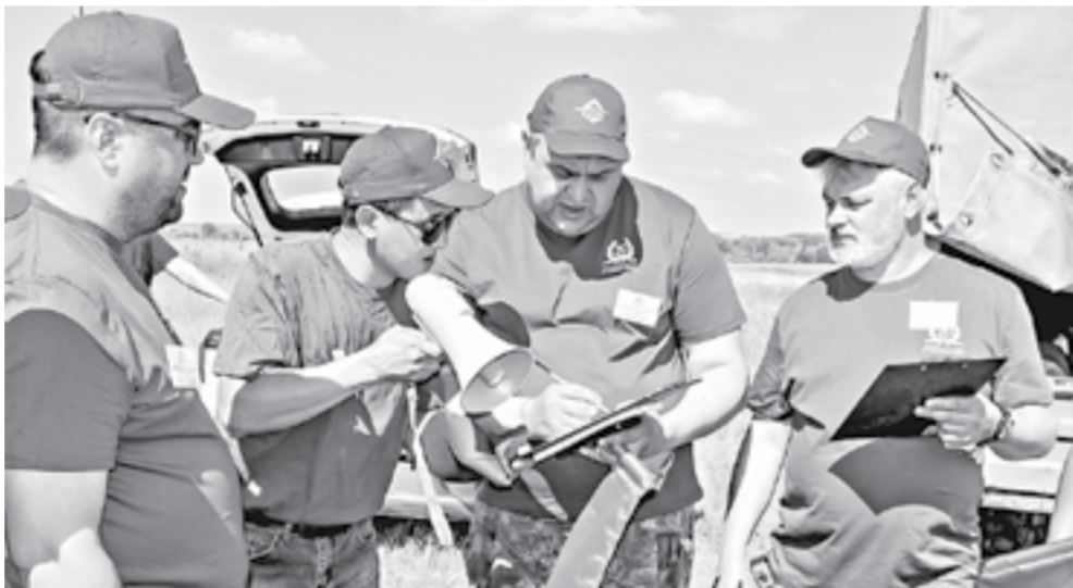
Совещаются судьи грейдеристов.

На предварительных испытательных этапах во всех дорожных управлениях были отобраны более 150 лучших специалистов широкого профиля – водители погрузчиков, самосвалов, бульдозеров и экскаваторов, грейдеристы, механизаторы и геодезисты. Они продемонстрировали профессиональные навыки своей работы в необычном формате.