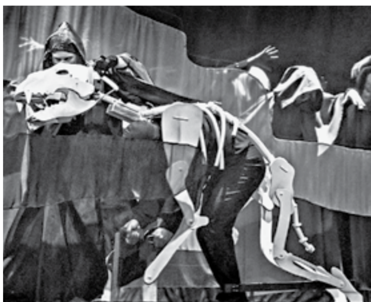
Собака в спектакле – эффектная кукла.