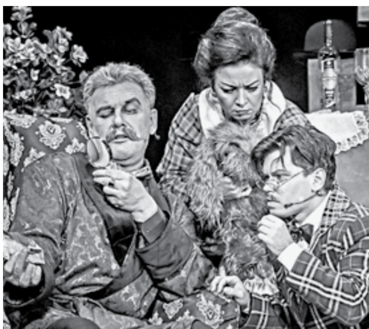
В гостиной Холмса.

И пока серьезные Ватсон в костюме-тройке в серую клетку изучает забытую неизвестным