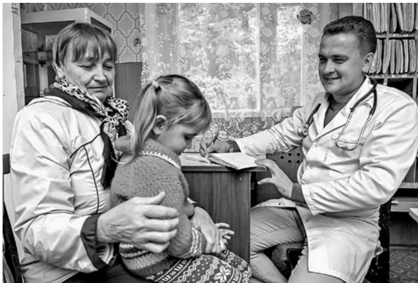
Сельчане без помощи не останутся.

Доступность медицинской помощи реализуется через проекты управления расписанием, перераспределения функций персонала, новых подходов к направлению пациентов в медорганизации 3-го уровня.