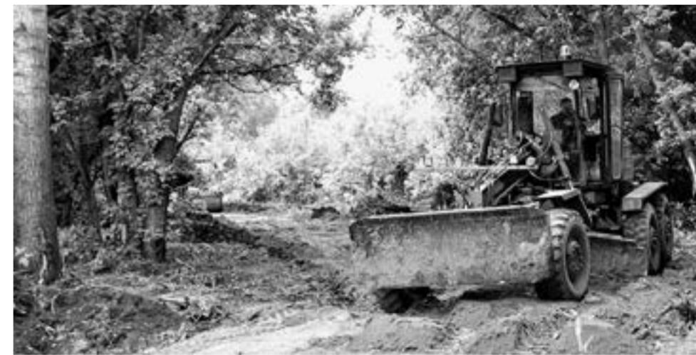
Закладывается новая пешеходная дорожка.

В этом году на субботники вышли многие организации, совет ветеранов, студен-