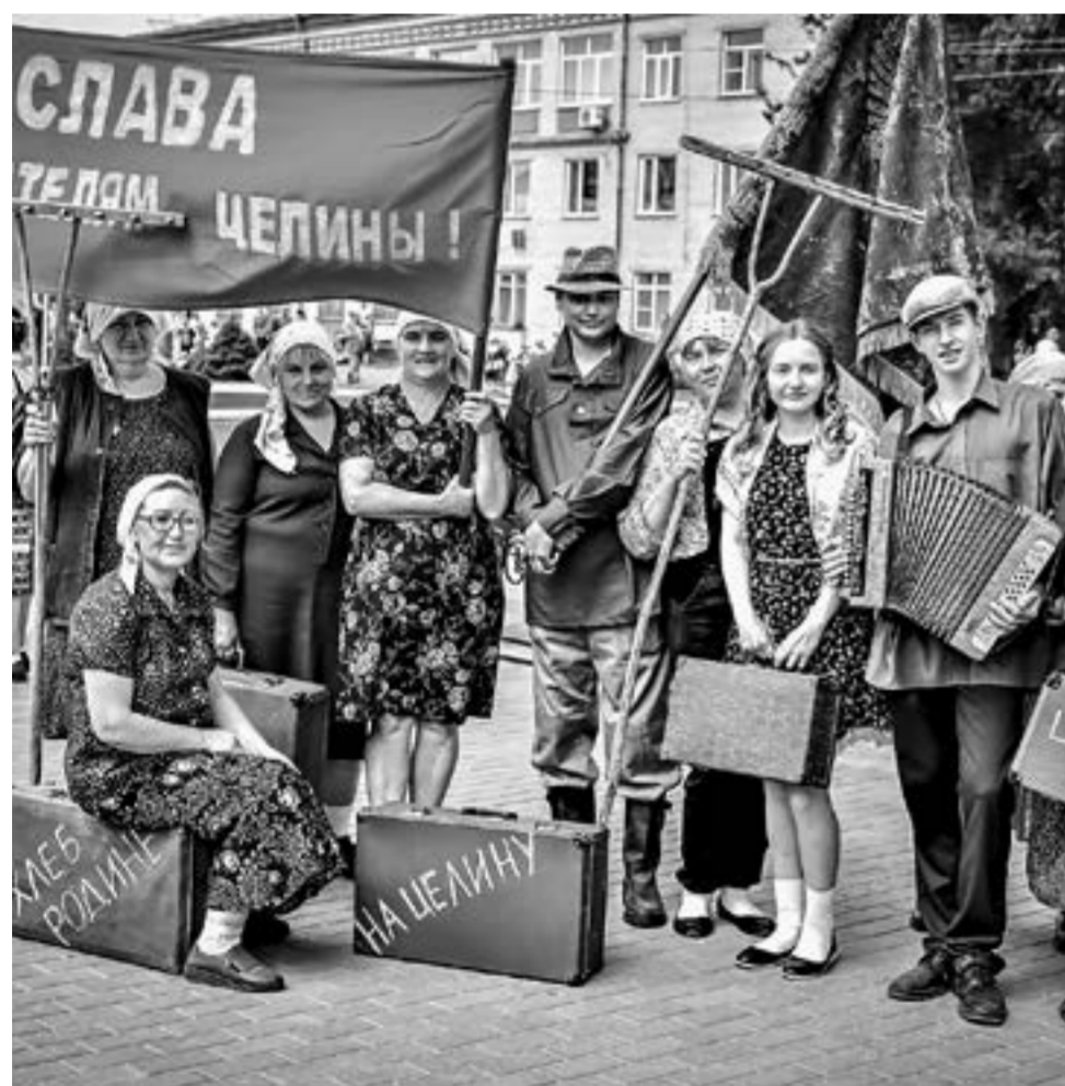
Праздник напомнил об истории района и края.

Завьяловскому району исполнилось 100 лет. Эту дату ярко отметили наши земляки на главной площади райцентра.