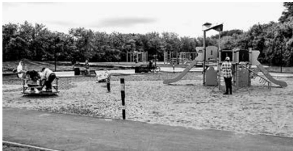
Вместо пустыря и помойки – парк.