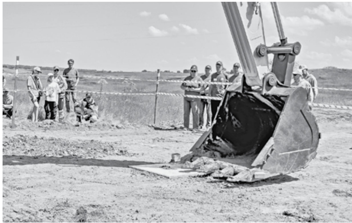
Задание: «Нубик – в центр цита!»