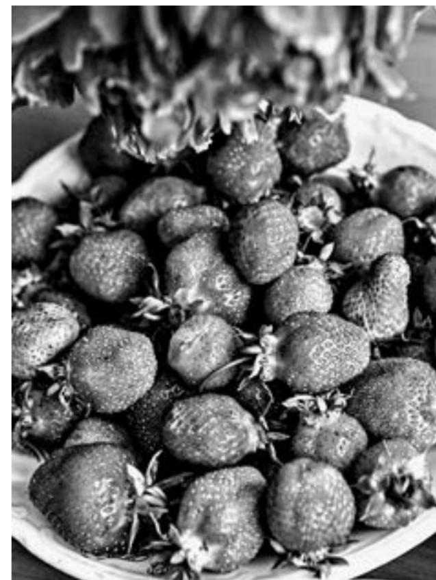
Основной объем продукции уходит в Новокузнецк.

Начало сбора виктории ожидается в середине июля. В этом году урожай, судя по всему, будет невысокий, так как ягода молодая. Допускать на поля покупателей, как это практикуют, например, в Михайловском районе,