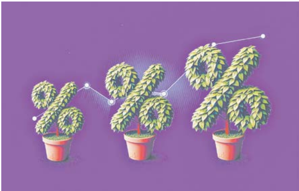
Прогрессивная шкала налогообложения коснется небольшого числа физических лиц края.

– Ничего страшного в планируемой налоговой реформе я не вижу. Экономика демонстрирует рост, по итогам года правительство надеется получить прибавку около 4%. А Всемирный банк поставил Россию на четвертое место в мире