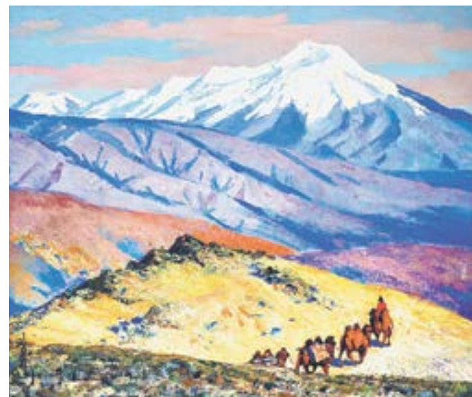
За маленьким караваном – к далеким горам.