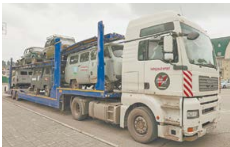
Шесть автомобилей отправили в зону СВО.

корд России по самому масштабному мастер-классу рисования в технике эбру. В парке «Центральном» прошли показательные выступления фехтовальщиков, на сцене пели и танцевали дети. На площади Сахарова прошли учебно-тренировочные поедин-