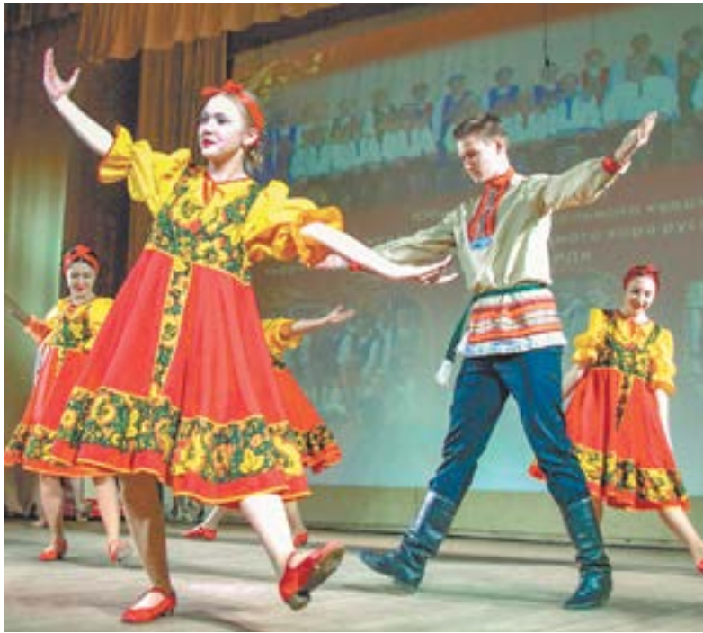
На базе хора работает несколько ансамблей.