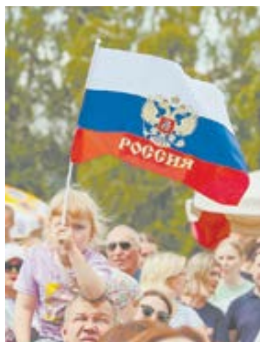
Флаг объединил всех.