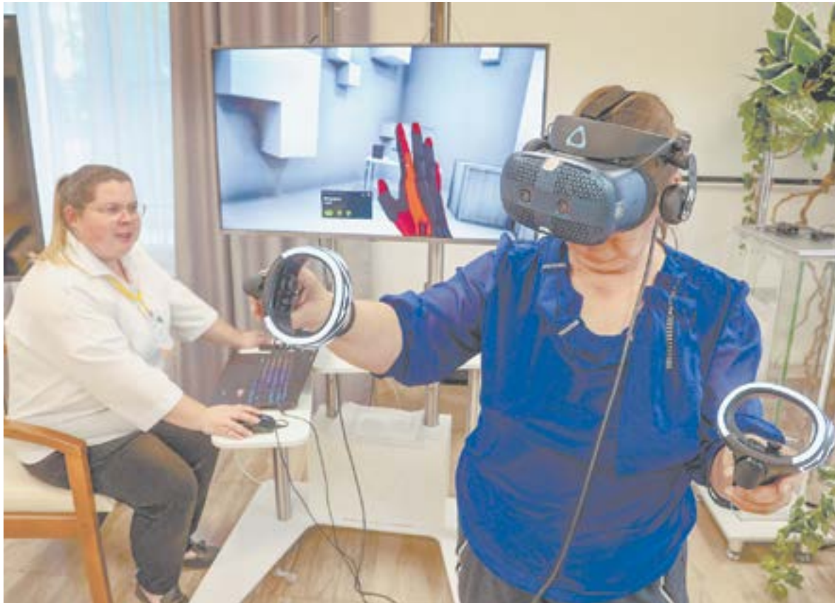
Подопечные центра осваивают виртуальные технологии.

– Скажем, случился инсульт у бабушки, которая и с вну-