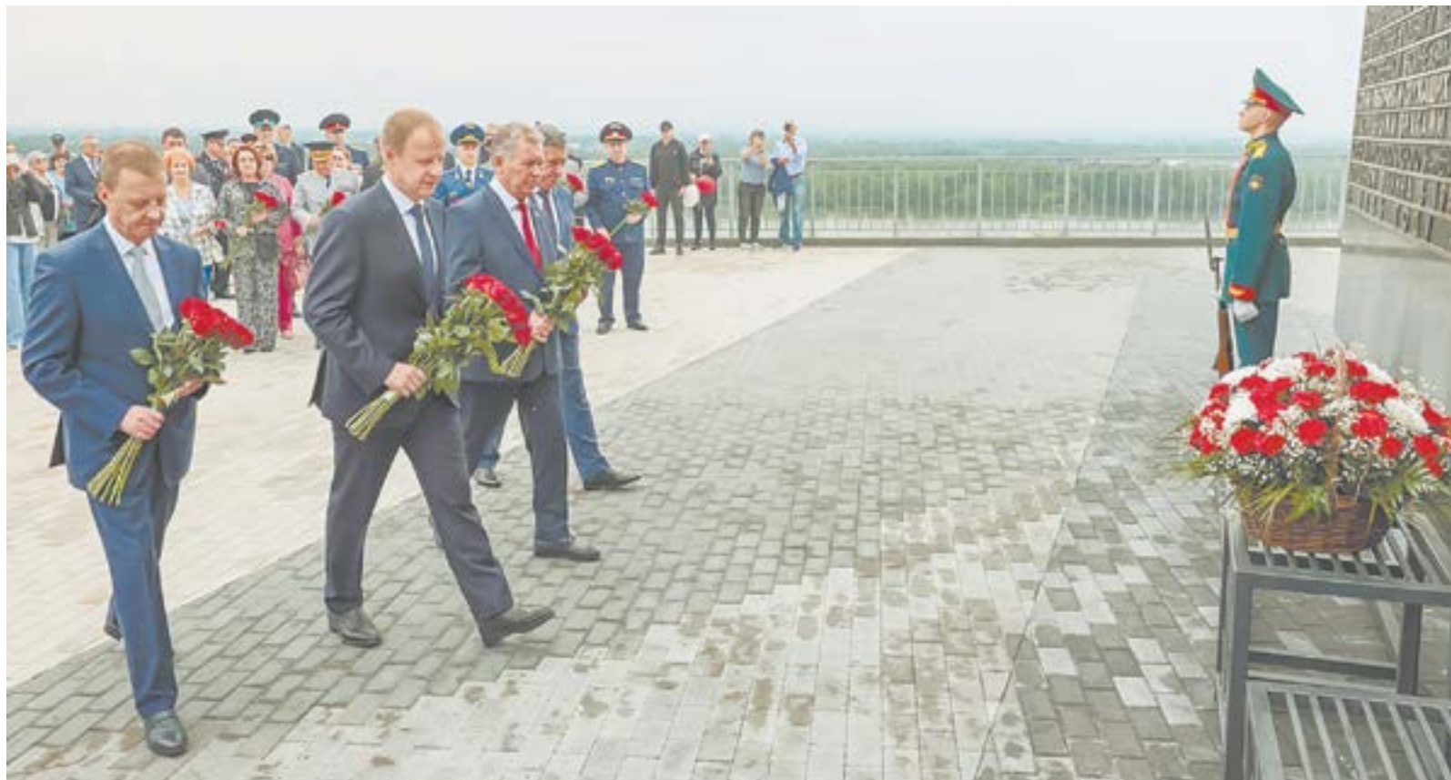
Возложение цветов у стелы «Город трудовой доблести».

Праздничные площадки организовали в районах, в Домах