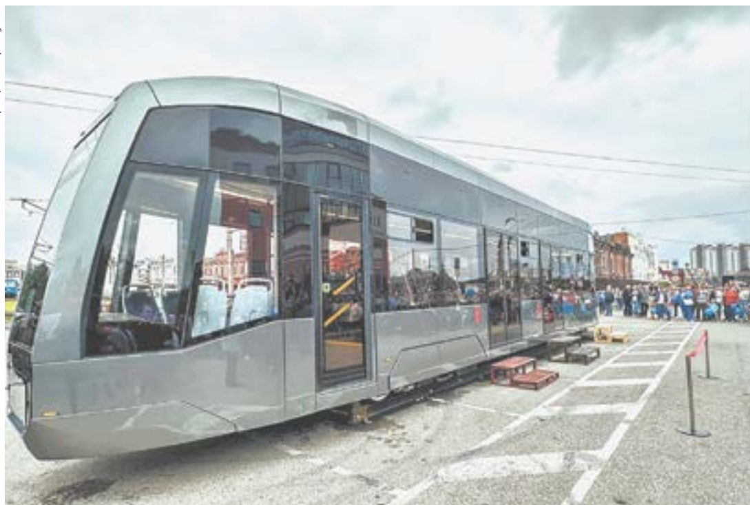
По улицам будут ездить именно такие вагоны.

Сейчас подготовлен цех, практически конвейерная линия, подняты компетенции сотрудников, разработана техническая документация. Ведутся переговоры о сотрудничестве с коллегами из Нижнего Новгорода и Санкт-Петербурга. Главная задача, которая стоит перед производителем, – выйти на рынок сбыта и стать конкурентоспособными. А перспективы огромные, включая сборку не только трамваев, но и троллейбусов, электробусов.