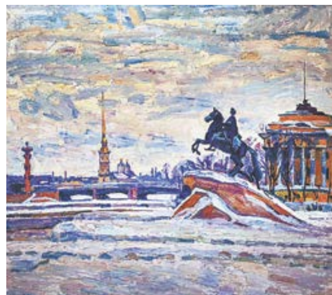
Альберт Папикян. «Ленинград. Памятник Петру I» (1982).