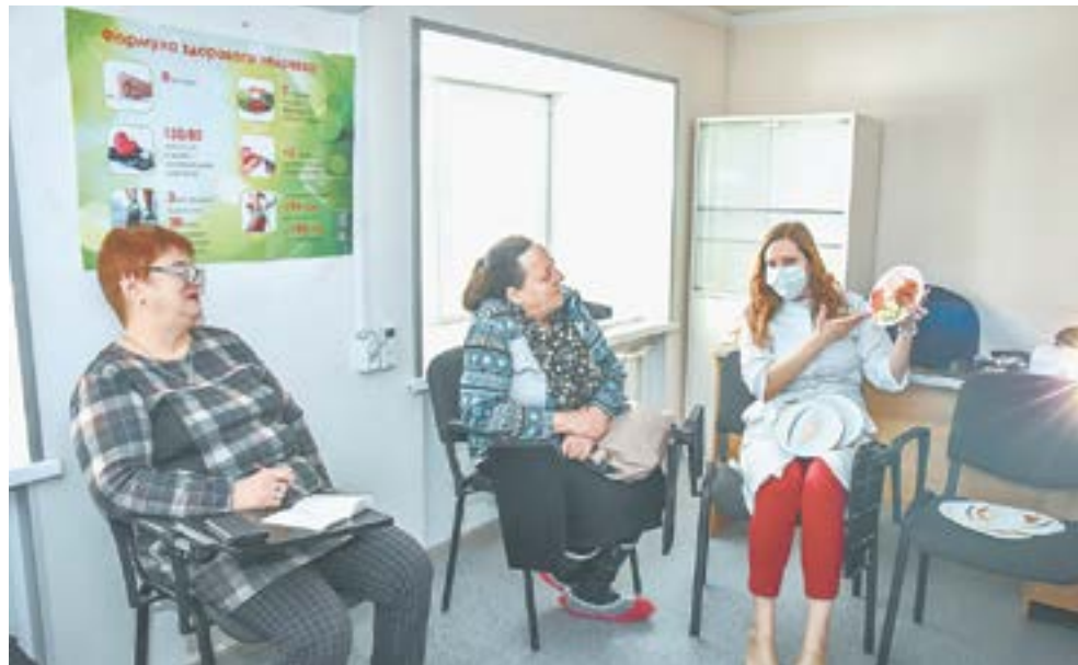
Сделали все для удобства посетителей, чтобы они могли в короткие сроки пройти необходимые комплексные обследования и получить квалифицированное лечение.

– Поэтому сделали все для удобства посетителей, чтобы они могли в короткие сроки пройти необходимые комплексные обследования и получить квалифицированное лечение, – продолжает заведующая центра. – Так, хирург из кабинета диабетической стопы оказывает помощь с сентября