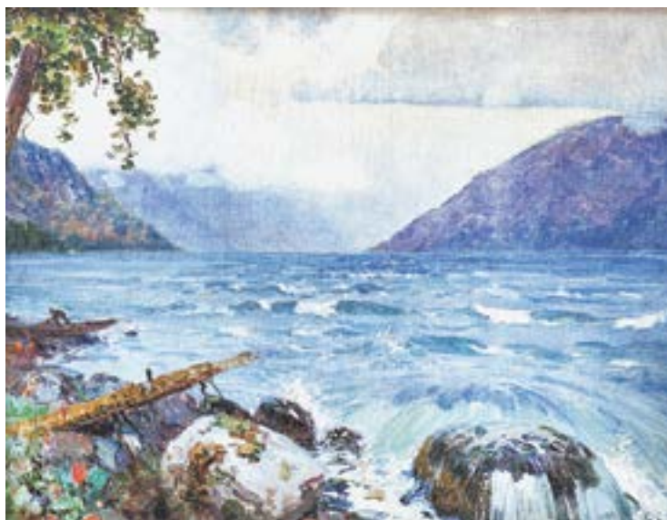
Телецкое озеро глазами Григория Гуркина.