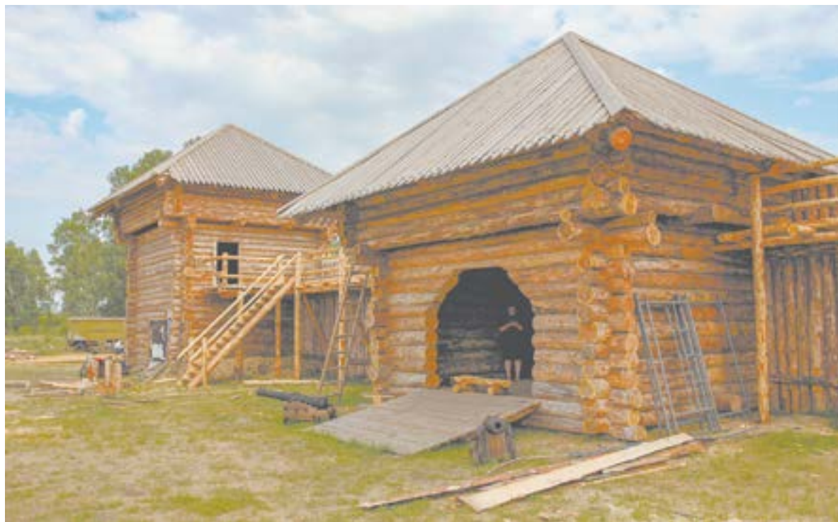
Новоделы реконструкторов – для туристов, а не для историков.