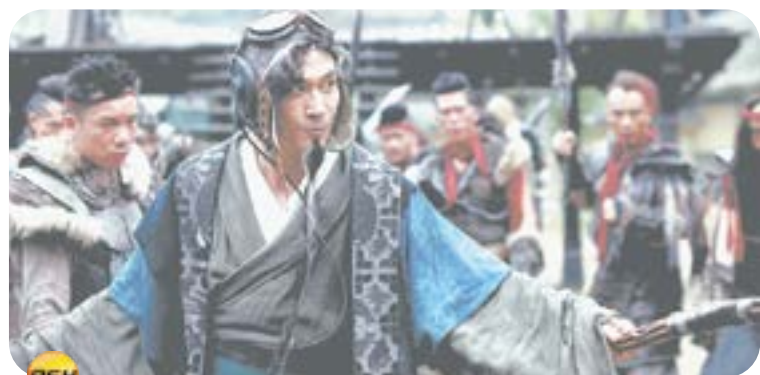
16.05 Х.ф. «ВРАТА ВОИНОВ» (12+)

00.25 Т.с. «Семь жен одно- го холостяка» (16+) 01.50, 17.40, 21.10 Факультатив (12+) 02.30, 07.00, 22.00 Здесь был Саша. Китай (12+) 03.00, 04.00, 10.00, 13.00, 17.00, 20.30 Но- вости. Итоги (12+) 03.35, 04.40, 09.40 Классные перемены (12+) 03.55, 05.50 Персона (12+) 04.35, 06.30, 08.40, 18.20 Пешком по Барнаулу (12+) 05.00, 06.00, 08.00, 10.40, 15.45, 18.30 На кухне все и началось! (12+) 05.20 Интервью дня (12+) 05.30, 07.35 Огород в подарок (12+) 06.20, 06.50, 07.30, 07.55, 08.20, 08.50 Новости (12+) 06.35 Один день с механизатором (12+) 06.45, 08.45, 10.35, 16.55, 20.20 Минута поэзии (12+) 08.30 Наши (12+) 09.00 М.ф. «Пинкод» (0+) 09.25 М.ф. «Фиксики» (0+) 09.35 Правила жизни. Дети (12+) 11.00, 13.40 Т.с. «Жена генерала» (16+) 14.50, 19.50 Время культуры (12+) 15.00 Хлебный край (12+) 16.05 Д.ф. «Маршалы Побе- ды» (16+) 18.50 Музблог (12+) 19.00 Д.с. «Медицина будущего» (субтитры) (12+) 19.30, 20.00 На кухне с «Мария-Ра» (12+) 22.30 Х.ф. «Бой местного значения» (16+)