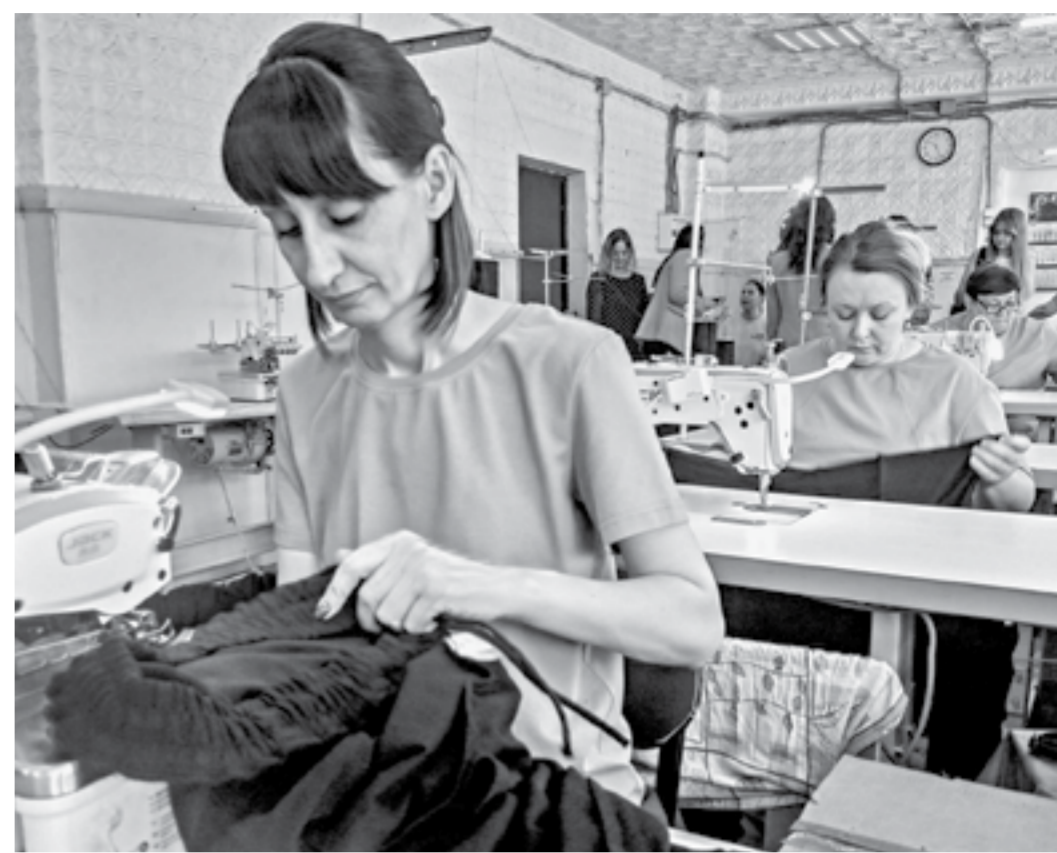
За месяц цех отшивает около 100 адаптивных костюмов.

ных. Производство открыли на базе старой швейной мастерской, – рассказывает Кошелева.