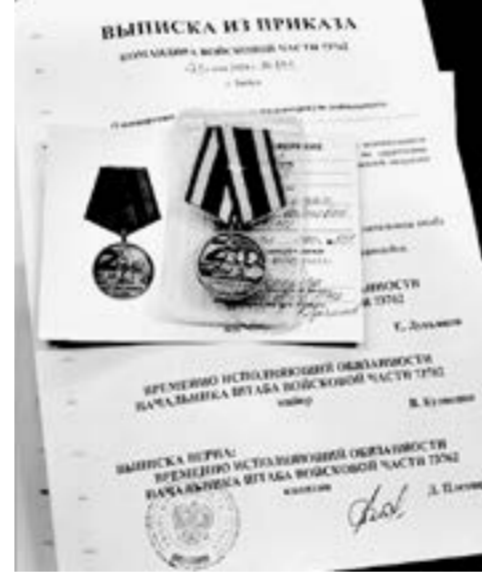
Медаль «Труженик тыла».

В этом году Бийск стал местом проведения регионального этапа всероссийской игры «Победа». За восемь лет наукоград второй раз принимал участия. По всей видимости, бийчанам очень хотелось отличиться на родной земле, поэтому их подготовка была просто на высоте. Благодаря этому бийский юнармейский отряд «Атаман» имени Алексея Соколова стал лидером в этой игре, где пришлось показать все свои знания, умения и навыки в самых различных дисциплинах. Ребята составили в начальной военной подготовке, знании истории, проходили «дорогу памяти» и делали марш-бросок. Везде показывали прекрасные результаты и стали победителями.