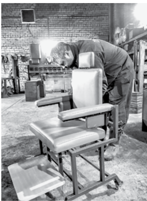
В разработке мебель для людей с ОВЗ.

– Создали кооператив, вложили в него свои средства. Как и было рассчитано в проекте, начали разрабатывать и производить адаптивную одежду для людей с ограниченными возможностями, для лежачих боль-