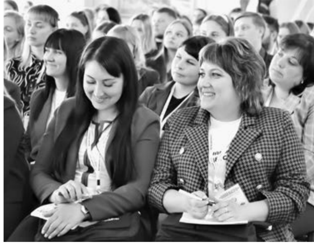
Участники встречи задавали вопросы на разные темы.

Для большинства участие в форуме стало новым опытом, но были и те, кто принял участие в «Новой высоте» во второй раз – 37 человек, а еще несколько участников ни разу не пропустили форум и приехали на «Новую высоту» в третий раз.