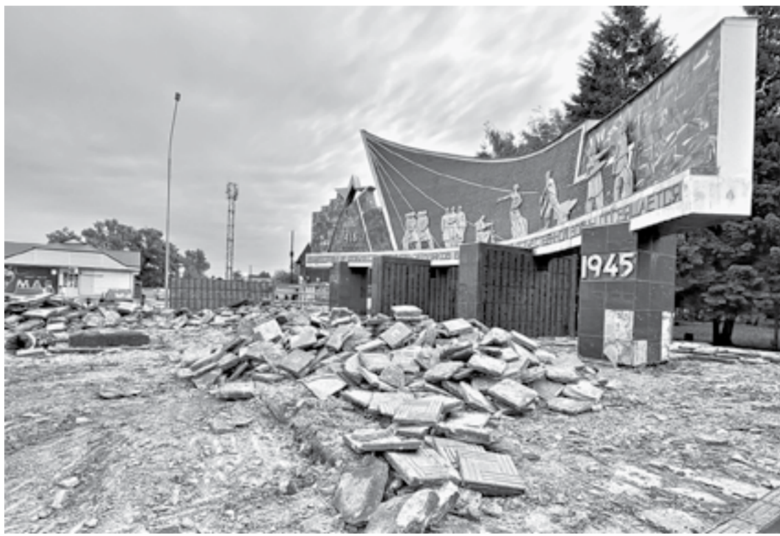
На привокзальной площади демонтирована старая плитка.