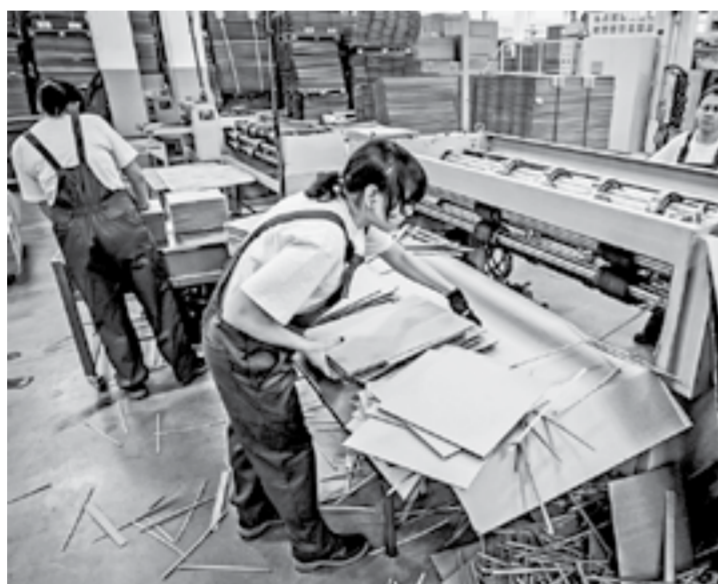
Тару делают пока без новаций.

РОП призвана стать частью так называемой системы разумного потребления, направленной на снижение экологического вреда от пластикового мусора и аналогичных отходов. Она делает экономически невыгодным для изготовителя