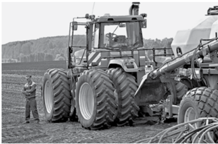
Мощная техника против капризов погоды.

– В этом году условия для посевной хорошие, поскольку земля напиталась влагой из-за промерзания почвы. И у нас из-за этого хорошая всхожесть озимых культур. В степной зоне часть озимых погибла из-за заморозков. А нам повезло, поскольку мы в низине. И нас не подкосили холода, как это случилось в центральной России, – отметил он.