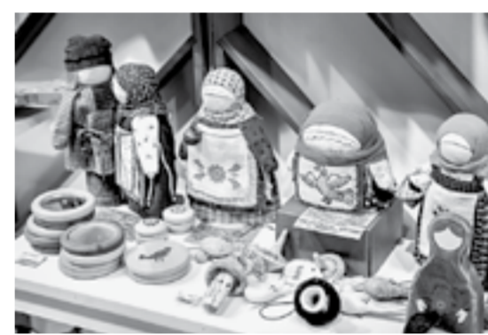
Дизайнерские подделки хорошо раскупаются туристами.

форума, это сообщество нуждается в объединении. Поэтому на площадке одной из главных тем для обсуждения стала важность создания в Барнауле творческого кластера.