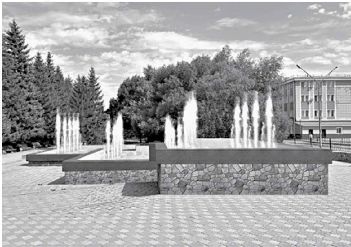
Так будет выглядеть обновленный фонтан.

К середине сентября территория около ДК должна преобразиться до неузнаваемости. По словам Ольги Автушко, здесь появятся фонтаны, две детские площадки, скейт-площадка, уличные тренажеры под навесом, зона отдыха с скамьями и небольшой сценой.