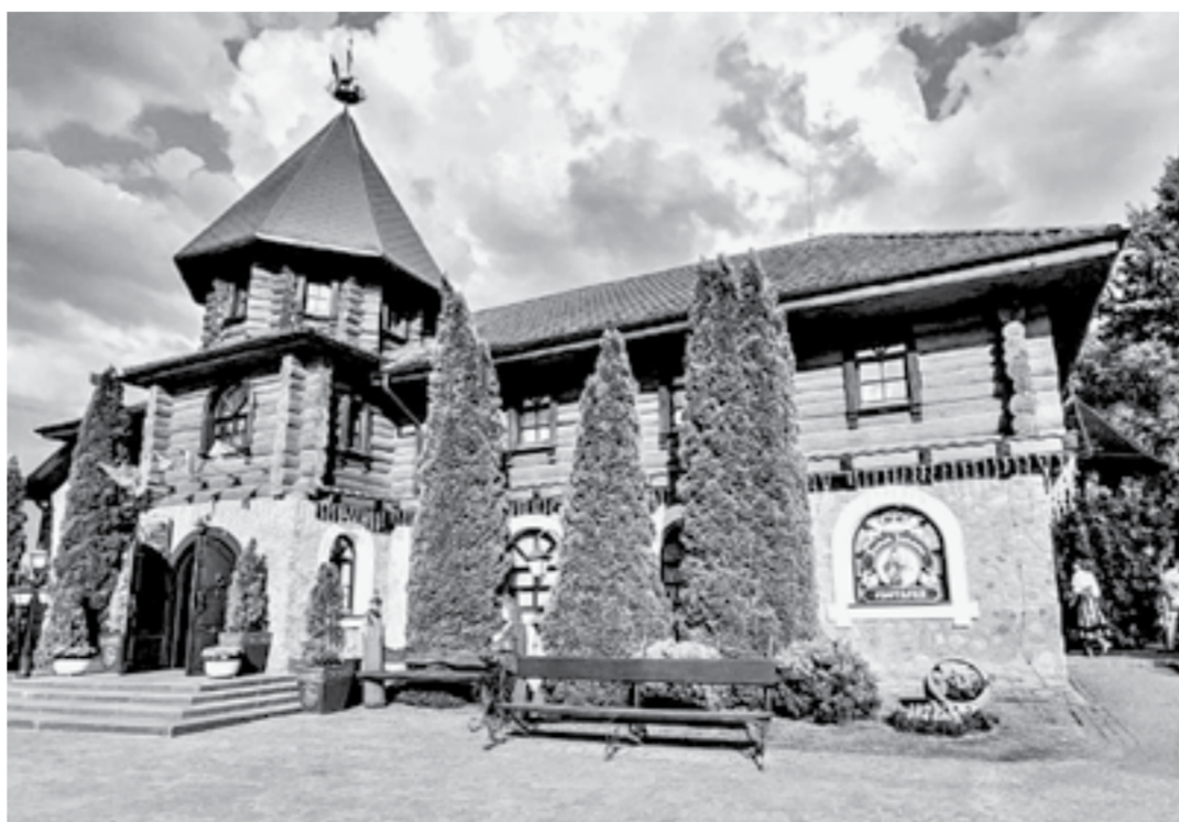
Белорусским санаториям удалось привести в современный вид советское наследие.

Стороны продолжают обмен опытом. Представители Алтайского края и Беларуси примут