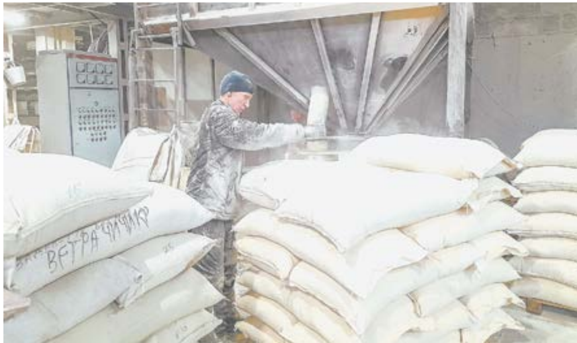
Продукция «Алтай ЭКО сорта» востребована на внешнем рынке.

Предприятия из Первомайского района перерабатывают сельхозпродукцию и поставляют ее как по России, так и за границу. География поставок включает Иран, Казахстан, Киргизию, Болгарию, Польшу и Чехию.