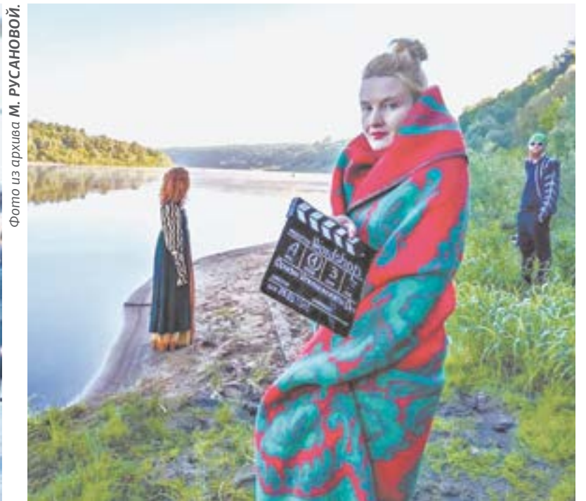
На съемках документального фильма.