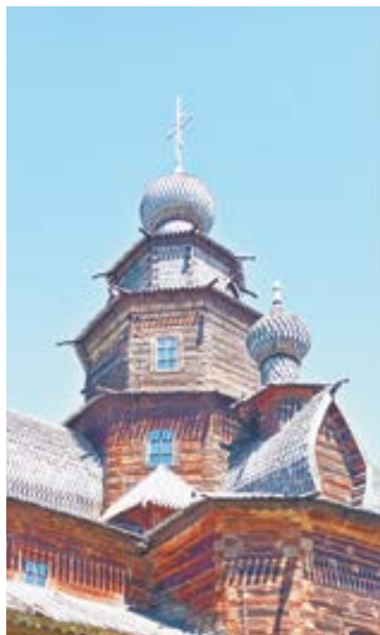
Суздальский музей зодчества.