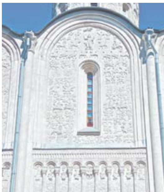
Каменная роспись Владимирских храмов.

Во Владимире можно увидеть не только культовые сооружения: например, памятник родившемуся здесь Левитану, владимирской вишне, а также домик Бальзамина.