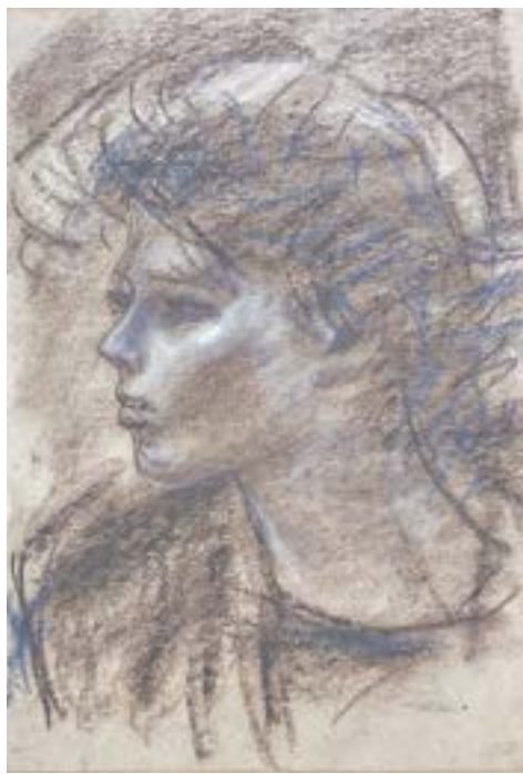
Искусствовед Усольцева (нач. 1990-х).