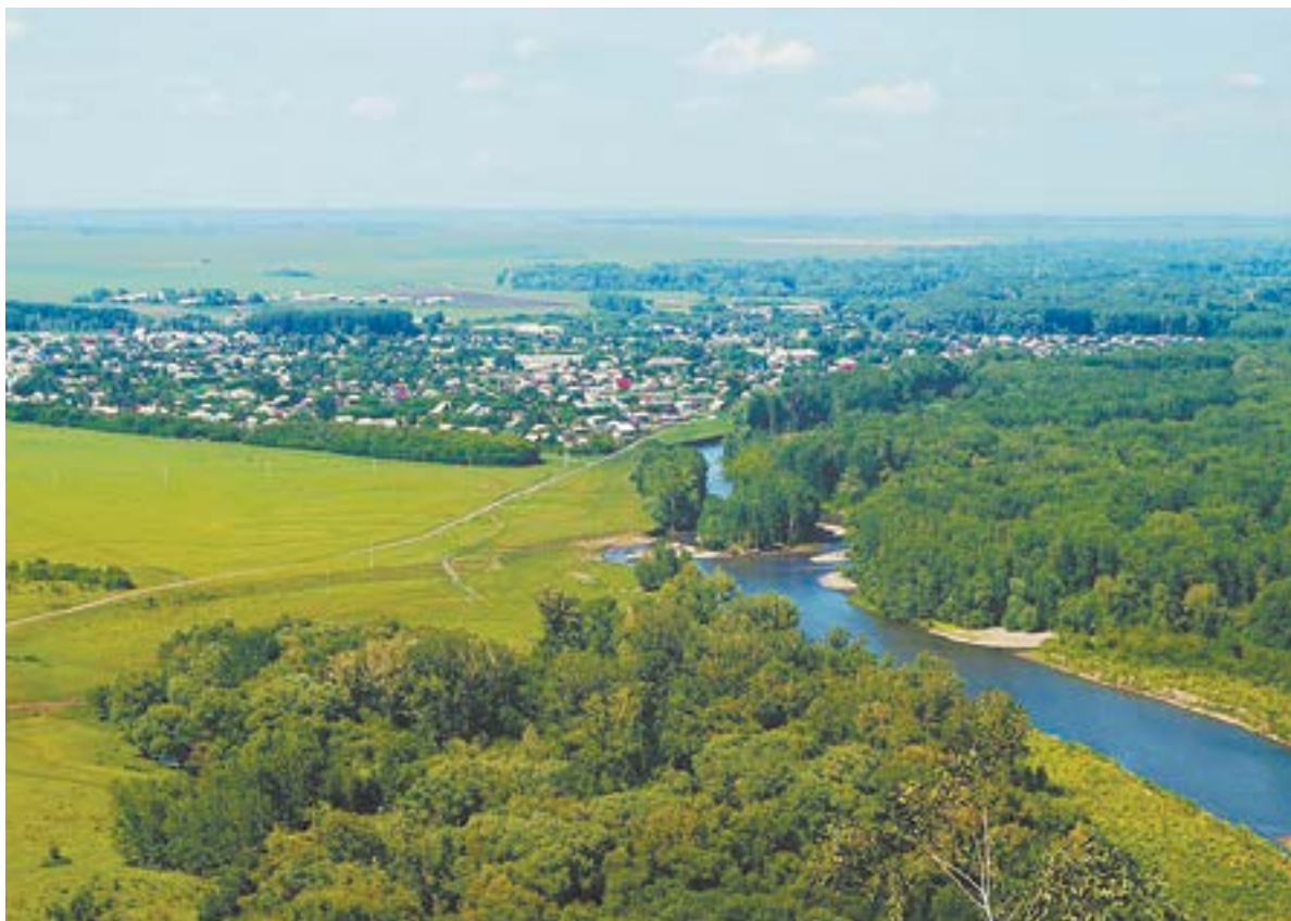
Пейзажи Петропавловского завораживают и вдохновляют.