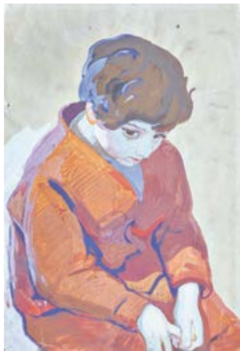
Чеченская девочка (нач. 1960-х).