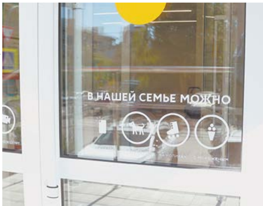
Когда собакам вход разрешен.