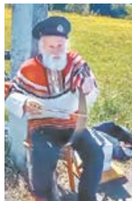
Смычком – по пиле.