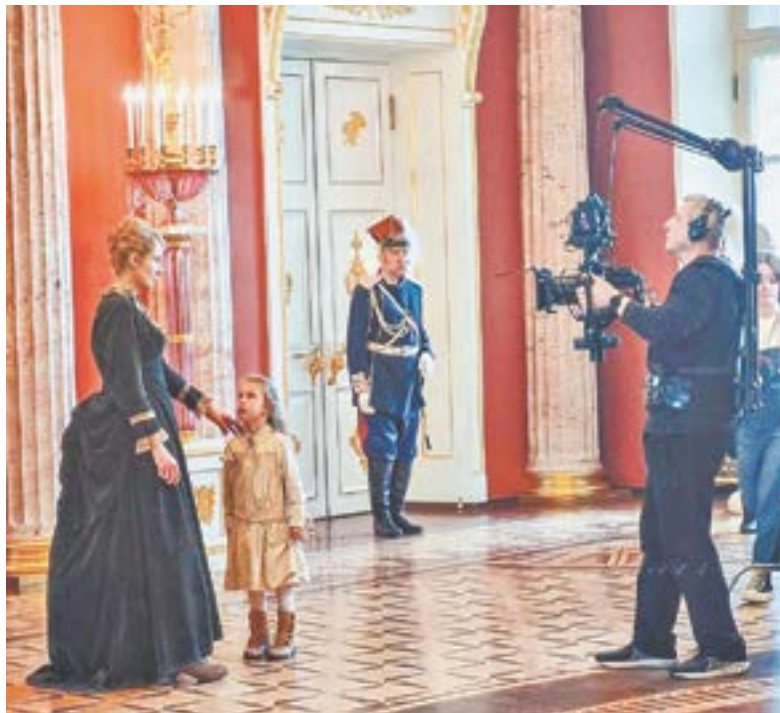
В сериале «Плевако».

– Мне очень понравился край. Здесь больше энергии, и я лучше себя чувствую. Всегда хотела жить в подобном месте. Я очень люблю Москву и буду туда периодически возвращаться из-за работы. Как и