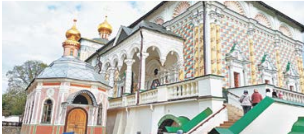
На территории Троице-Сергиевой лавры.

Владимир поразила средоточие домонгольских памятников, обилием храмов XII–XIII веков. Среди них особое место занимает, конечно, Успенский собор (именно по его подобию строился московский Успенский, более известный широкому кругу). Высота сооружения больше 32 метров! Храм построен в XII веке, а в XIV его расписал сам Андрей Рублёв – фрескам несколько столетий, но они прекрасно сохранены.