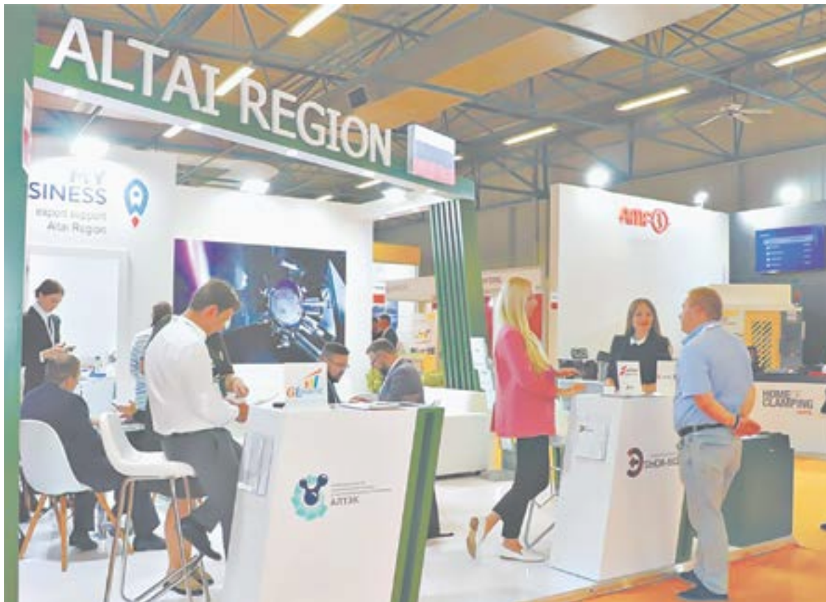
Беларусь заинтересована сотрудничать с Алтайским краем.

«Мы хотим перенести внутренний опыт по постановке машины на колеса в течение суток на все регионы России. Для этого внедряем сервисные летучки, когда в течение полусуток в любую точку должна приехать бригада