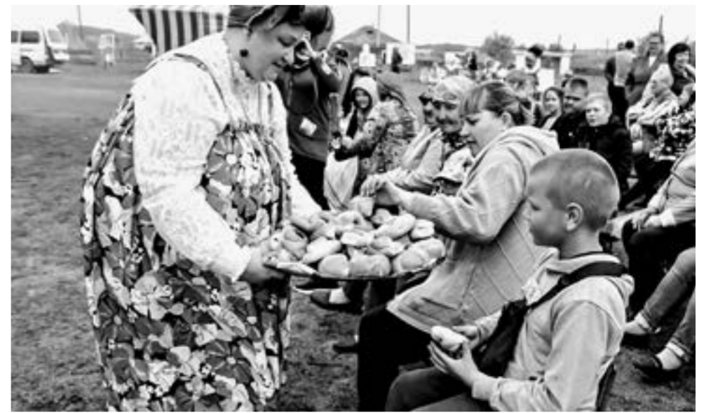
Угощение для гостей приготовила столовая СПК «Жданова».