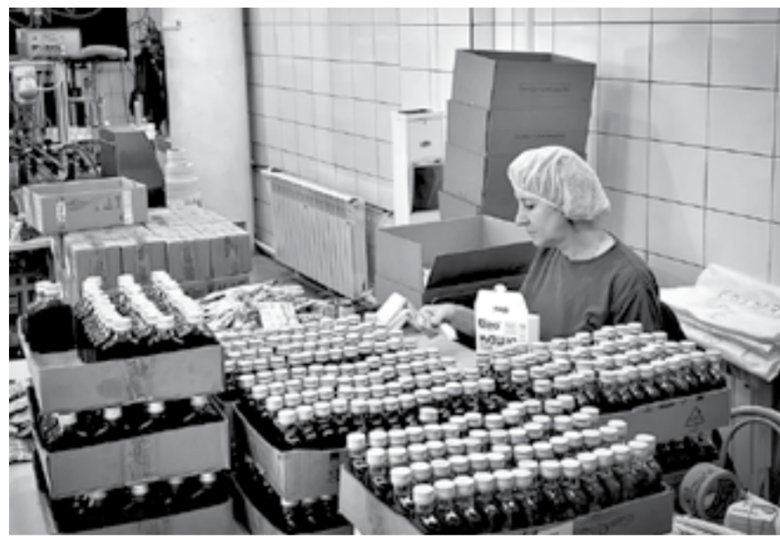
Линейная продукция компании довольно широкая.