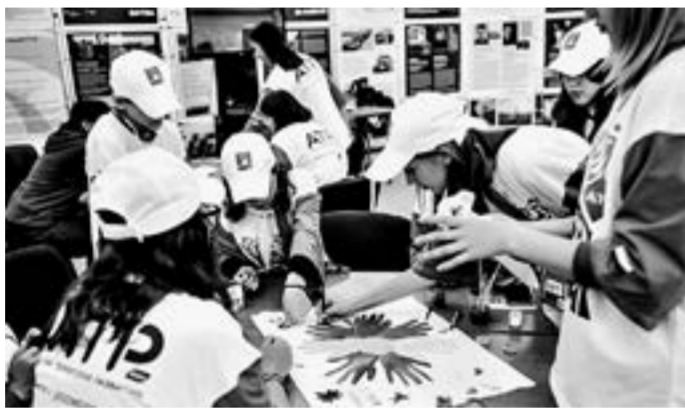
В творческой мастерской.

На церемонии торжественного закрытия подвели итоги конкурса проектов Росмолодежь. Гранты. В дни форума участники со всей России защищали свои проекты перед компетентным жюри, и теперь лучшие из лучших получили