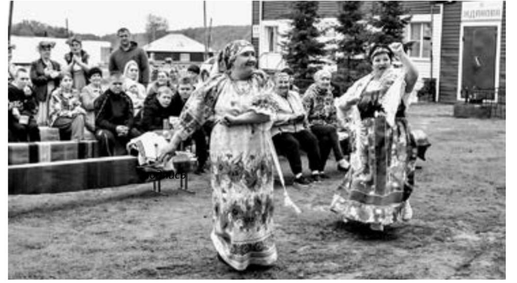
Какой праздник без пляса?