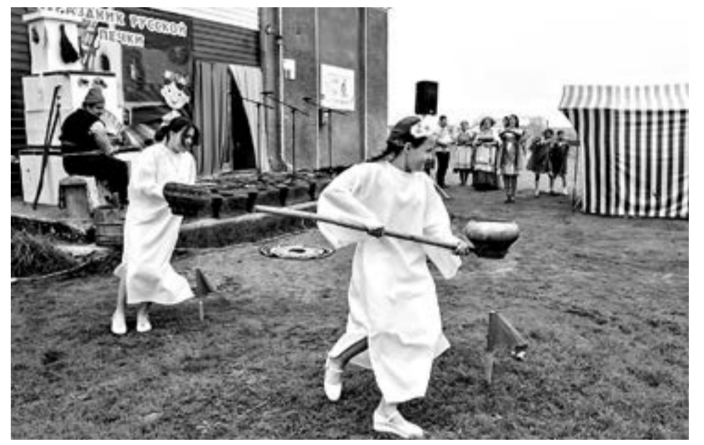
Соревнования на сорновку с ухватом и чугунок.

«Культурный поход» всколыхнул район: увеличилось количество зрителей, возрос интерес к району как к территории с богатой историей, народными традициями и гастрономическими особенностями.