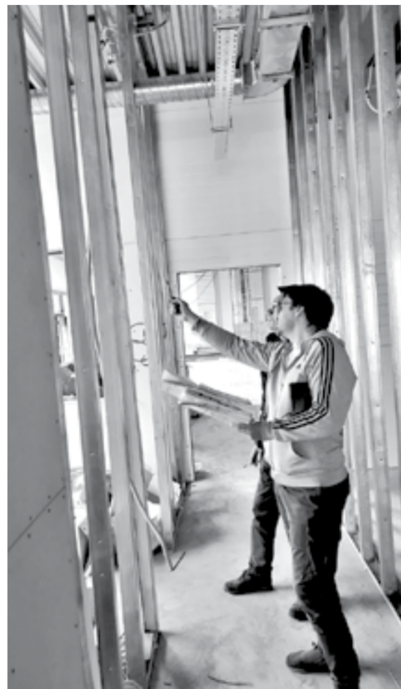
Идет отделка офисных помещений.

части. На первом ее этаже будут располагаться раздевалки, душевые для рабочих. На втором предусмотрено шесть больших светлых кабинетов с панорамными окнами.