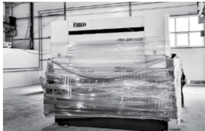
Первый станок еще в упаковке.