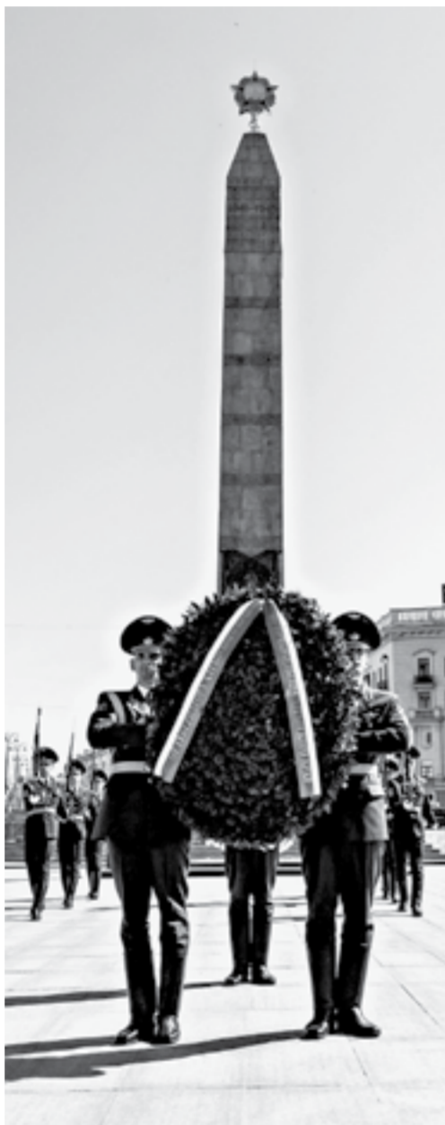
Возложение цветов к Мемориалу Победы.

Белорусское предприятие «Амкордор» в кратчайшие сроки готово поставить в регион всю линейку необходимых спецмашин. Особый интерес представляет пожарная и аварийно-спасательная техника. Ее особенностью являются современные композитные материалы, которые обеспечивают высокую надежность и увеличенный срок эксплуатации до 20 лет.