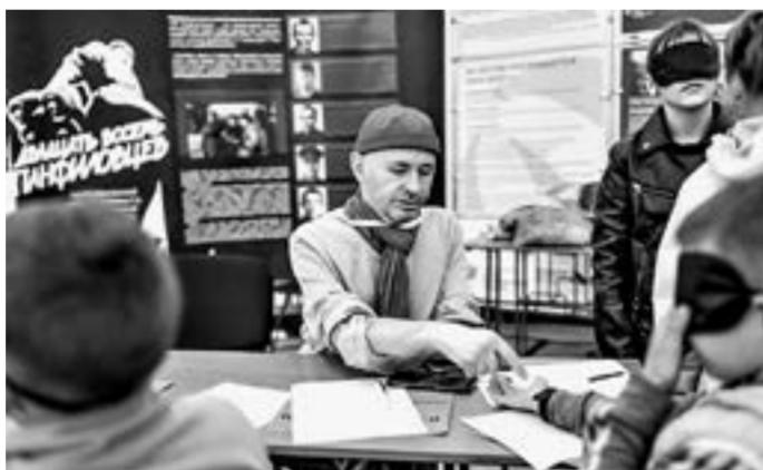
Вест-погружение «Стирая границы».

650 УЧАСТНИКОВ НА ДЕСЯТИ ПЛОЩАДКАХ СОБРАЛ 16-й ФОРУМ АТР