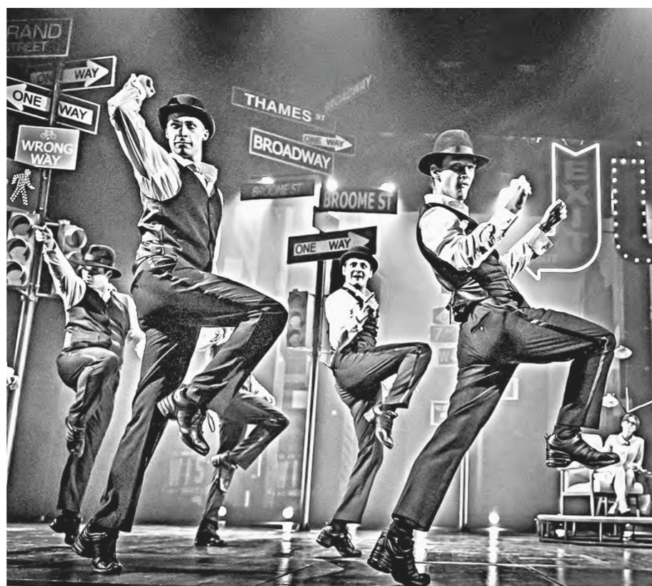
Украшение спектакля – танцевальные номера в бродвейском духе.