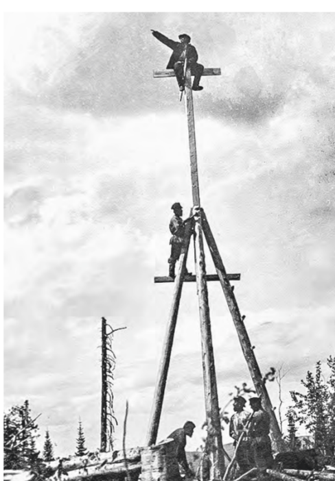
Возведение геодезической вышки.