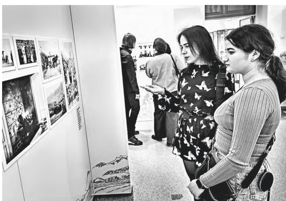
В экспозицию вошло 80 старинных снимков.

Полубоваться Барнаулом, Алтаем и Сибирью более чем столетней давности можно в Алтайском краеведческом музее.