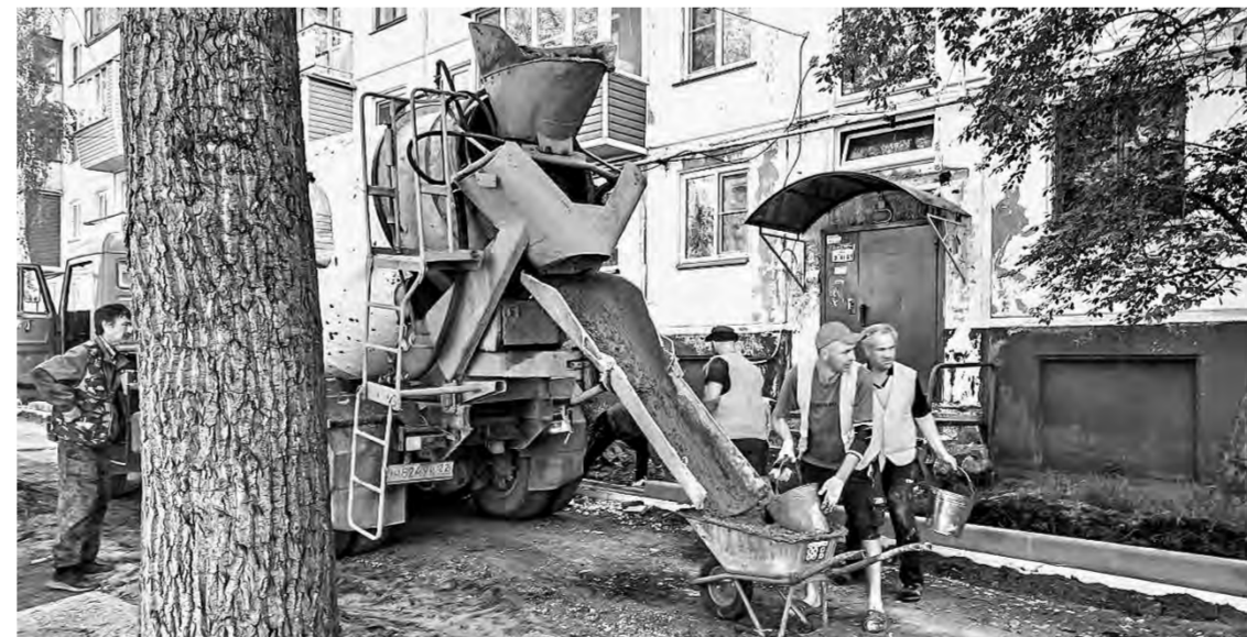
В очереди за бетоном.

Работы на данном объекте выполняет компания «БийскДорСтрой». Отметим, что в этом году в