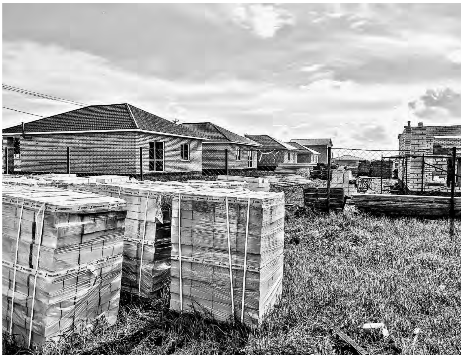
Сотрудники Росреестра обнаружили в крае 250 участков, где по 10–15 лет ничего не строят.

За четыре месяца площадь свободных земель в Алтайском крае, которые можно вовлечь в оборот для жилищного строительства, пополнилась на 122 гектара и на сегодня составила 3,2 тыс. га. На публичной кадастровой карте (ПКК) размещены участки общей площадью