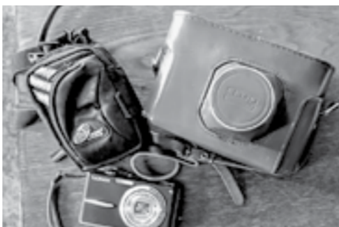
Как быстро стареет техника...