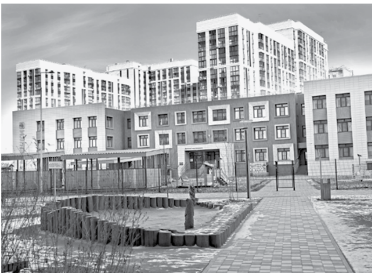
Будет ли так же красиво в новых микрорайонах Барнаула?

Если по строительству коммунальных сетей удалось сделать задел путем включения этих затрат в стоимость жилья, то на возведение детских, больниц и школ требуются очень большие затраты, и их появление от-