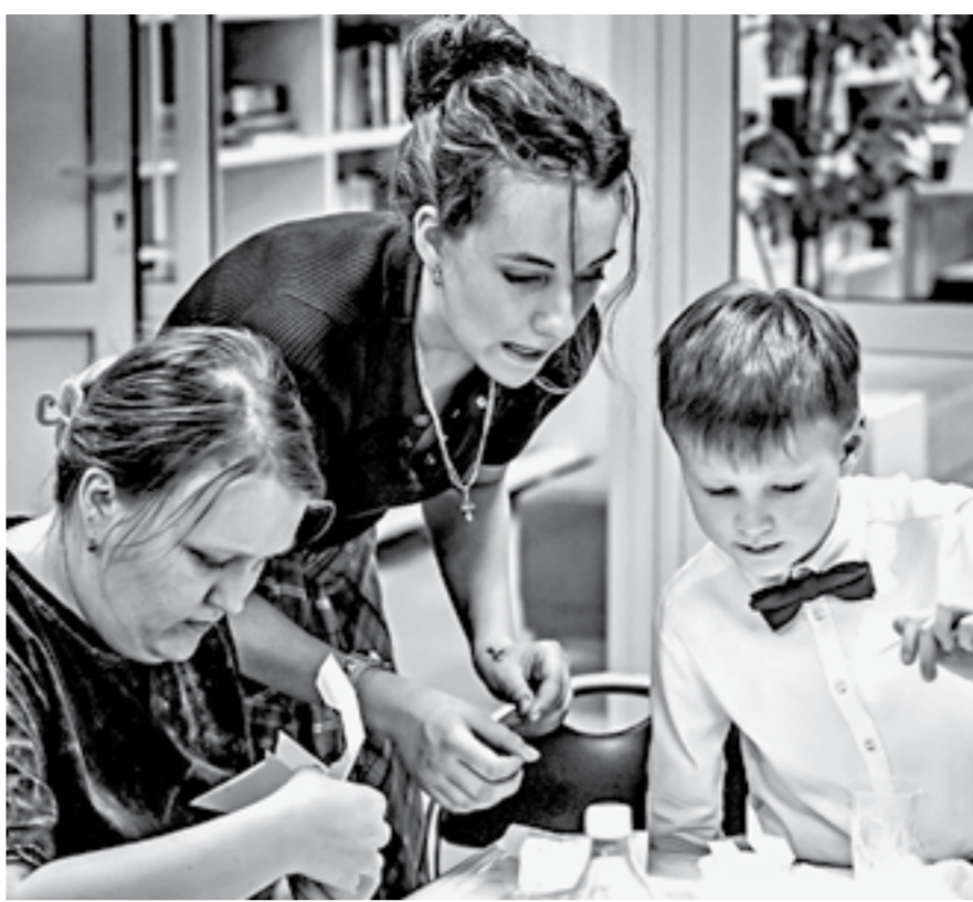
«Библионочь» в Шишковке славится мастер-классами.