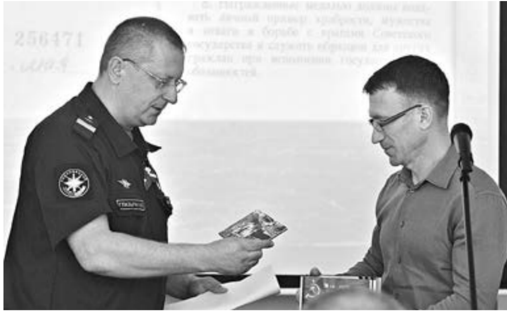
Это не первая история, когда утраченную награду вручают родным.