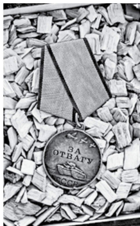
Награда была потеряна в непростые 90-ые.