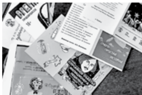
Афиши Бийского драмтеатра разных лет.