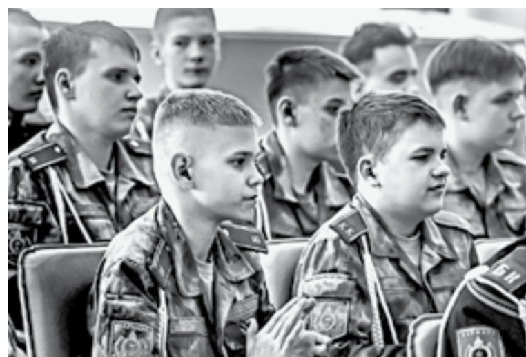
Церемония собрала в зале всех неравнодушных к этой истории.