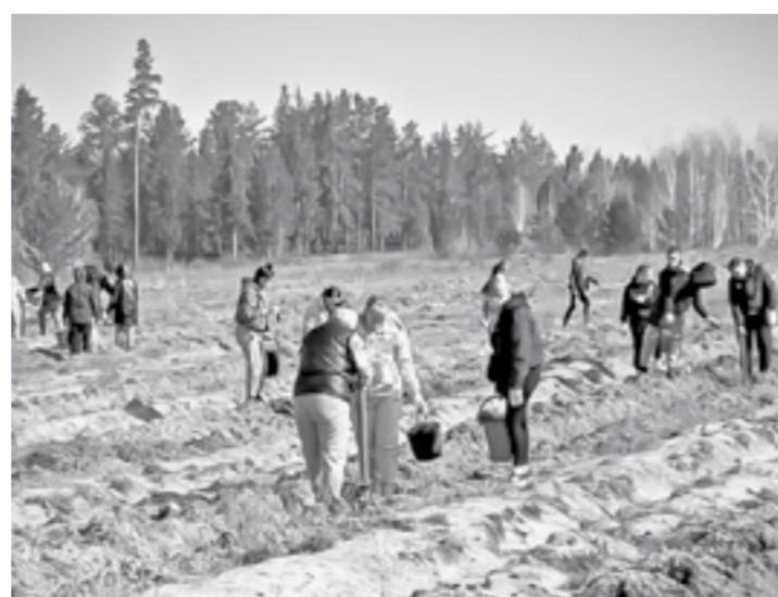
В крае «Сад памяти» прирастет на 280 га.

В этом году первыми акцию поддержали в Ключевском лесничестве, где 19 апреля с саженцами в лес отправились более ста подростков и взрослых. Перед поездкой воспитанники Северной средней школы прошли инструктаж и научились пользоваться специальным посадочным инструментом – мечом Колесова. Шефство над юными экологами взял Боровлянский лесхоз. Общими усилиями засадили 35,2 га – это более 140 тысяч молодых сосенок из местного питомника.