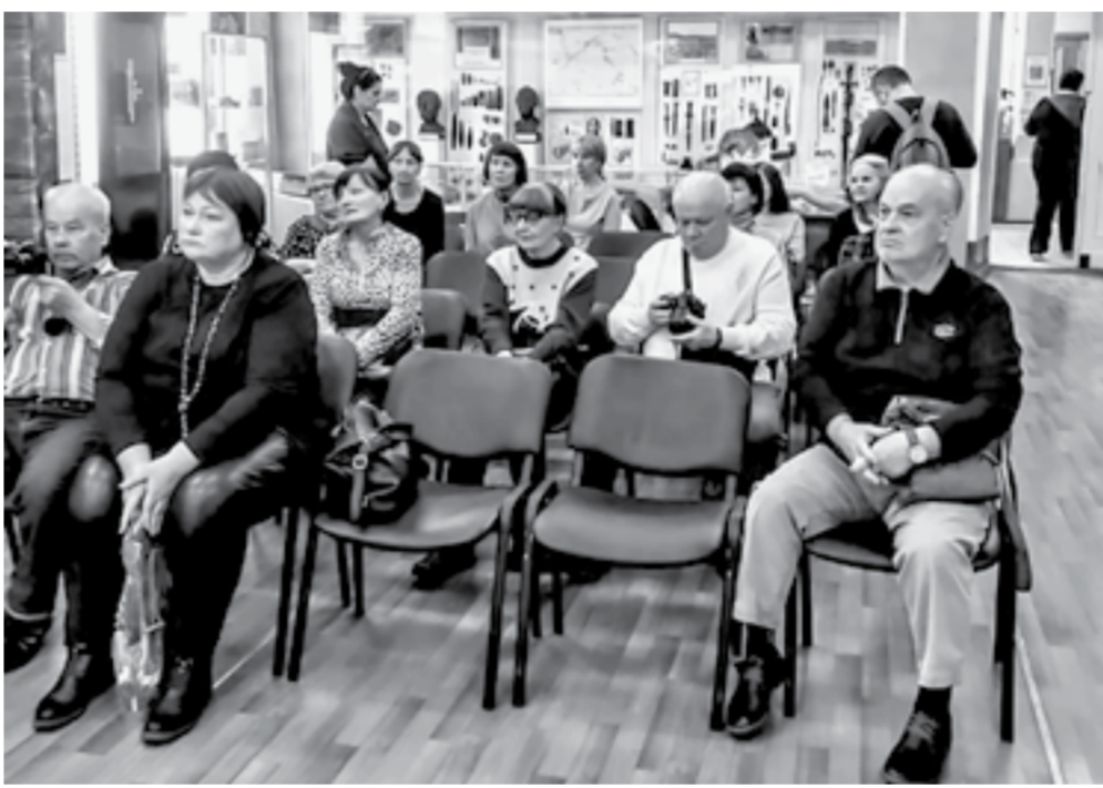
Дарителей не так уж много, но все они — близкие друзья музея.

Каждый год музейщики создают презентации подарков — их историю, как они попали в музей, ведь дарители приносят действительно интересные экспонаты.