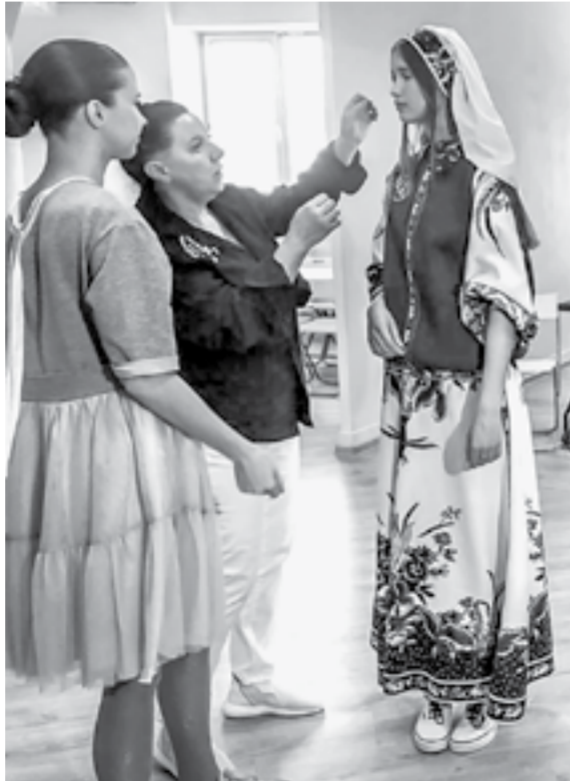
Подготовка моделей к показу.

– Сначала мы решили шить носочки из фатина. Вместе с мамой подобрали цвета, дизайн, кружева. В итоге получалось неплохо... даже здорово. Часть