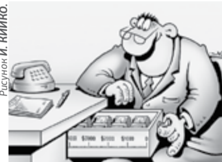
Рисунки И. НИКИНО.

предварительномуговору, сообщили «АП» в пресс-службе УФСБ России по Алтайскому краю. Расследование восьми уголовных дел в отношении задержанных ранее по подобным фактам в нашем регионе продолжается.