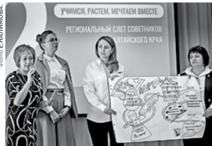
Мероприятия - по единому календарному плану.