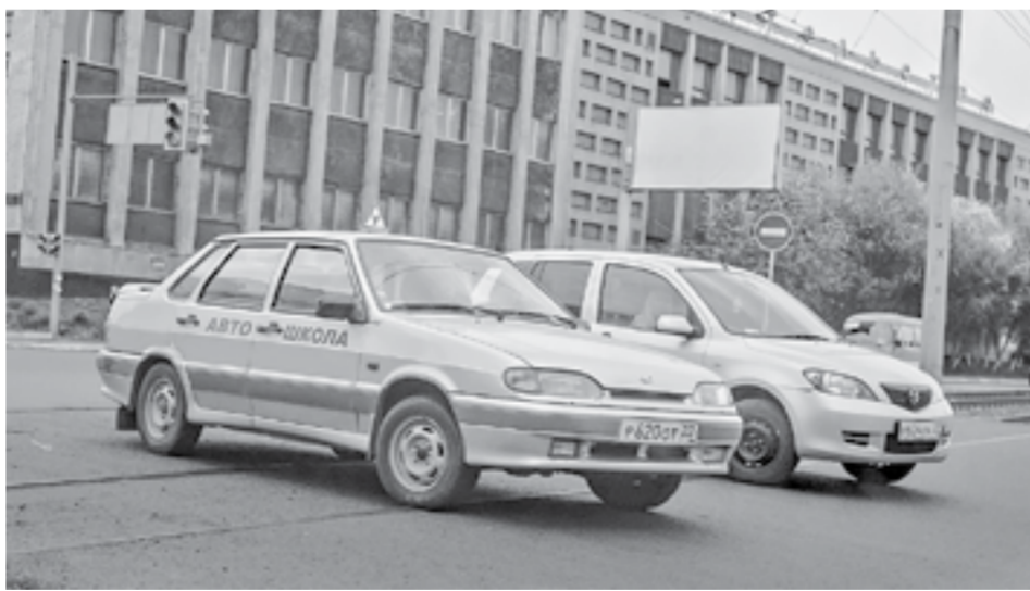
«Серые» автошнылы лишатся учеников.

Кого не будут допускать к сдаче экзамена: того, кто был лишен водительских прав или права занимать должность, связанную с управлением автомобилем; водителей, наказанных за пьяную езду.