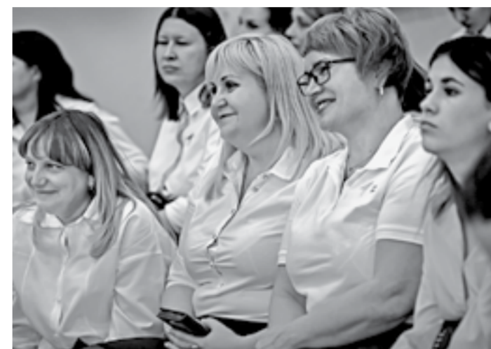
Делиться опытом – важно.