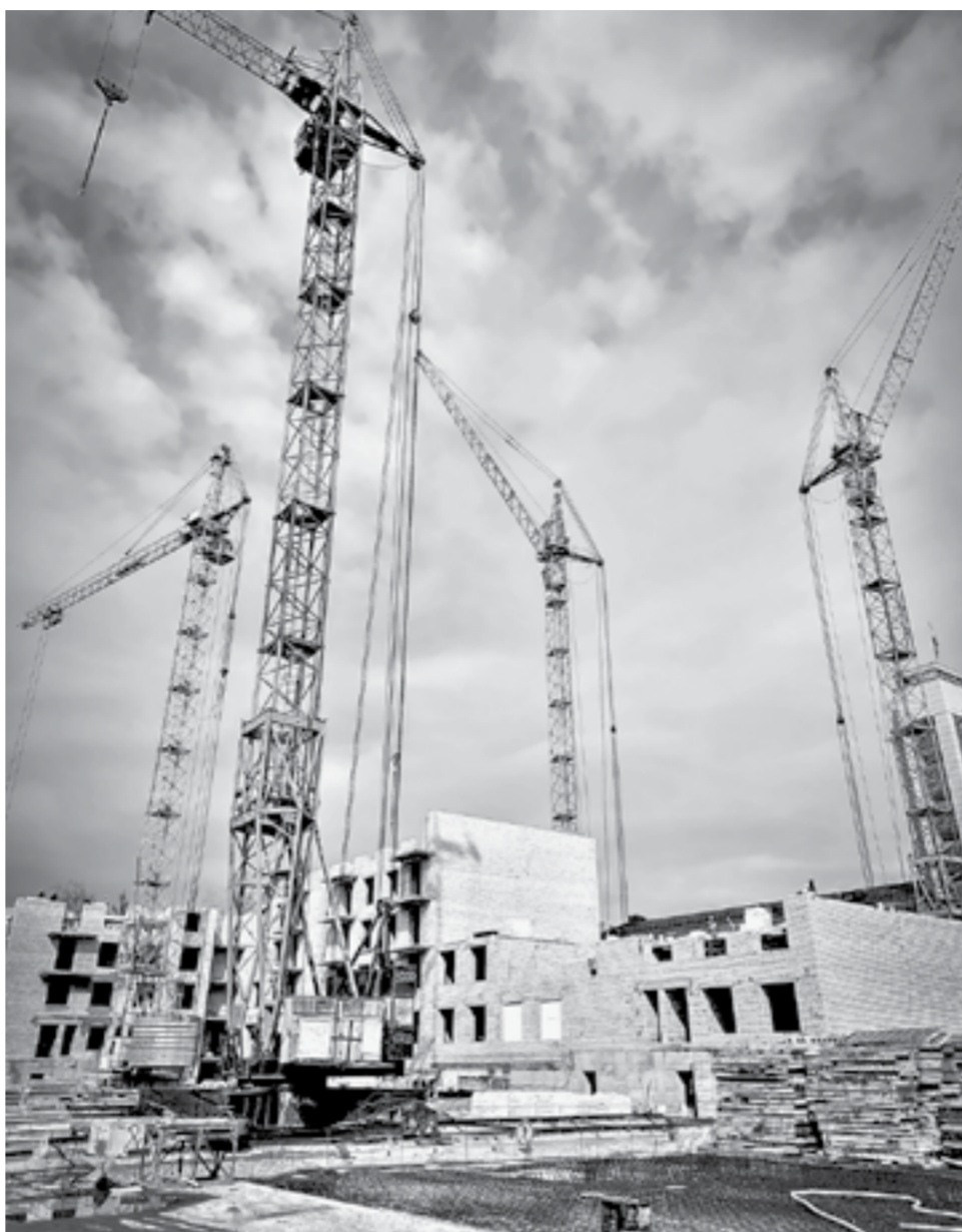
Заклучая договор долевого участия на строящемся жилье, надо избегать сложных ипотечных схем.

– Аккредитив получил широкое распространение в сделках купли-продажи на вторичном рынке. Банк в этом случае выступает гарантом перечисления и сохранности средств. Суть в том, что покупатель не передает деньги напрямую продавцу, а размещает их на специальном счете, доступ к которому продавец получит только в тот момент, когда он предъявит в банк документ о регистрации права собственности на нового владельца. В этом аккредитив чем-то похож на эскроу, где тоже доступ к средствам возможен только в случае выполнения определенных условий. С помощью аккредитива можно проводить сделки, даже если продавец и покупатель находятся в разных городах: покупатель оформляет аккредитив в своем банке, а продавец в итоге