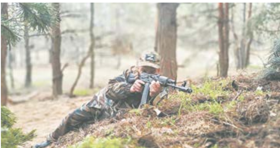
На одном из участков в Херсонской области.