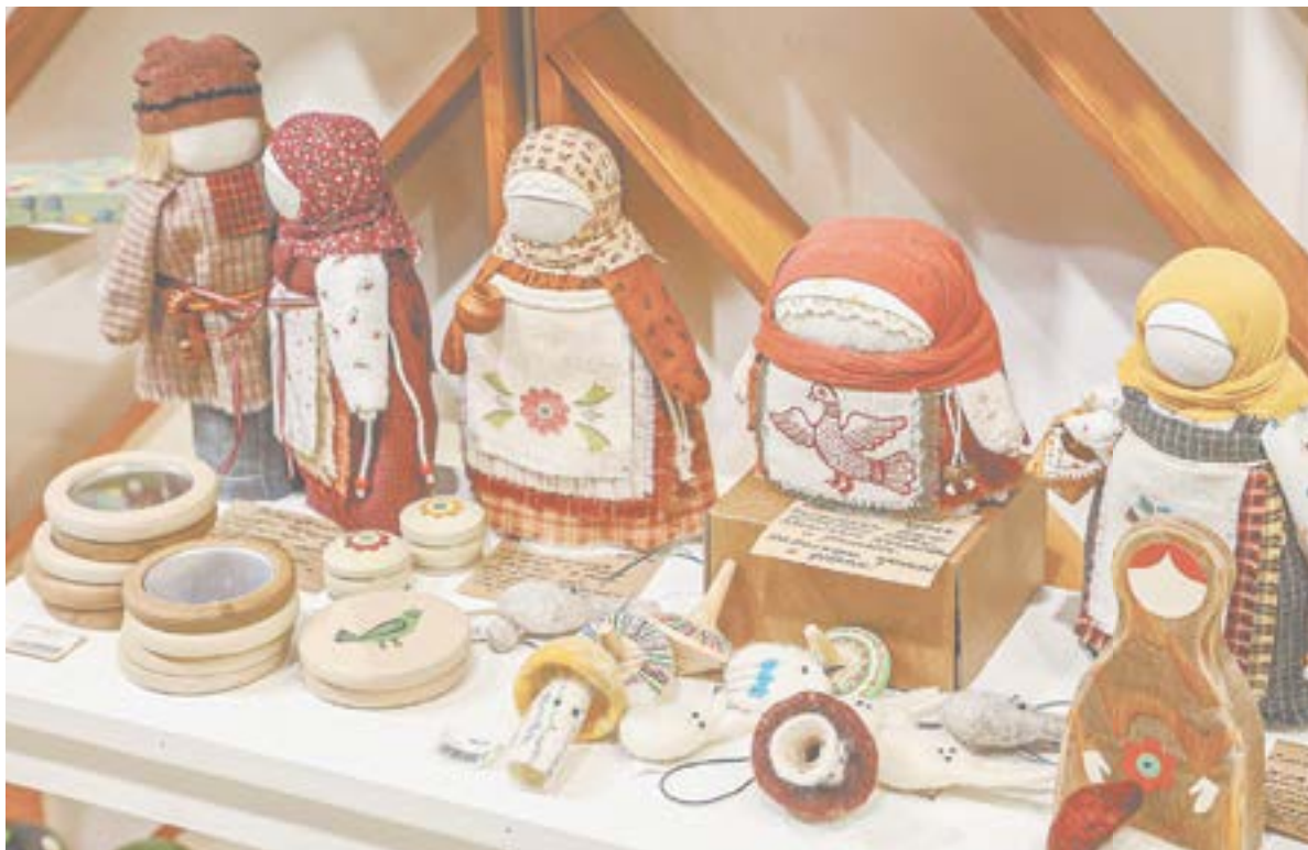
Игрушки в старом стиле.