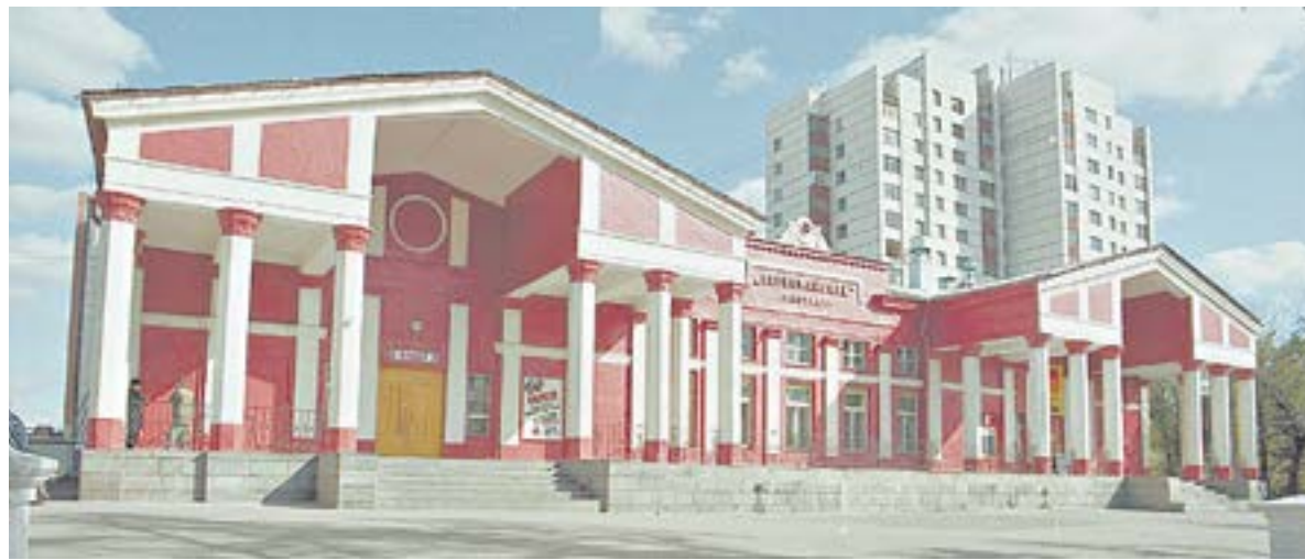
Здание кинотеатра «Первомайский» хотели отреставрировать, но в итоге снесли.

Значимое событие произошло в 1937 году, когда открылся первый звуковой кинотеатр меланжевого комбината со зрительным залом на 750 мест. Его построили к 20-летию Октябрьской революции. Он