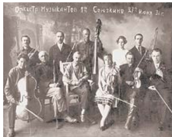
Перед фильмами зрителей развлекали музыканты.