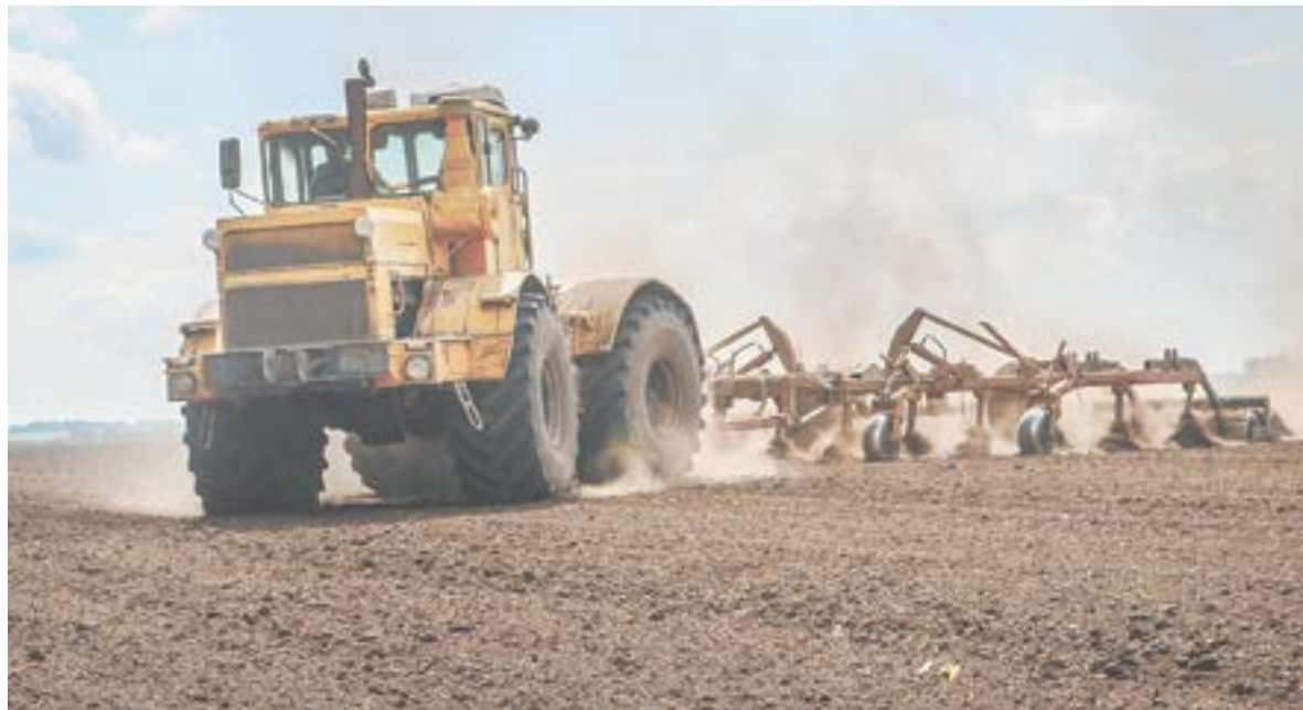
Аграриям предлагают застраховать урожай еще до начала весенних полевых работ.

Франшиза – это та часть риска, которую страховая компания будет вычитать из убытка агрария. И чем больше франшиза, тем дешевле обойдется страховка. Но при наступлении страхового события вы должны быть готовы, что эту часть не будут возмещать. Поэтому не гонитесь за дешевым страхованием. Если будет недобор около 40%, а франшиза – 50%, то выплаты не будет. Перед заключением договора попросите, чтобы страховая компания вам предоставила несколько вариантов с разным уровнем франшизы. И тогда можно сравнить затраты с уровнем риска и выплатами.