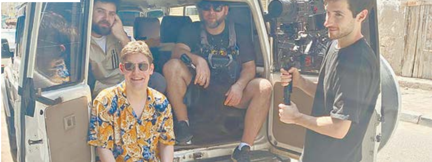
Съемочная группа фильма «Атаман Африка».