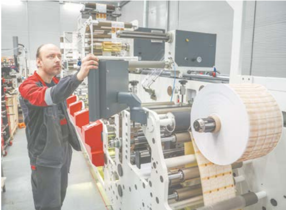
Станок может выпускать до трех миллионов этикеток за смену.

– Мы работаем в сегменте B2B – бизнес для бизнеса, – констатирует