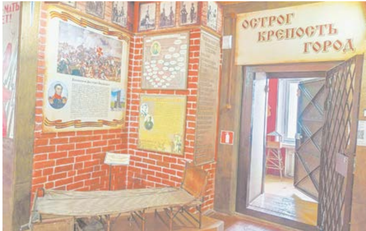
В экспозиции «Бийская крепость».

За подвиги, совершенные в годы Отечественной войны 1812 года, многие офицеры и нижние чины полка награждены российскими и иностранными ор-