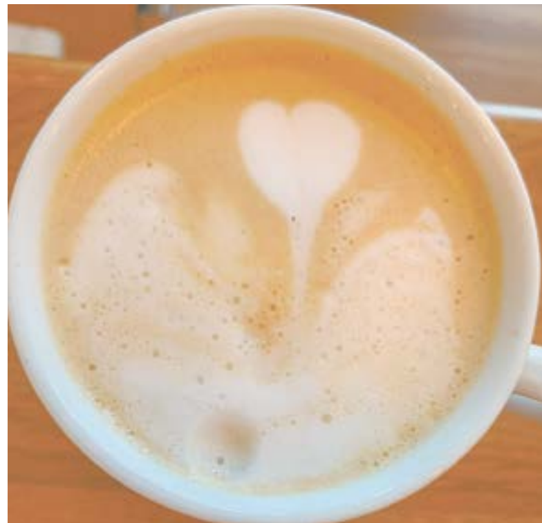
Чашка ароматного капучино.

Стучать кружкой по столу нужно еще и для того, чтобы убрать пузырьки. Но это не всегда спасает. Если молоко передержать под паром или недодержать, то оно будет испорчено. Но участники курса крайне аккуратны, и только одна порция молока идет в утиль.