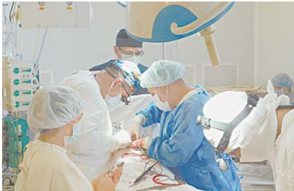
В регионе проводится все больше сложных высокотехнологичных операций.