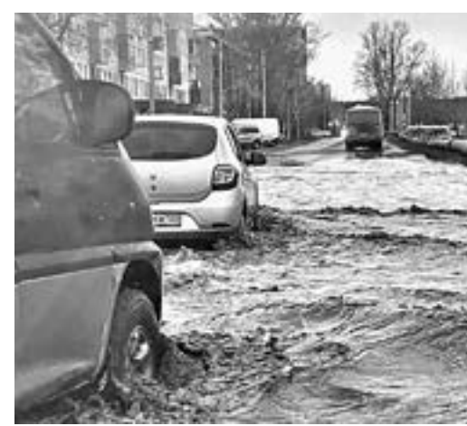
Так выглядела улица Социалистическая.

Стоит отметить, что весна перед возможным основным паводком уже проверяет на