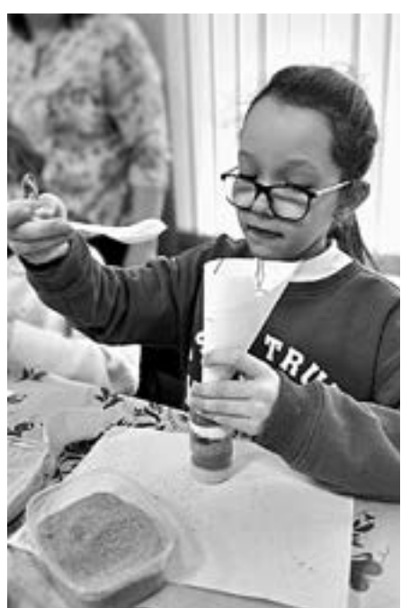
Оберег для дома из разноцветной соли.

В районном историко-краеведческом музее собрана экспозиция и проводят мероприятия, которые посвящены соли: ее истории, промысле, пользе и вреде. И не зря: когда-то в районе действовал Всесоюзный курорт «Лебяжье», который располагался на берегу соленого озера Горькое.