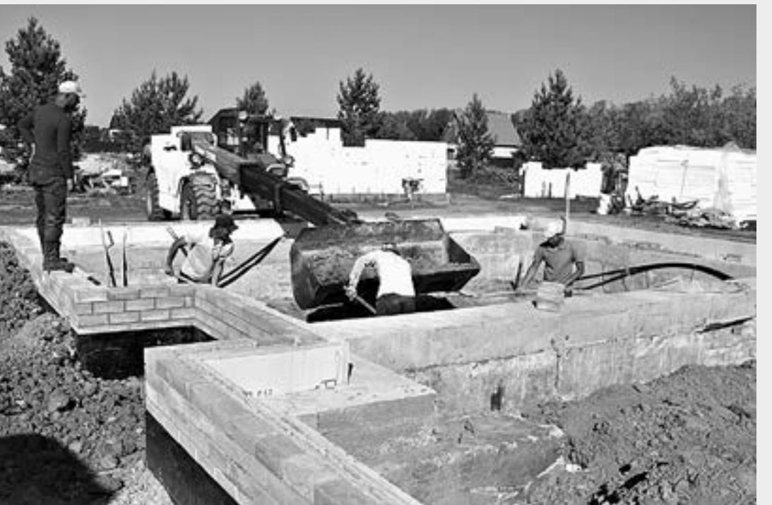
Теперь получить разрешение на использование земельного участка можно дистанционно.

По словам начальника управления имущественных