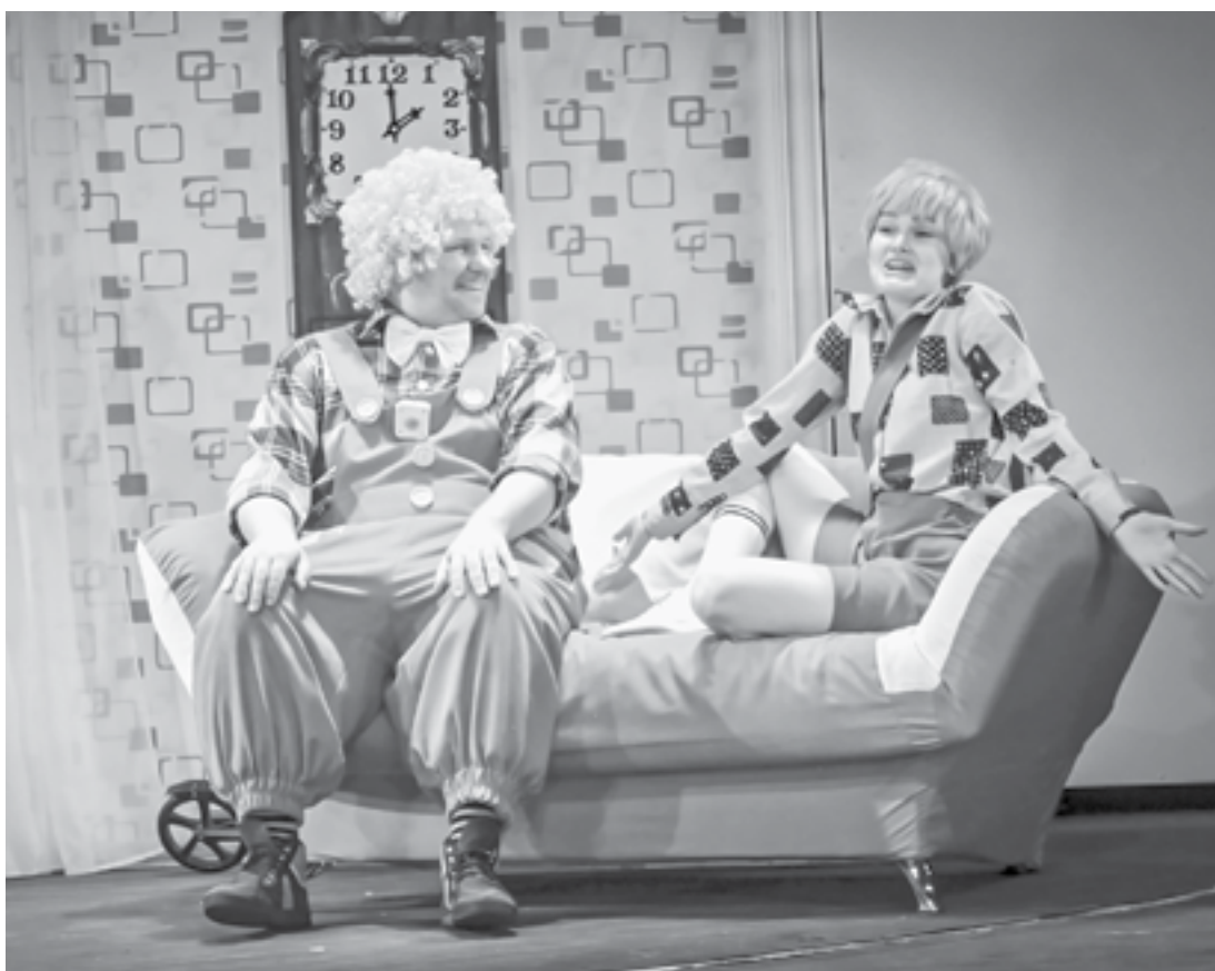
Лучшие друзья Мальш и Карлсон.