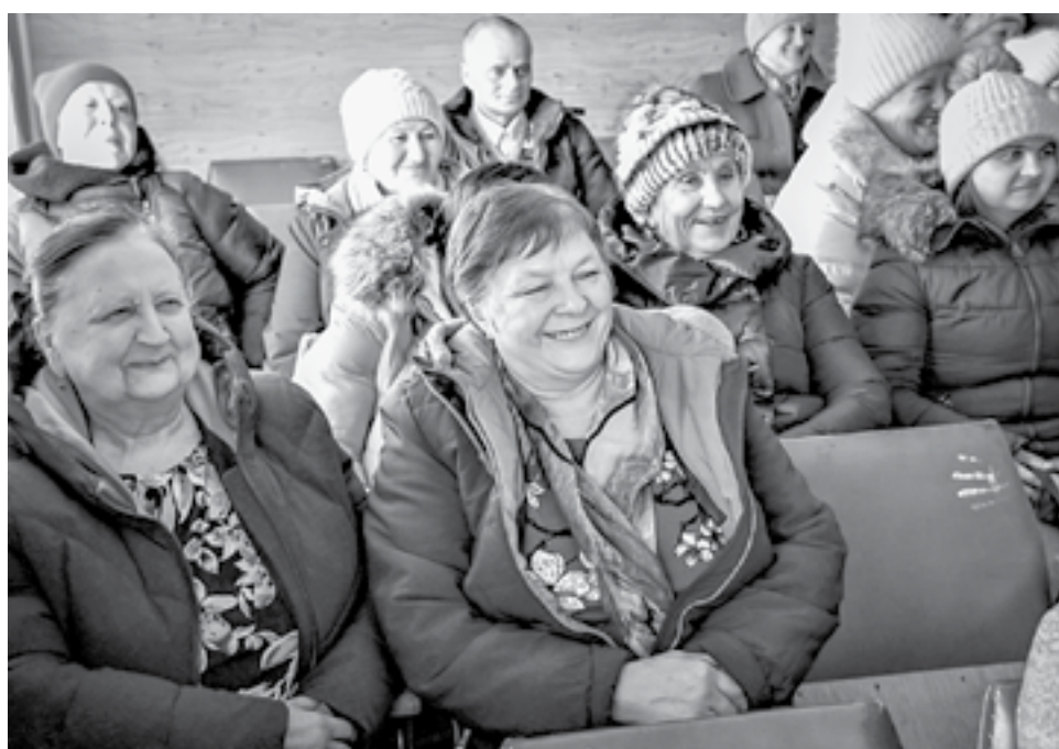
Зрителям понравилась постановка толстовского «Сказа».