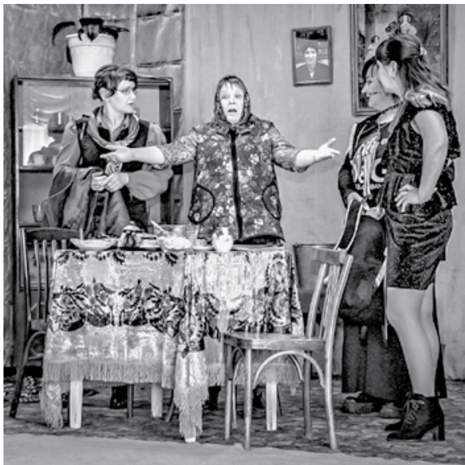
На сцене толстовские антрисы.