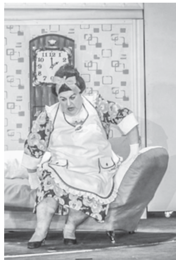
Зловредная Френкен Бок.