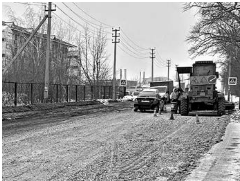
До начала масштабного ремонта улицы Арычную отсыпали щебнем.

При благоприятных погодных условиях ремонт дорог в городе начнет-