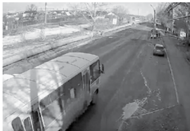
Было – стало. Сегодня движение по улице Социалистической проходит без помех.

Резкое потепление – плюсовые температуры наблюдались и ночью – внесло в размеренную жизнь наукограда в весенне неожиданный. В Бийске 20 марта автоперевозчик маршрута № 77 отказался выходить на линию по ул. Социалистической. Талая вода потоком шла по автомобильной дороге, осложняя движение и даже делая его невозможным.