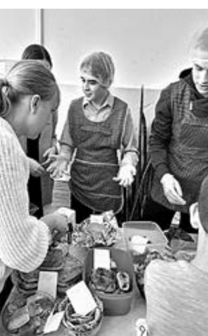
Сладкая благотворительная ярмарка.

Закрепили пройденный материал на практике, создав оберег для дома из разноцветной соли.