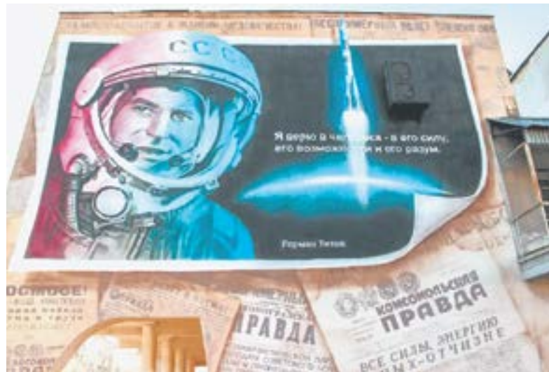
Герман Титов: стремление вверх.