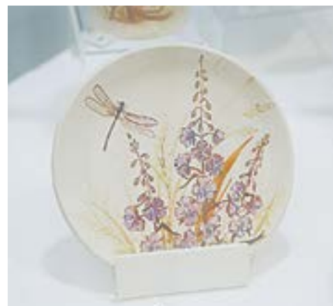
Блюдец туриногорской керамики.