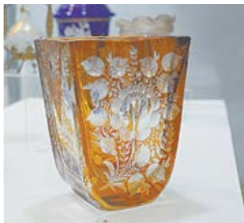
Хрустальная ваза, СССР, 1950-е.