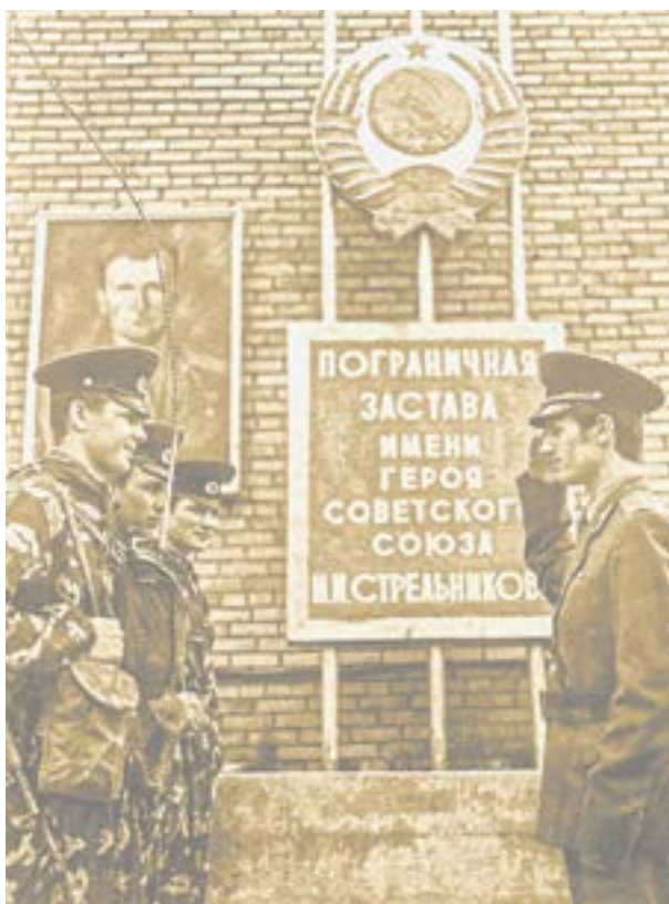
Застава Нижне-Михайловская получила новое название.

Просьбу тридцатилетнего офицера удовлетворили. И чета Зы-