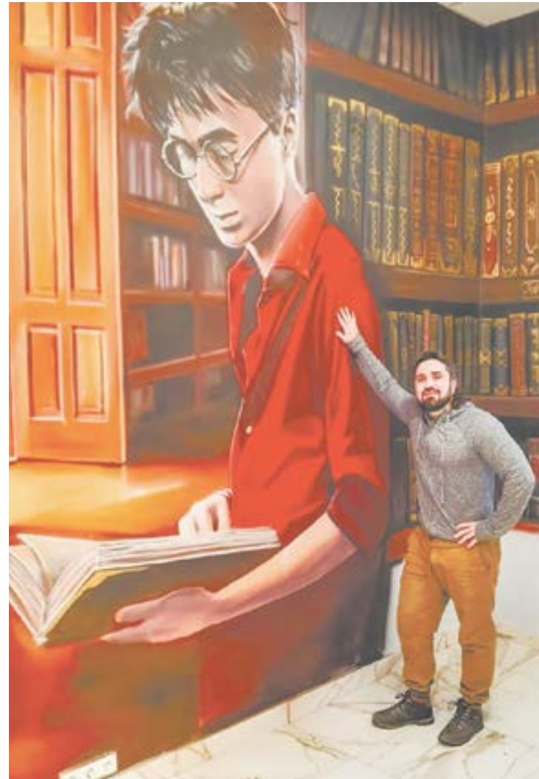
Комната книг в краевой детской библиотеке.

Для этого досконально изучается изображение и каждый кусочек детально прорабатывается: каждая пора на коже, каждая точка. Так получается точная ко-