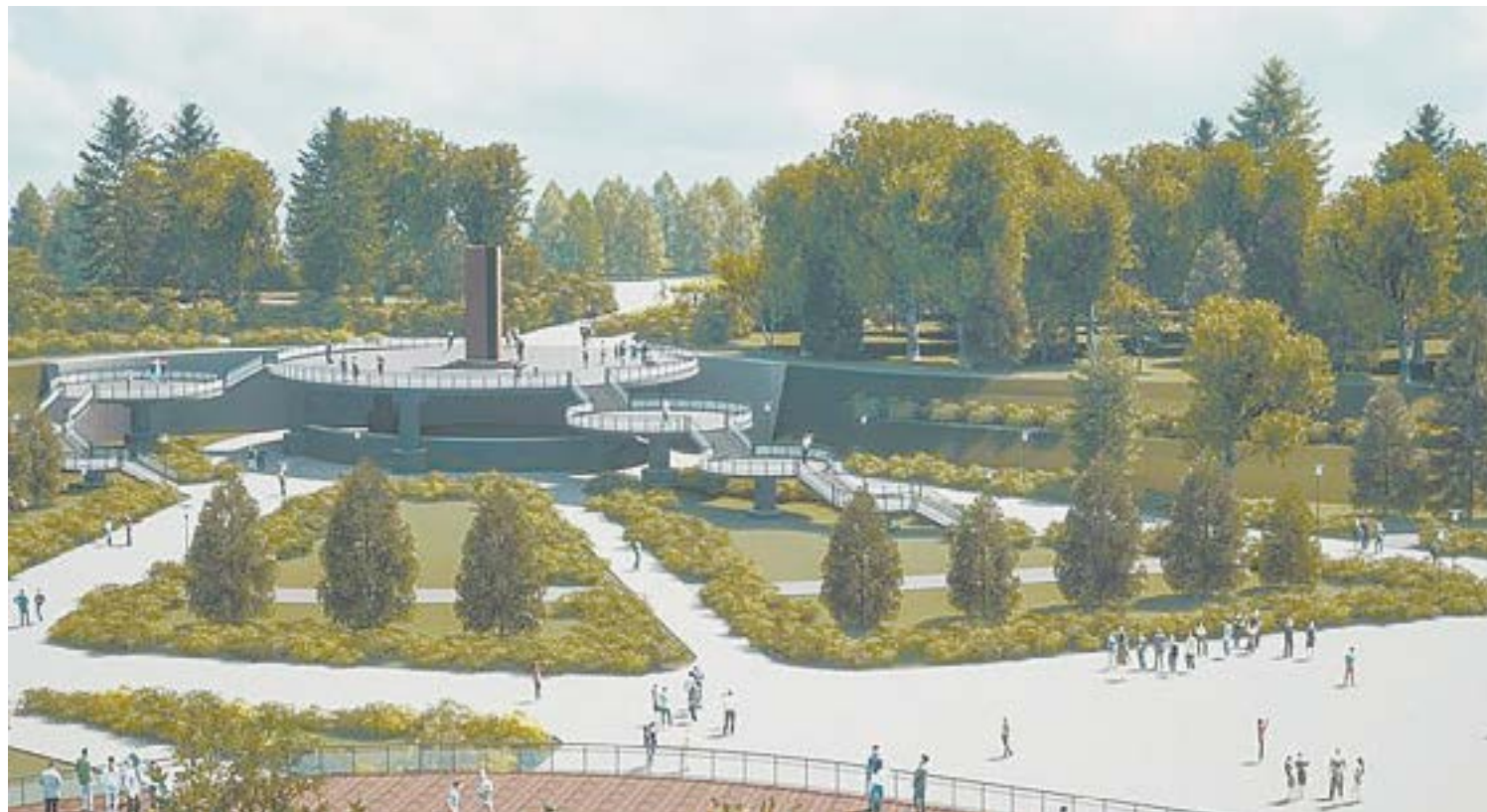
Один из проектов будущего парка за ТЦ «Европа».

Территория за торговым центром «Европа» – лидер в продолжающемся голосовании барнаульцев по выбору объектов для благоустройства в 2025 году по федеральному проекту «Формирование комфортной городской среды» нацпроекта «Жильё и городская среда». Идею ее реконструкции поддержали более 1800 горожан.