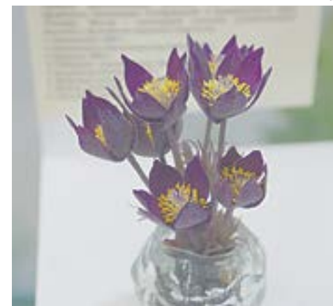
Цветы из полимерной глины.