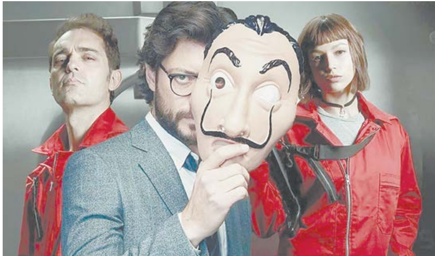
Маски героев сериала начали активно скупать фанаты.

Сюжет сериала канонично строится на хитроумном плане взлома. В первых двух сезонах «Бумажного дома» банда проникает в Королевский монетный двор Испании, а в дальнейшем для фанатов популярной картины сняли продолжение об ограблении Банка Испании. При этом история вполне закончена после первого преступления, однако Netflix решил растянуть удовольствие еще на пару де-