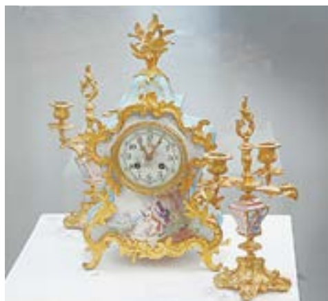
Французские часы конца XIX века.