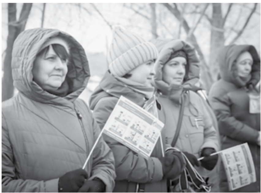
Это праздник для сростинцев.