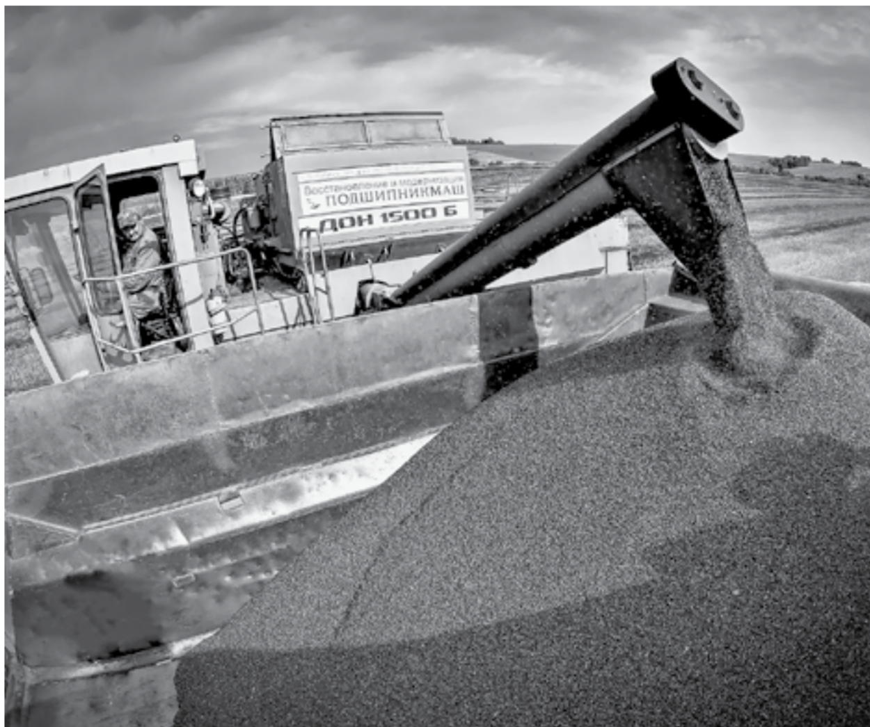
В прошлом году в Алтайском крае собрали много гречихи.

Среди зерновых и зернобобовых культур самую высокую прибыль показала кукуруза (19,7 тыс. руб/га) и гречиха (9 тыс. руб/га). Посевы кукурузы на зерно ежегодно прирастают. Восемь лет назад в крае сеяли 200 га, в прошлом году — 12,7 тыс. га.