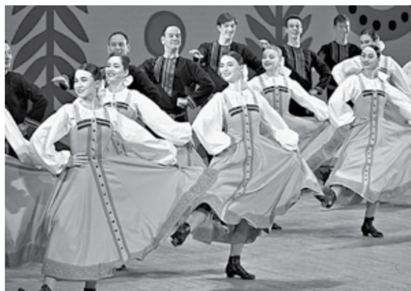
Поздравление от танцевального коллектива.