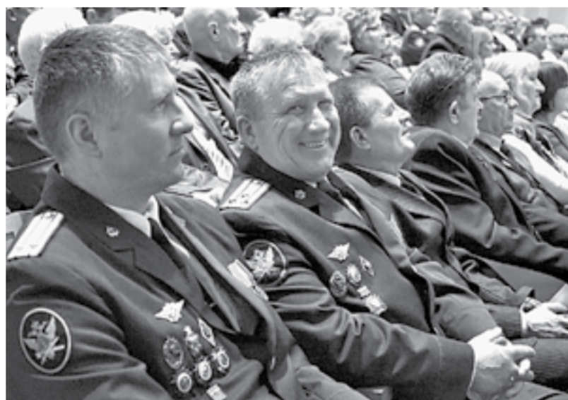
В УФСИН по Алтайскому краю более четырех тысяч сотрудников.