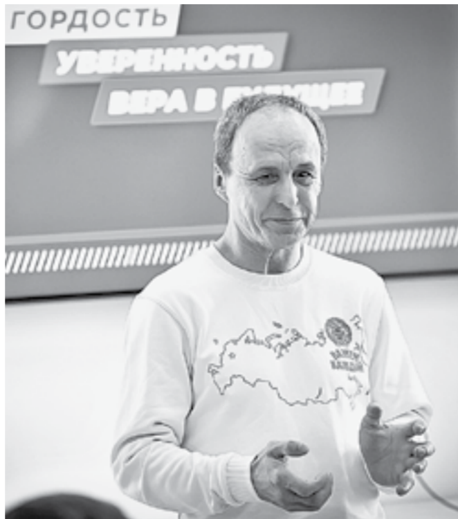
Автор фильма Вячеслав Латышев.