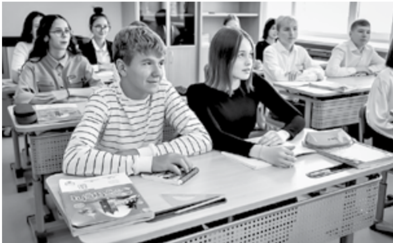
В хороших условиях хотят учиться все.