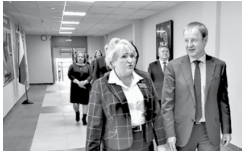
Экскурсия по образовательному учреждению.

— В старом зале на полу было деревянное покрытие, а здесь спортивный линолеум, баскетбольные щиты, электронное табло. Мы готовы любые соревнования по волейболу и баскетболу, бадминтону и футболу принять у себя. Я веду секцию по баскетболу, у нас несколько команд разных возрастов. Еще настольным теннисом дети занимаются. Теперь новый спортзал — это самая востребованная площадка в школе.