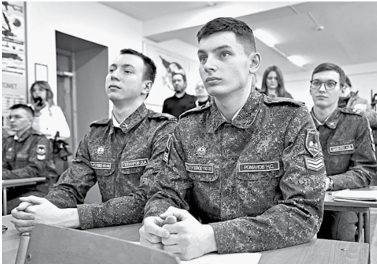
Студенты АлтГТУ задали много вопросов.