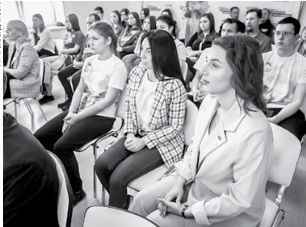
Картина получила положительный отклик у молодежи.