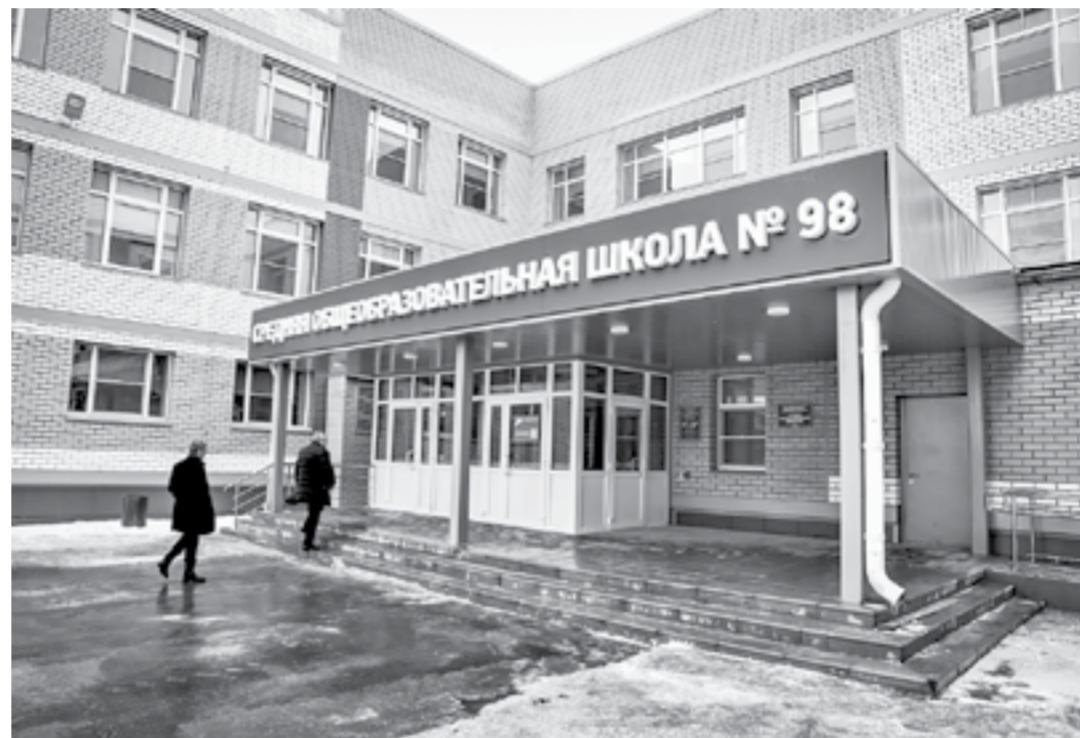
Новый корпус школы во Власихе.