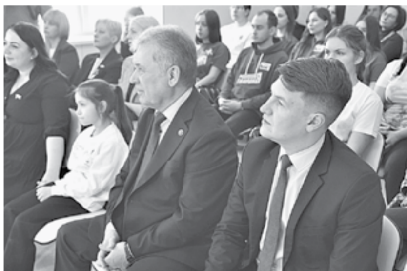
Среди зрителей – представители законодательной власти.