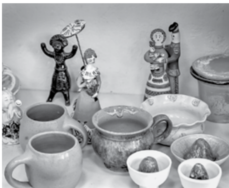
Готовые изделия учеников.

Президентского фонда культурных инициатив был организован фестиваль во время проведения традиционного Шукшинского праздника в Сростках, – уточнил гончар-наставник.