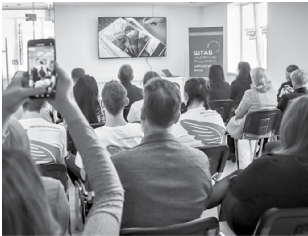
Во время просмотра фильма.

«Люди должны знать, что происходит с нами и нашими семьями. Жизнь очень изменилась, и мы бы хотели, чтобы как можно больше зрителей узнали о настоящих героях, которые отдали жизнь