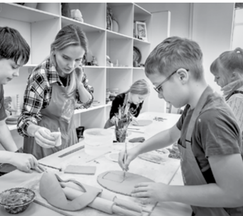
Ребята охотно посещают занятия.

– Мы можем сейчас одновременно принимать у себя целую школьную классы, до 40 человек. А для базового