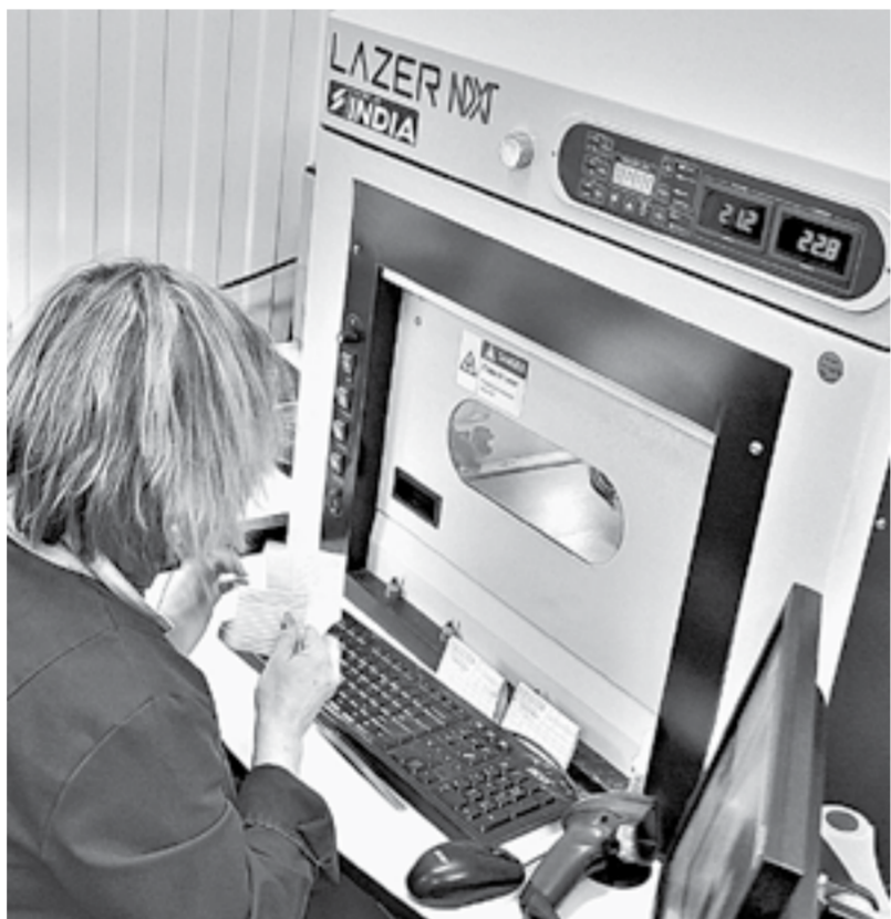
Тот самый индийский станок.