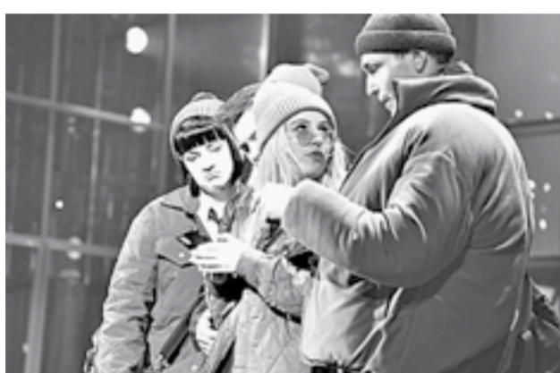
Динамику отношений выстроили правдоподобно.