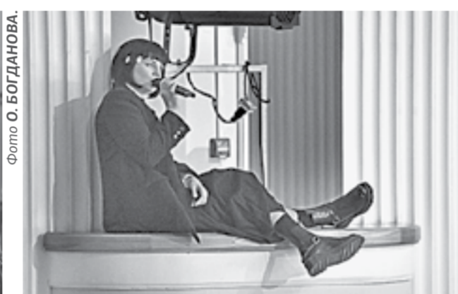
Девочка из «стай».

в своем мягком зеленом джемпере выглядит чужеродно до самого конца. «Я недавно в городе и живу у бабушки. Люблю читать фанфики. И писать фанфики! Смотреть дорамы», – она представляется перед классом, перечисляя вполне расхожий набор увлечений.