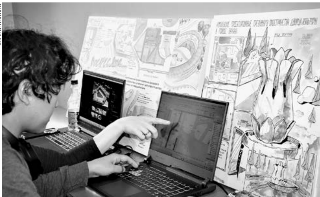
Новые технологии проникают во все сферы нашей жизни.

Визит совета Общественной палаты в АГИК как раз и способствовал тому, чтобы как можно более полно