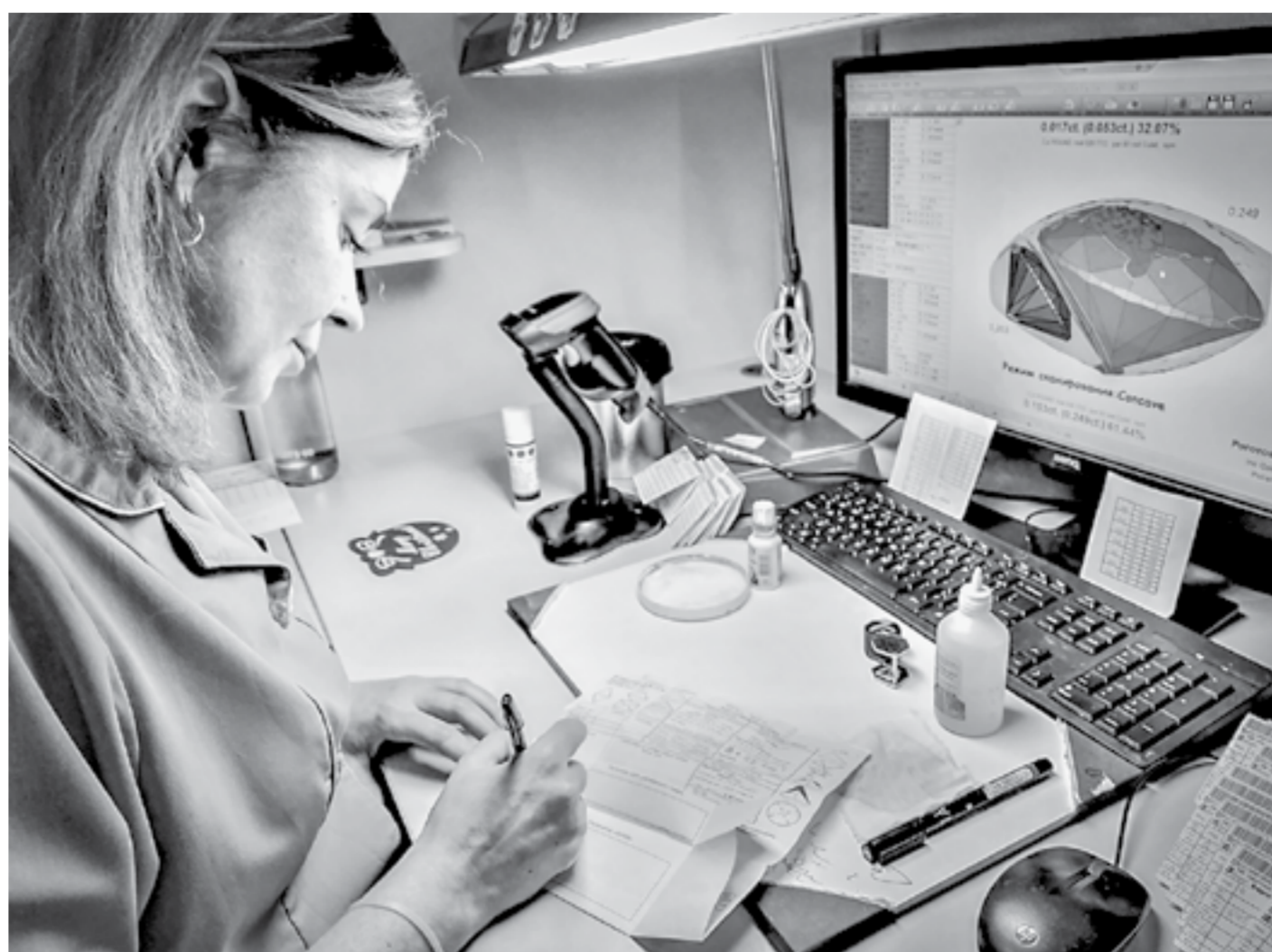
На компьютере у оценщика алмаз кажется огромным, а на самом деле он крошечный.

Кроме того, на заводе появился программно-аппаратный комплекс, который помогает довести новичка до уровня опытного огранщика. То есть компьютер под-