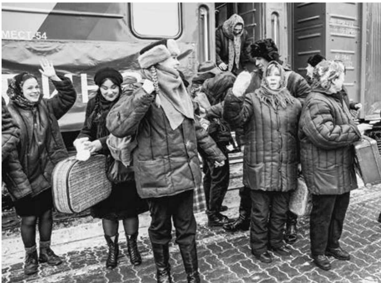
Барнаул, встречай гостей!