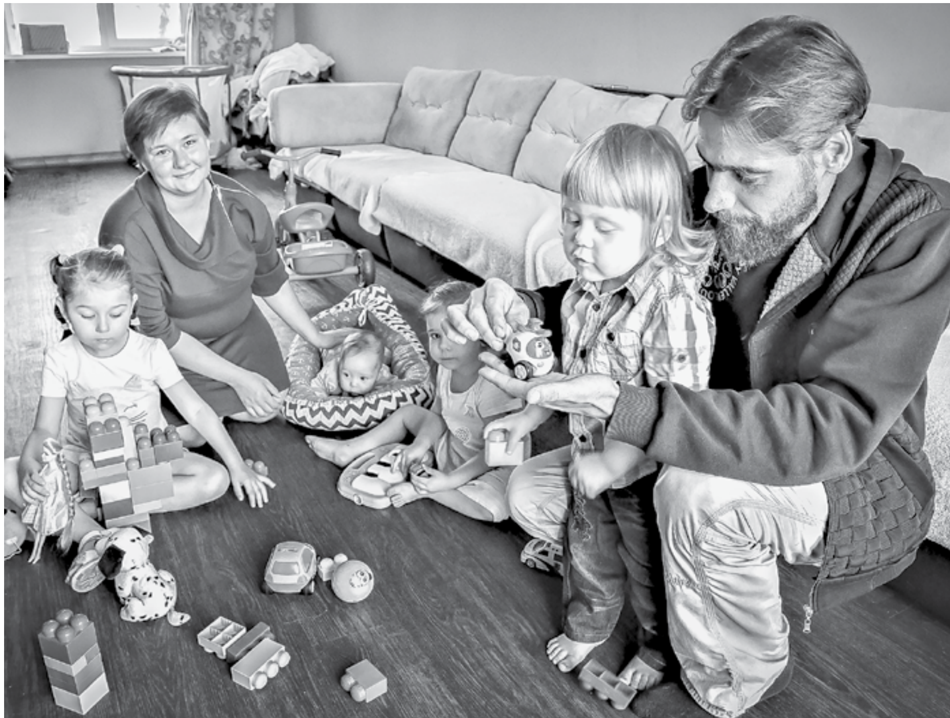
Государство будет поддерживать многодетные семьи.

Для увеличения эффективности, перевооружения производств продолжат создавать передовые инженерные школы на базе вузов. К 2030 году по стране будет развернута сеть из 100 таких центров, которые будут готовить специалистов высшей квалификации и предлагать оригинальные технические решения, причем в самых разных областях.