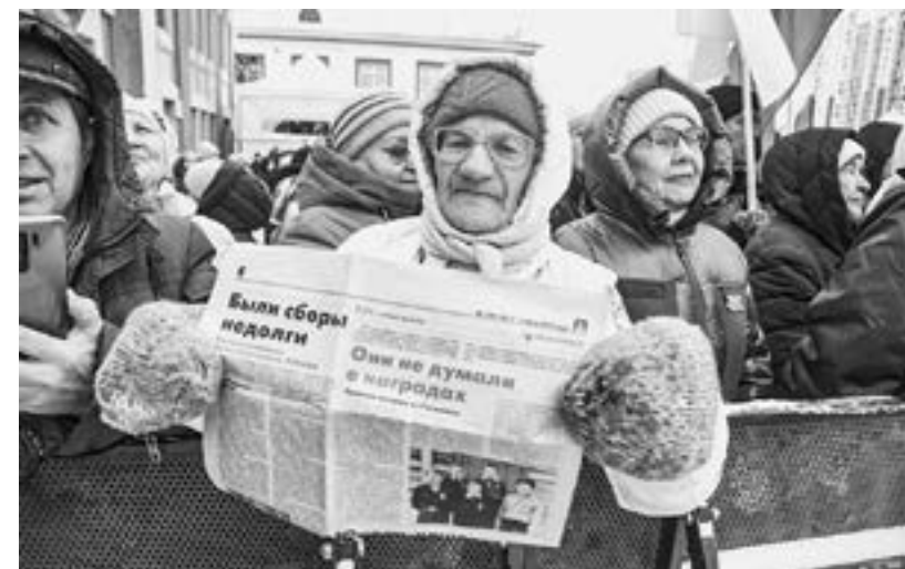
Люди труда всегда на страницах «Алтайской правды»