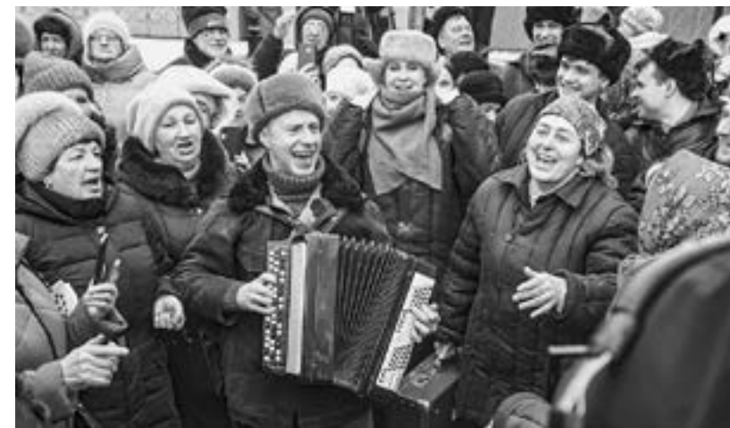
Трудиться – так с песней.