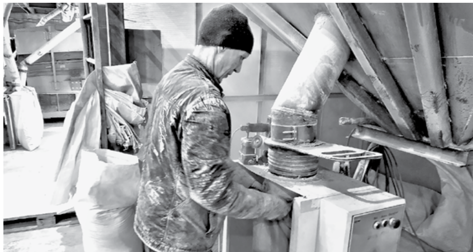
Китайское оборудование показало себя хорошо.