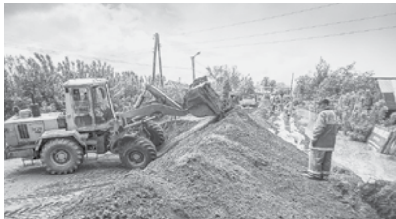
Отсыпка дамбы в преддверии паводка.

ЦЕЛЕНАПРАВЛЕННАЯ СЕРЬЕЗНАЯ РАБОТА ПО ПОДГОТОВКЕ К ПРОХОЖДЕНИЮ ВЕСЕННЕГО ПОЛОВОДЬЯ В РЕГИОНЕ ВЕДЕТСЯ НА ПРОТЯЖЕНИИ ПОСЛЕДНИХ ЛЕТ.