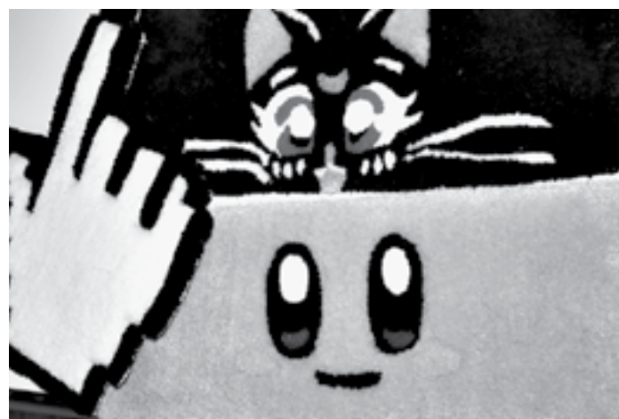
Мастеру по плечу любые рисунки и форма.