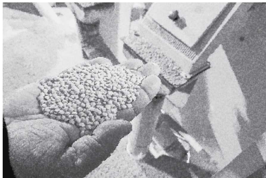
Чечевица после шлифовки и очистки.

Компания «Алтай ЭКО Сорт» первой в крае начала продавать чечевицу за границу и тем самым вызвала интерес к этой культуре у местных аграриев. За десять лет предприятие закрепилось на внешних рынках, в том числе благодаря господдержке.