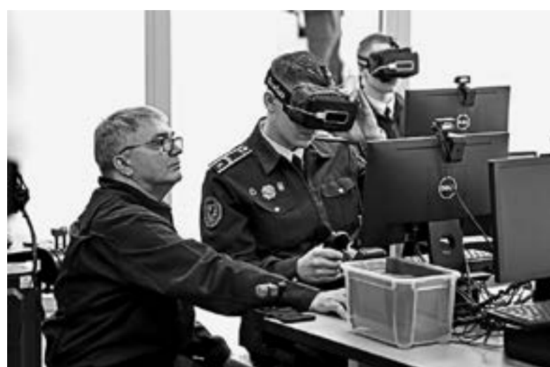
Занятия на авиатренажере.

На праздничном построении – 150 воспитанников.