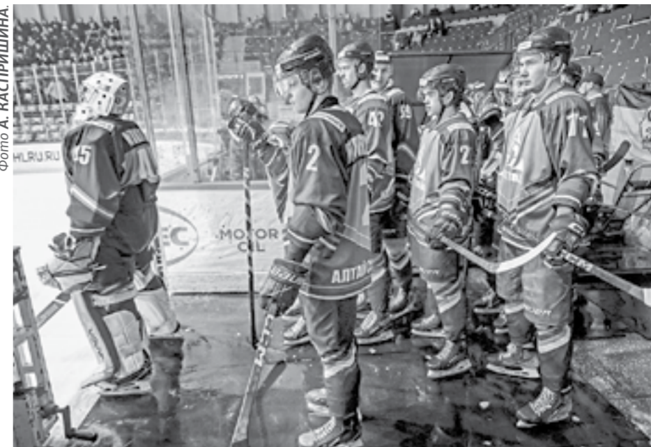
В дебютном сезоне на уровне ВХЛ динамовцы не были «мальчиками для битья».