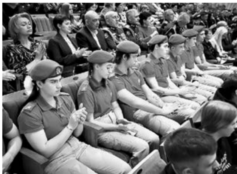
На мероприятии присутствовали юнармейцы.

Жена погибшего кадрового военнослужащего, который неоднократно выполнял воинский долг в горячих точках, мно-