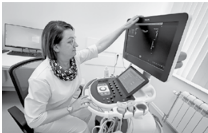
Впервые все услуги – в одном месте.