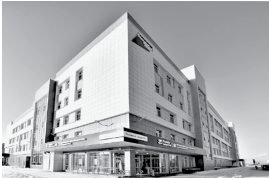
Новое здание поликлиники на улице Лазурной.

Глава региона сообщил, что только за время строительства поликлиники население, которое должно быть приписано к учреждению, выросло на 20%. По его словам, реализация всех направлений нацпроекта «Здравоохранение» позволила за последние пять лет решить огромное количество задач. В связи с этим не обошлось и без слов благодарности в адрес Правительства и Президента за помощь в развитии сферы. «Купили 11 тыс.