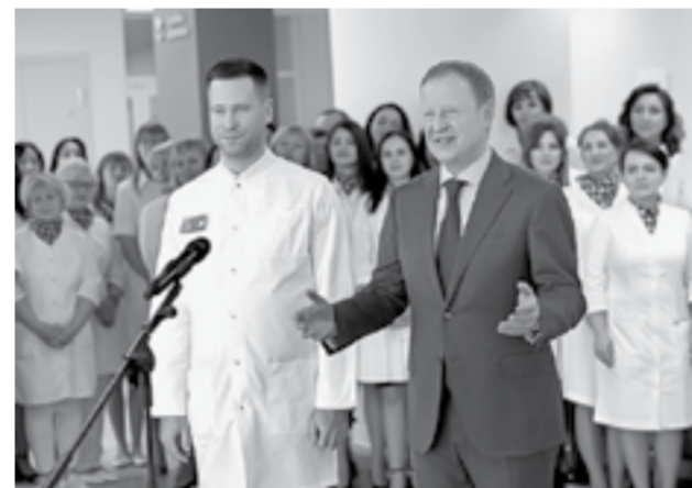
На торжественном открытии.