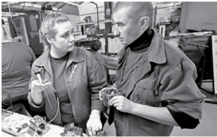
Алтайский завод на новом этапе развития в условиях импортозамещения.

тский край у завода. Известно, что 40 машин для автопарка муниципального транспортного предприятия Барнаула приобретено в прошлом году.