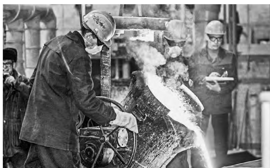
В филиале «Алтайвагона» улучшат условия труда сталеваров.

В Рубцовске проанализировали результаты работы 15 крупных и средних промышленных предприятий, и они порадовали. По данным, представленным комитетом по промышленности, энергетике, транспорту и дорожному хозяйству города, объем произведенных товаров и услуг вырос на 3,5 процента по сравнению с предыдущим годом и составил 36,3 миллиарда рублей, а товарной продукции отгрузили на 36,9 миллиарда рублей (+16,2%).