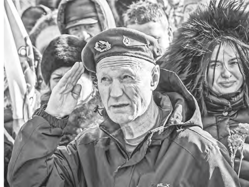
На площади Победы собрались воины-интернационалисты.