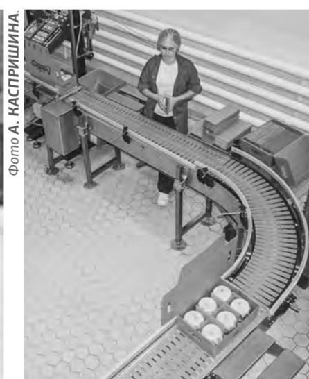
Лидер рейтинга – Рубцовский молзавод.