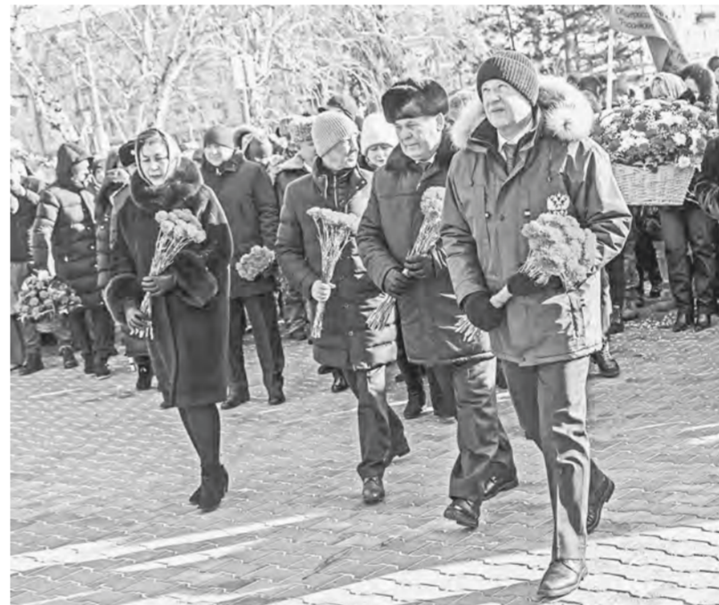
Официальные лица возложили цветы к мемориалу.

Акцент на текущих событиях, на проведении специальной военной