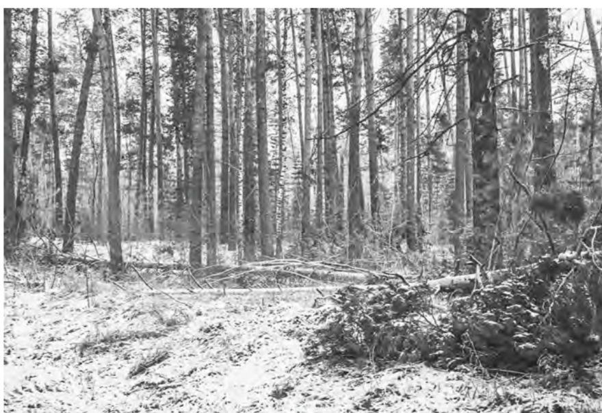
Шивал проредил лес, а кто его расчистит?

– Мы часто ходим гулять в наш бор. У нас замечательная природа. Но то, что случилось после ноябрьского урагана, нельзя описать словами. Страшная картина. Столько поваленных и сломанных деревьев! В районе лыжной базы