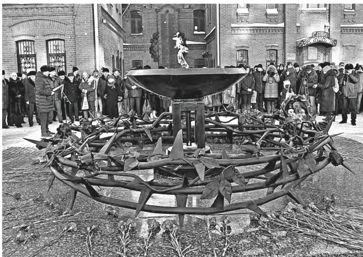
Каждое 15 февраля митинги проводились у Дома афганцев в Барнауле.

К моменту вывода войск уже не только зародилось, но и четыре года развивалось движение ветеранов Афганистана, в том числе в нашем регионе. Первая их организация – Совет вионоинтернационалистов – появилась в Алтайском крае в 1985 году. За 39 лет существования меняла свои названия. Недавно было принято решение, что она станет АКОО «Русский союз ветеранов Афганистана и специальных военных операций». Ведь под свое крыло она взяла тех ребят, которые прошли горячие точки на Северном Кавказе, и сейчас многие участники специальной военной операции также идут сюда.