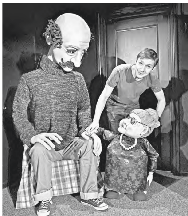
На репетиции спектакля «Папа ищет работу».