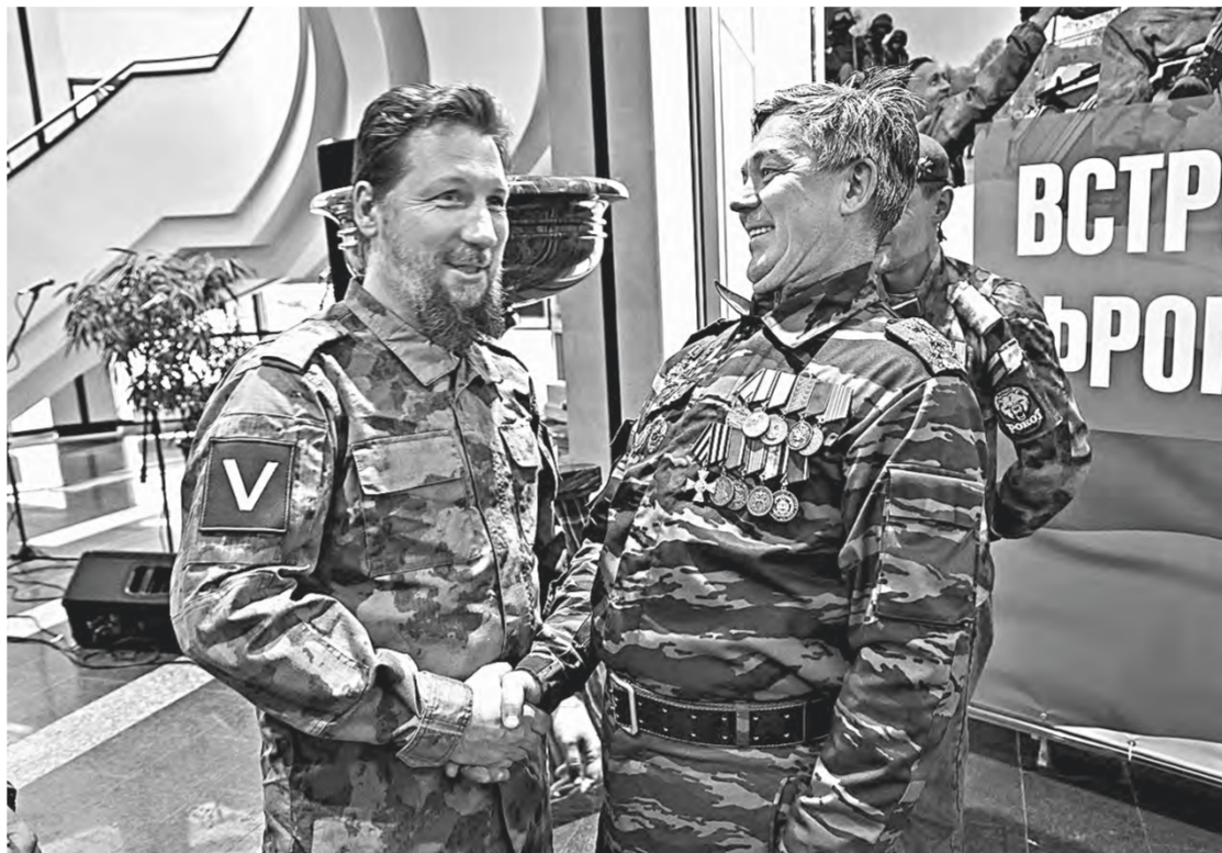
Участники боевых действий – в числе гостей.