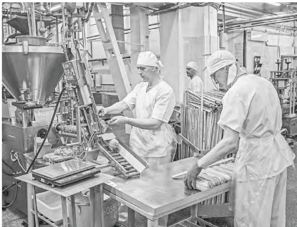
Вся Россия знает алтайский сыр.