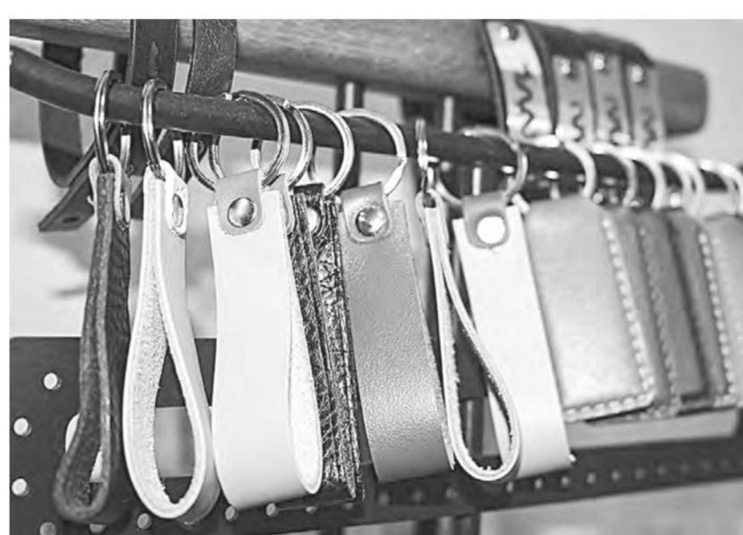
За день Артём может изготовить до 50 брелоков.

— Кожу для изделий мне поставляют из Италии. На российском рынке тоже есть неплохое сырье первого