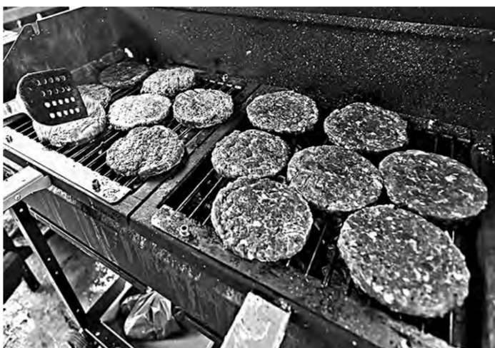
Алтайское блюдо по рецепту блогера.

Единственное, что смущало принимающую сторону, – это погода. Накануне в крае, как на грех, было объявлено штормовое предупреждение. Обещали сильный ветер, гололед и даже дождь. Но съёмочная группа настояла на проведении мероприятия в субботу, сославшись на жесткий съёмочный график.