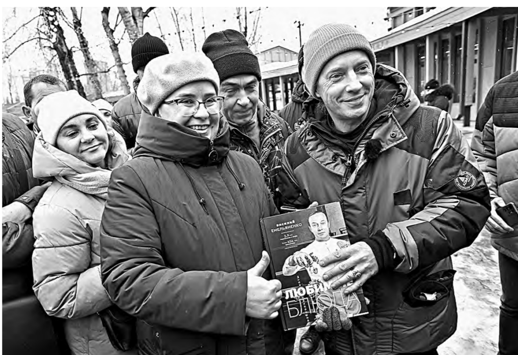
Фото со звездой Rutube.

По его словам, парк готов к приему таких гостей, достаточно хорошо благоустроено, есть теплые специализированные помещения, где можно разместить съёмочную группу и оборудование.