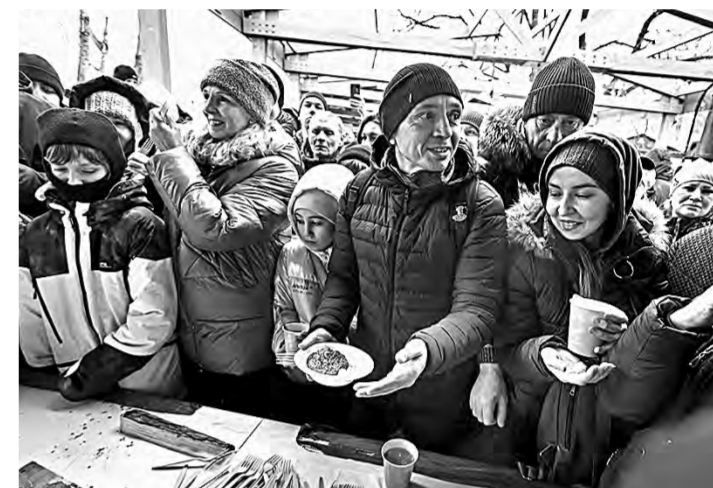
Погода не помешала любителям маралатины.