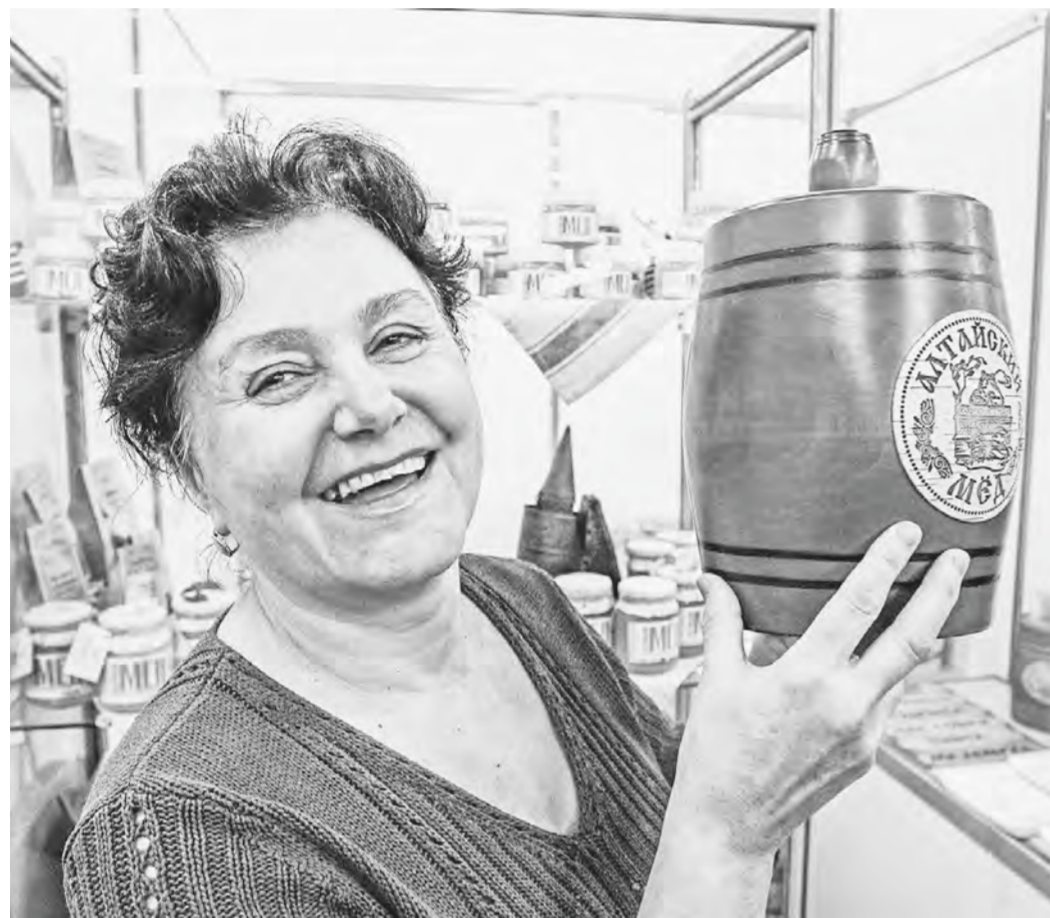
И вкусно, и полезно!

В выставке «Продэкспо-2024» в Москве приняли участие 22 алтайских компаний.