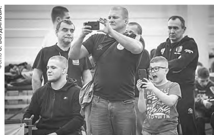
Грусть и радость болельщиков.