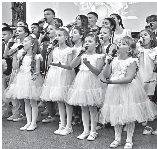
Выступления творческих коллективов края.