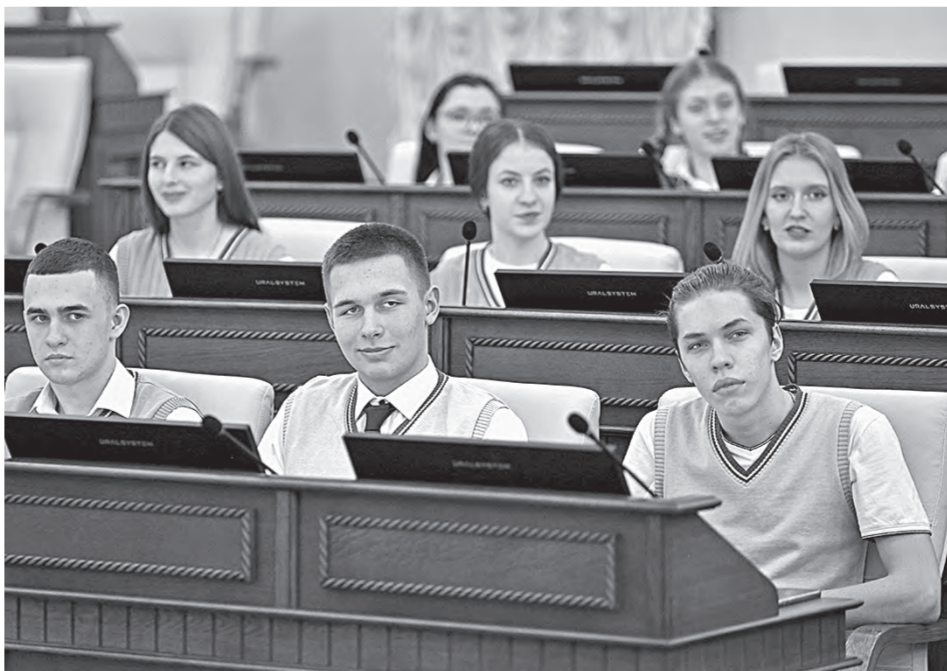
Учащимся было интересно ощутить себя в роли парламентариев.

Школьники также ознакомились с галереей почетных граждан края, стендами фракций АКЗС, побывали в большом зале Парламентского центра, где проходят сессии АКЗС. Особенно интересно было ученикам протестировать электронную систему голосования.