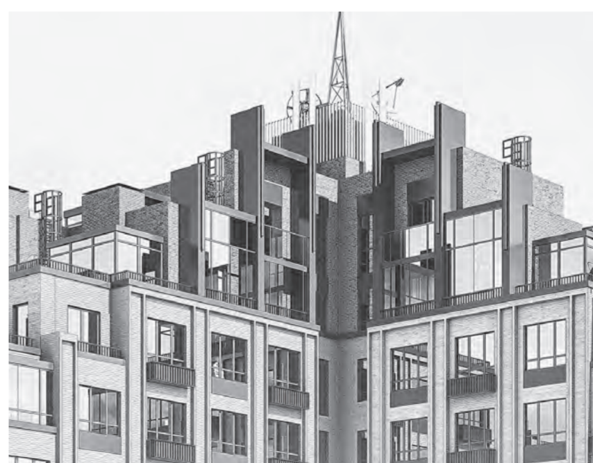
Верхние этажи дома, представленные в проекте «ПСК».

Но барнаульским архитекторам категорически не понравилось у Антонова нагромождение объе-