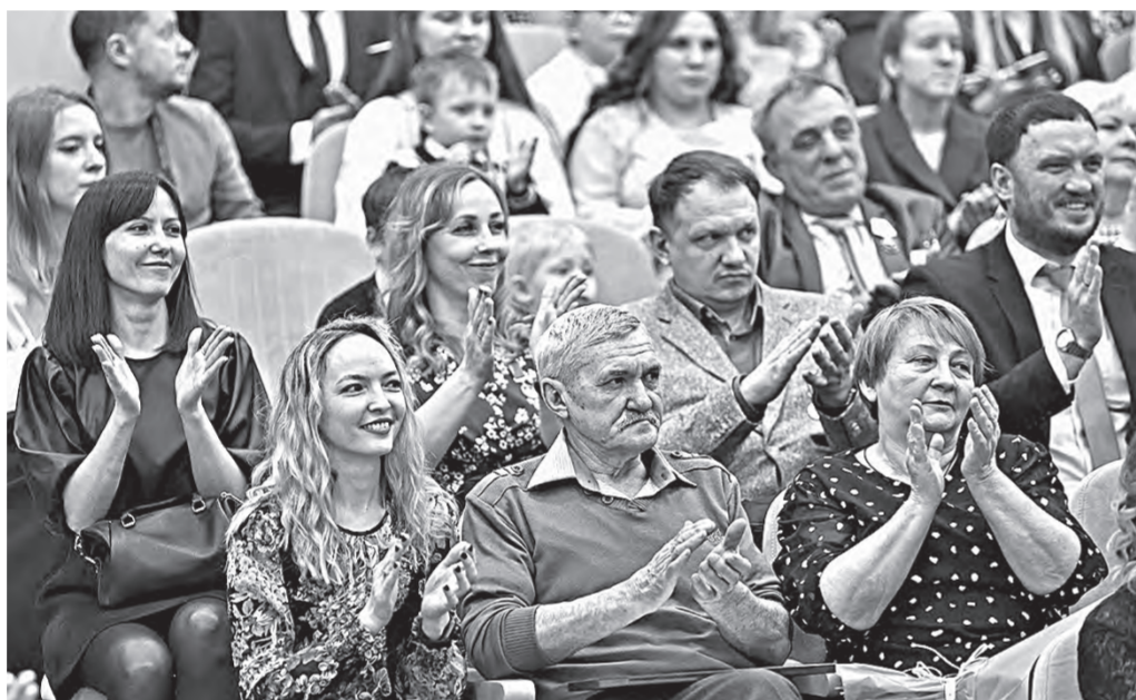
В зале царил теплая, дружеская атмосфера.