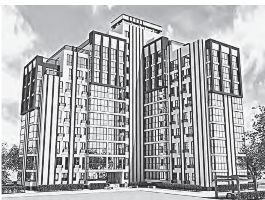
Эскизный проект «Мастерской Золотова».

Дом находится в непосредственной близости от школы, спортивных площадок и парковой зоны, что делает это место комфортным для проживания. В нем планируется 110 небольших квартир. Поэтому и число проживающих в них ориентировочно составит 156 человек. По расчету, им полагаются 54 машино-места, при этом 28 разместятся непо-