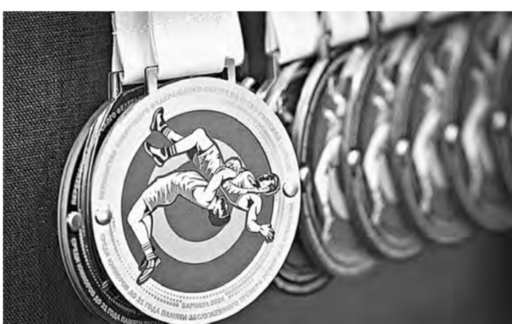
Стильные медали для сильнейших.