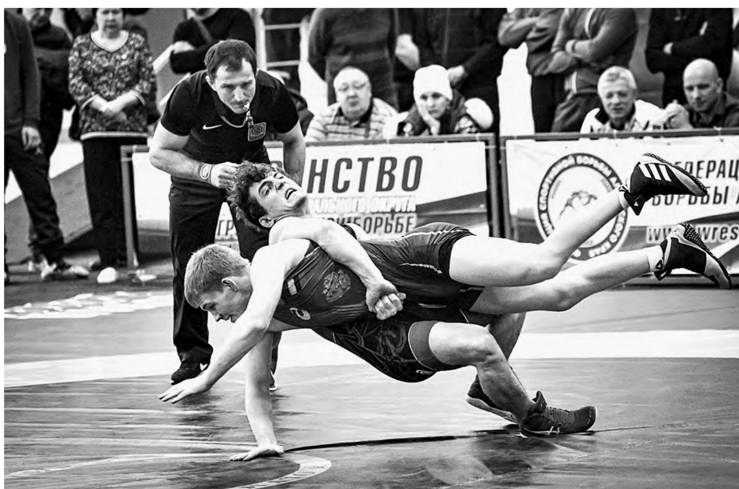
Участники юниорского первенства Сибири разыграли 10 комплектов наград.

Борьбу за медали и путевки на первенство России вели юниоры до 21 года. В турнире участвовали борцы из Алтайского и Красноярского краев, Иркутской, Томской, Кемеровской, Омской и Новосибирской областей, республик Алтай и Хакасия. Самую большую делегацию в Барнаул отправили новосибирцы – 37 человек. Даже у хозяев представителей оказалось