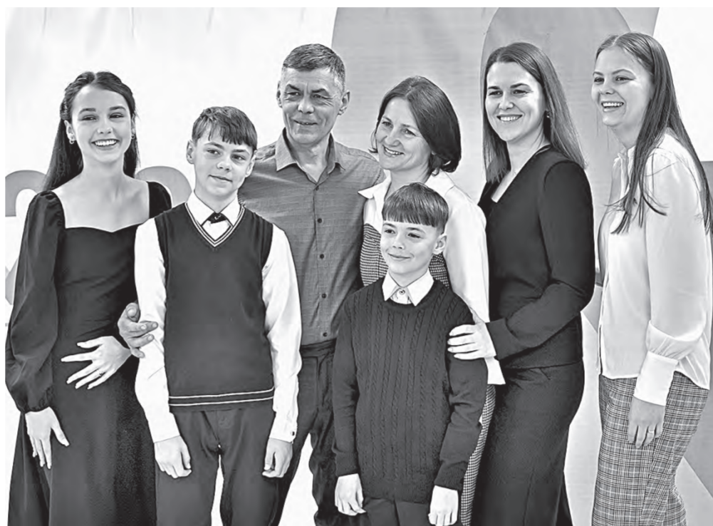
Многодетная семья Королёвых из Павловского района.