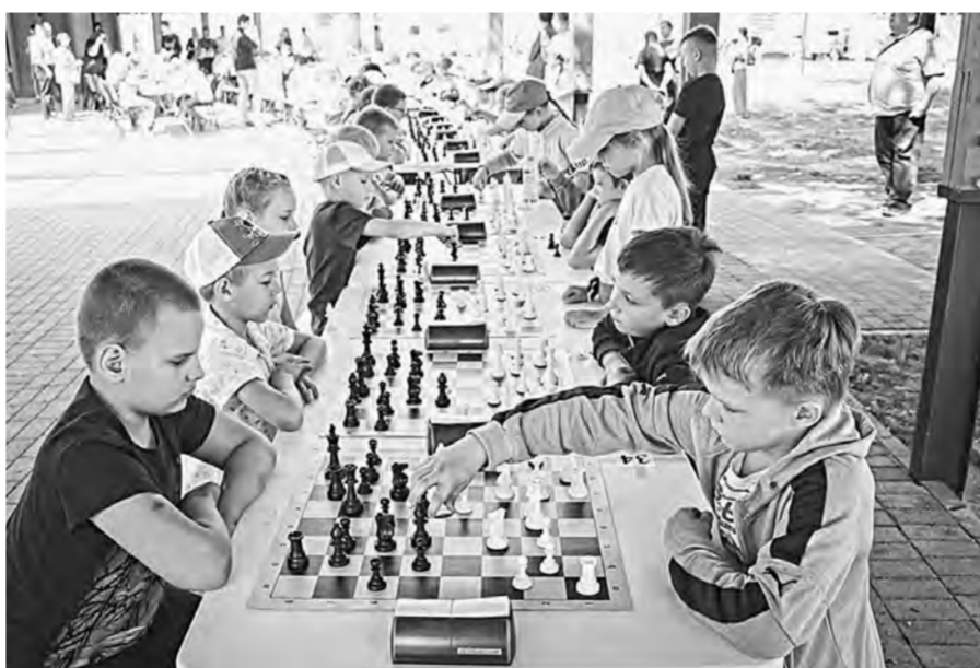
Детско-юношеские шахматные турниры отличаются массовостью.

Ежегодно на содержание лагеря муниципалитет выделяет чуть менее 3 млн рублей. Учитывая, что лагерю уже много лет, ему требуется большое материально-техническое обновление. На уровне района найти средства на такую работу достаточно сложно.