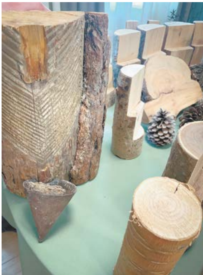
На сосне специальные прорезы для сбора смолы.

Савин. Подсочку леса (периодическое нанесение специальных резов на ствол дерева в период его вегетации с целью получения продуктов жизнедеятельности растения) называют еще зеркалом карры. Человек специальным ин-