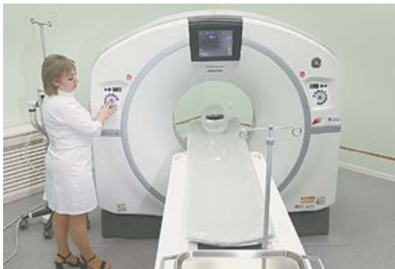
Собственный 64-срезовый компьютерный томограф.