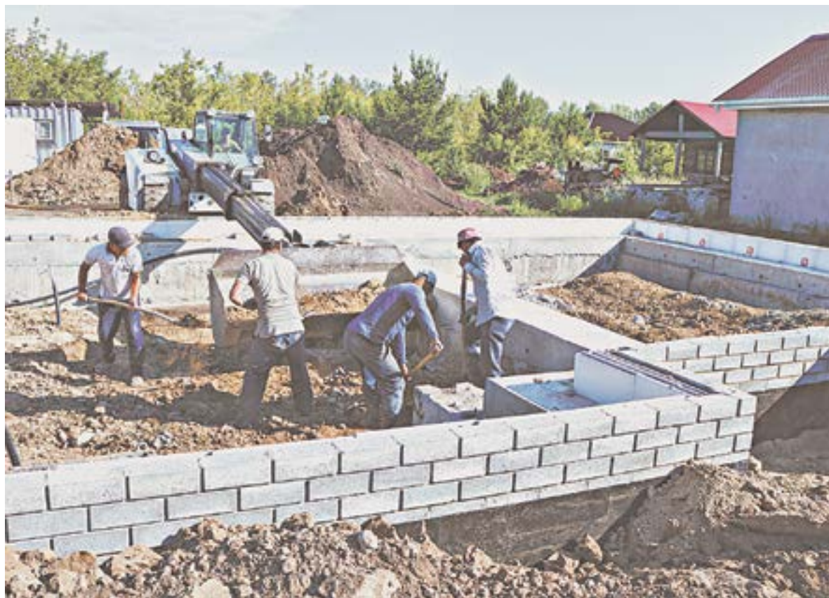
В пригороде Барнаула – поселке Центральном – активно идет строительство жилья.

– Сегодня в строительстве вопрос номер один – комплексное