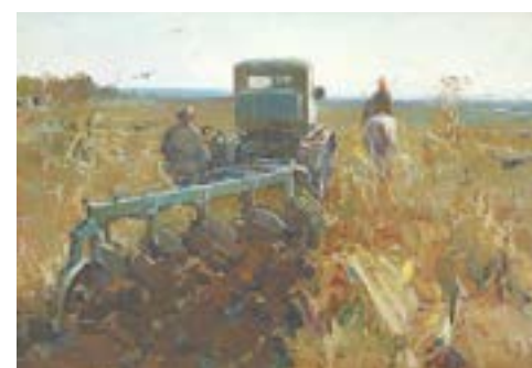
Картины отражают историю страны, в которую Алтай вписал свои яркие страницы.