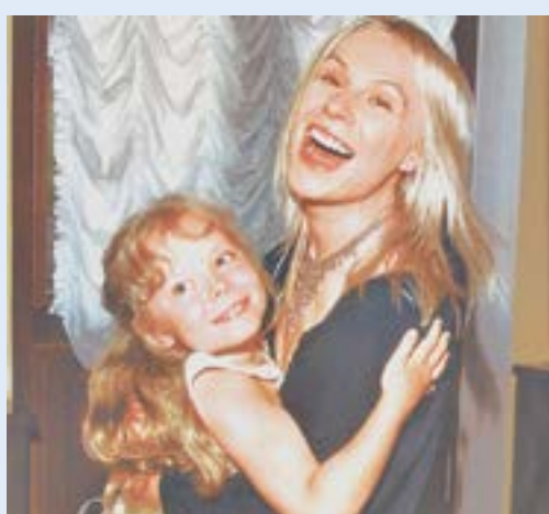
Дина Корзун с дочерью.

– Много раз слышал эту историю о возможном «вторжении в Казахстан». Думаю, это мистификация. Зачем России вторгаться в страну, с которой мы связаны исторически? Лучший способ противостоять этой абсурдной пропаганде – заниматься культурной работой в Казахстане. Помогать молодому поколению узнавать об исторических связях двух народов. Осуществлять университетские обмены, участвовать в международных мероприятиях, проводить политику создания специализированных рабочих мест в обеих странах.