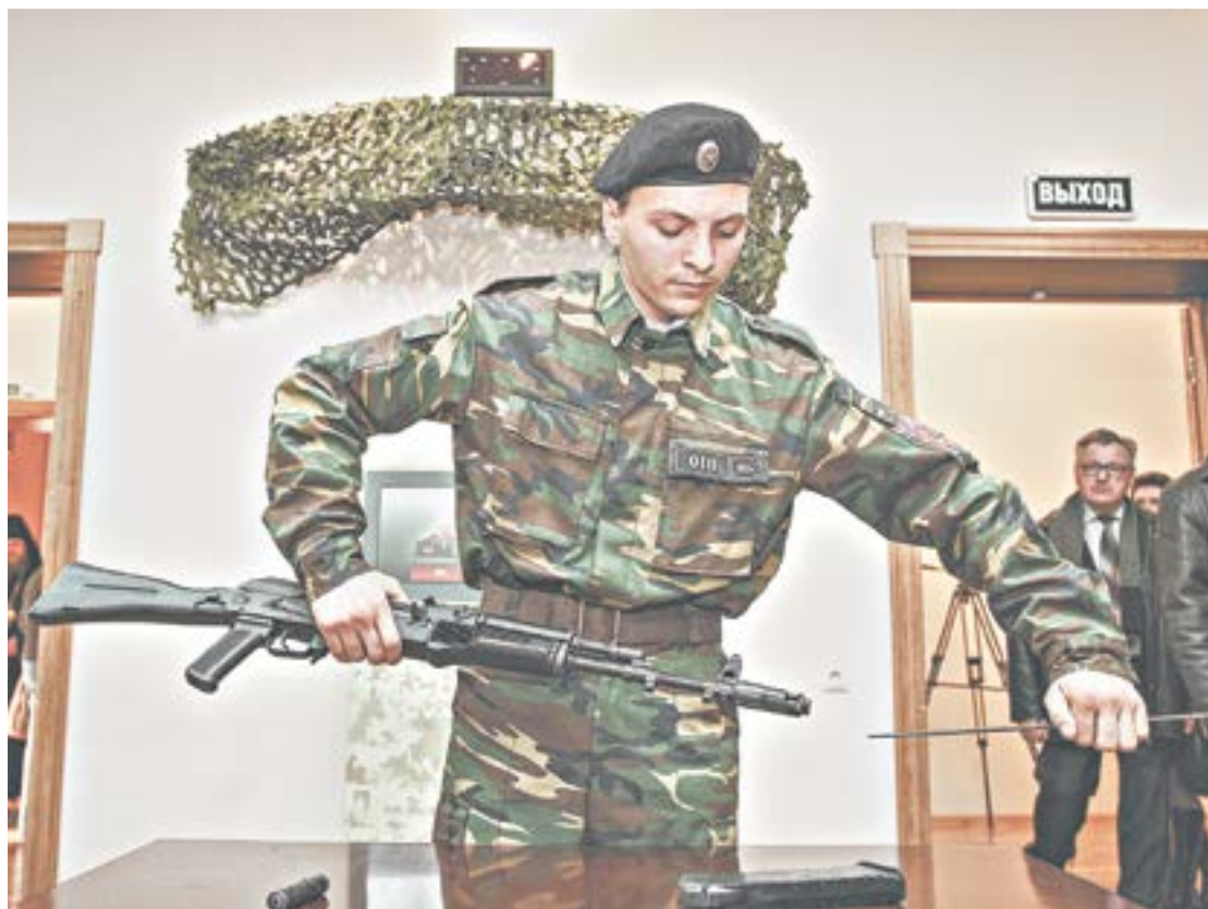
В музее – разборка-сборка автомата.