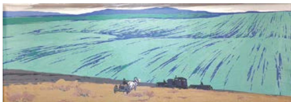
«Весна» В. Добровольский, С. Чернов.