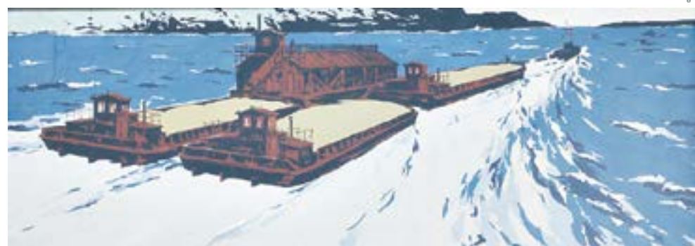
«Караван» В. Добровольский, С. Чернов.