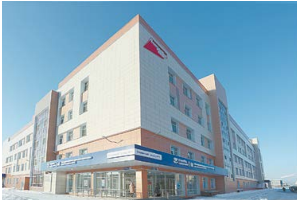
Новый корпус рассчитан на 900 посещений в смену.

– После полного запуска полученных площадей у нас появится возможность расширить функционал в детской поликлинике на Взлётной, 6. Это произойдет за счет того, что медики, которые специа-