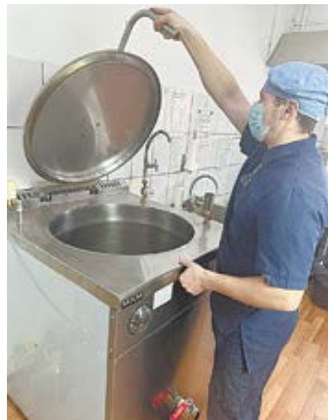
В 2023 году предприятие изготовило около 3,5 миллиона единиц продукции.

система маркировки и прослеживания продукции).