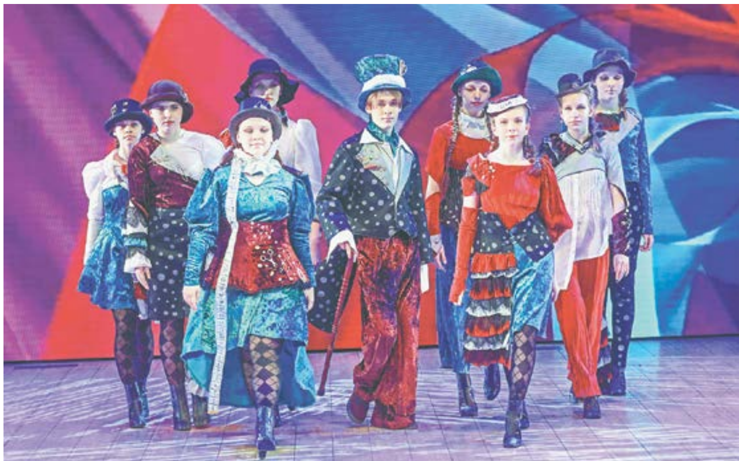
Ежегодно в школе моды обучается более 80 человек от 5 до 19 лет.