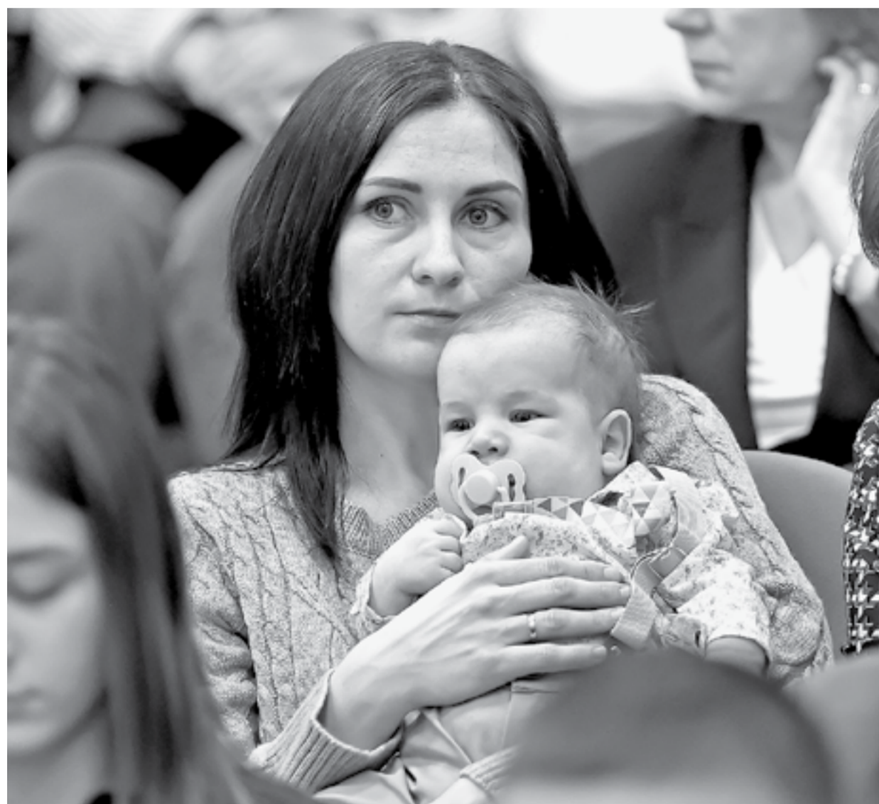
Самый маленький будущий новосел.