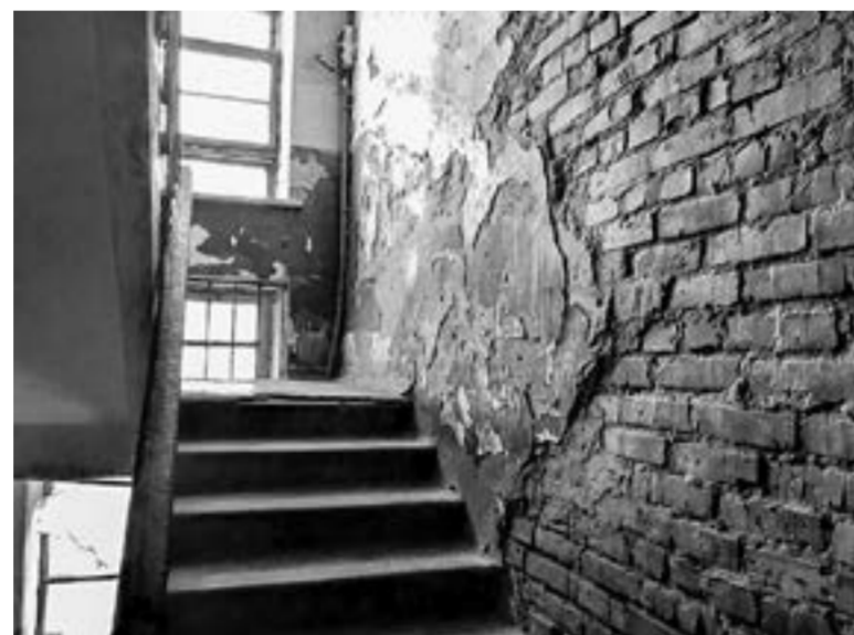
Со стен подъезда дома на ул. Дзержинского, 16, осыпалась штукатурка.

Этот дом один из тех, которые «Соломон» бросил на произвол судьбы накануне отопительного сезона, совершенно не подготовив его к зиме. По сей день в подъездах нет дверей. Говорят, что их сняли сомнительные личности и сдали на металлолом. В том же третьем подъезде разбиты оконные стекла на площадках, и ветер гуляет, периодически заносит снег. Со стен отваливается штукатурка, ступеньки съедены временем и сыростью, а на лестницу,