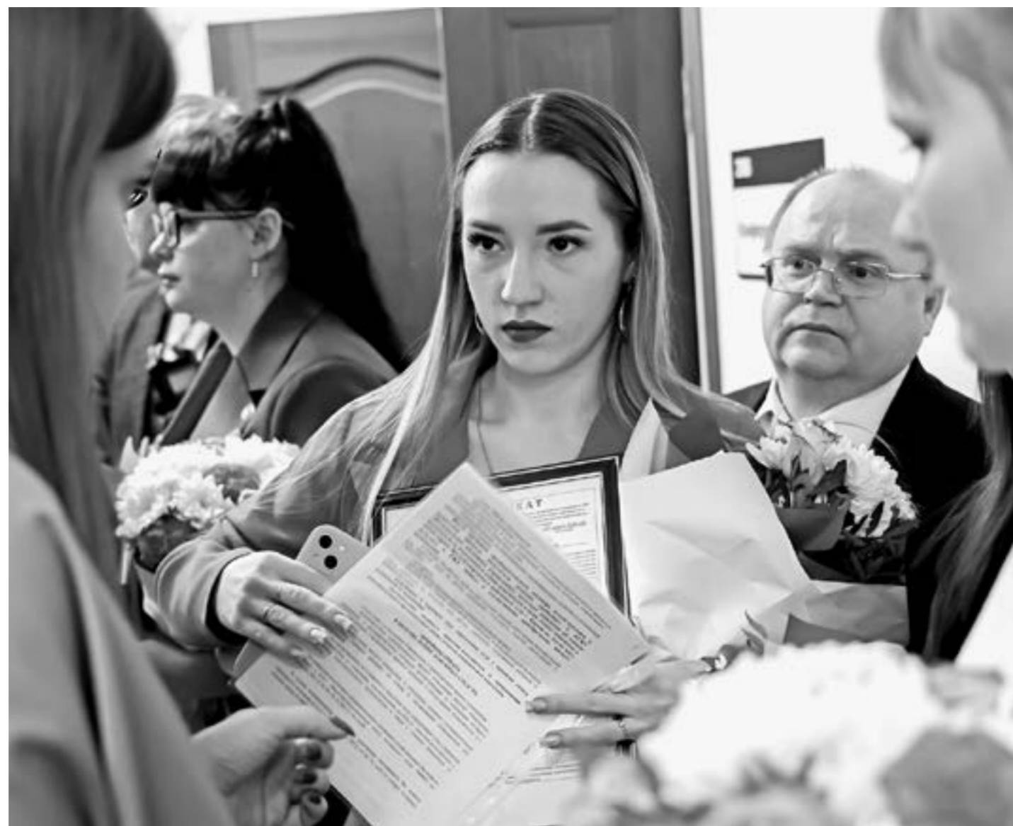
Мечта о собственном жилье теперь становится реальностью.

Губернатор особо подчеркнул, что в Алтайском крае и в ряде других регионов, у которых сложилась такая же история с обеспечением прав на жильё детей-сирот, накопилась огромная очередь. Финансовые возможности региона, и то, что может делать строительный комплекс, по-