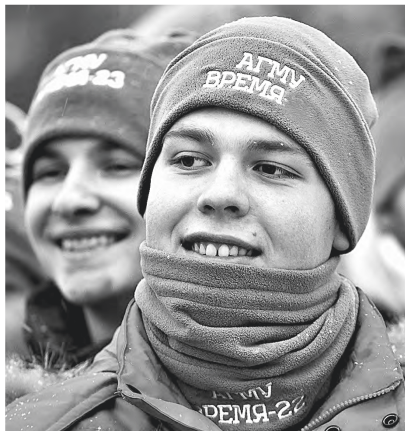
В отрядном движении – более 3,5 тысячи человек.