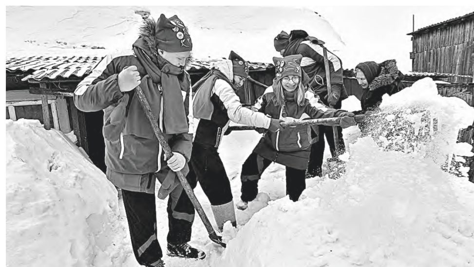
Участники акции «Снежный десант».