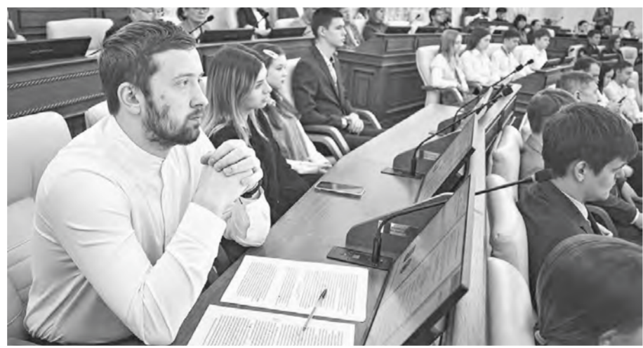
В работе Конвента приняли участие руководители спортивных студотрядов.

Накануне Дня студента в Парламентском центре прошел X Конвент лидеров студенческого самоуправления Алтай. Участники обсудили эффективность развития студенческих спортивных клубов.