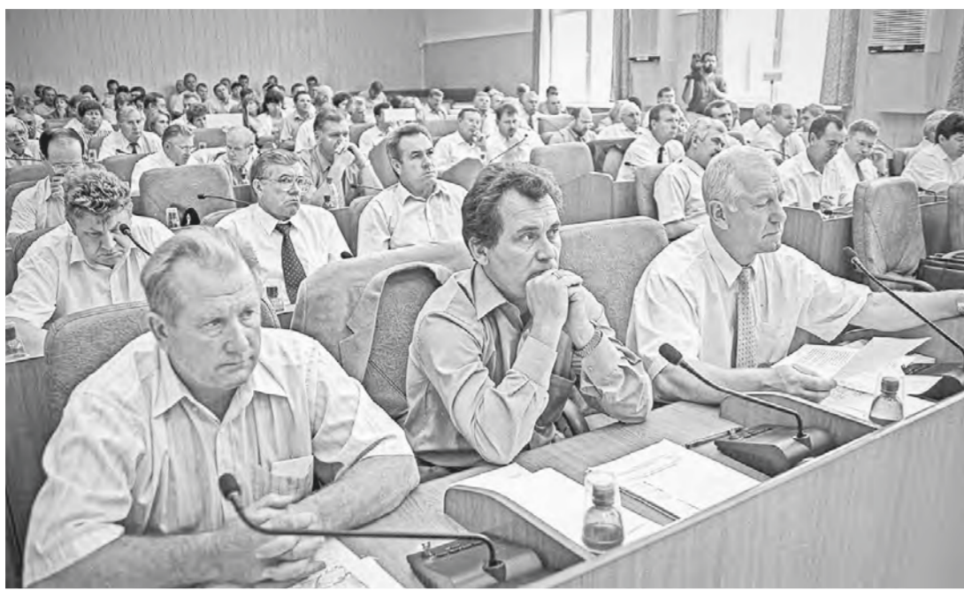
На сессии Совета народных депутатов.

– Все эти годы краевой представительный орган находился на переднем крае развития и жизни территории. Великая Отечественная война, поднятие целины, промышленный ска-