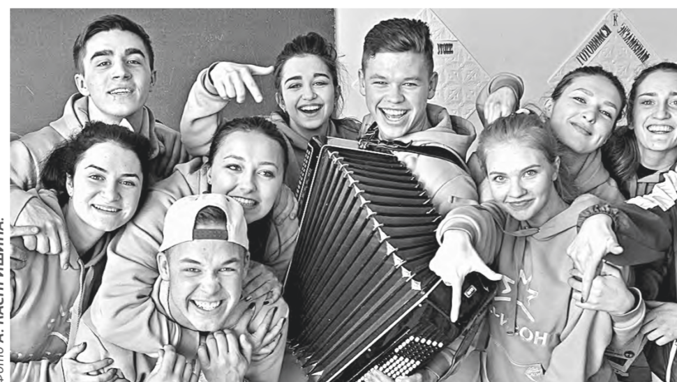
Алтайские студенты – в числе лучших.

В 2023 году на территории Алтайского края созданы три студенческих путинских отряда для работы на территории Сахалинской области и Камчатского края.