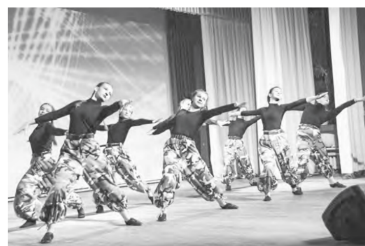
Хореографическая группа «Этажи».

Волонтеры «Весточки из дома – с заботой о солдате» больше года проводят благотворительные концерты в разных городах и районах Алтайского края. Второй раз на днях их принимал Камень-на-Оби. И снова, как и год назад, зал был полон.