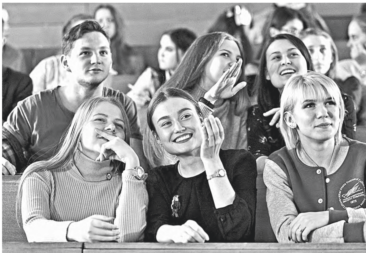
За последние пять лет количество студентов выросло на 10 процентов.