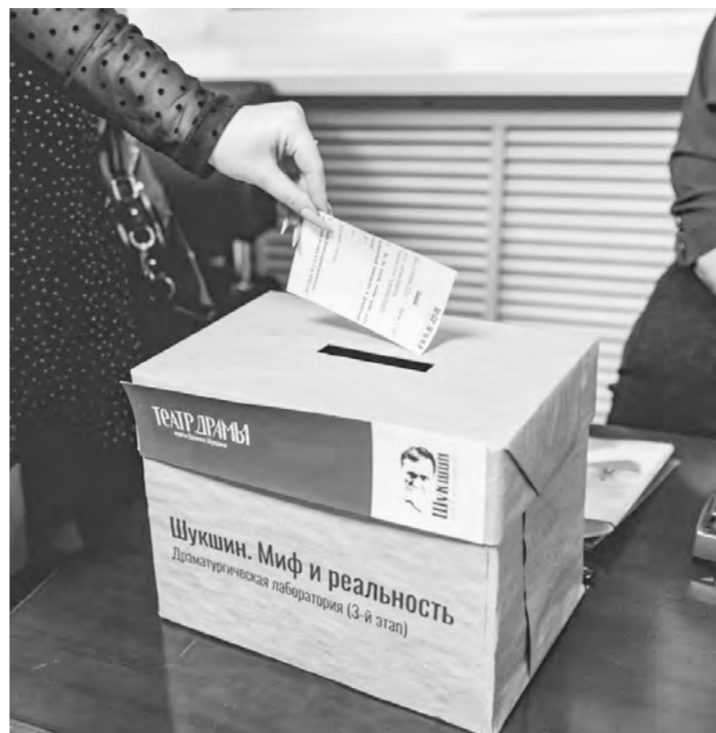
Судьбу эскизов определили зрители.

– Даже шукшиноведы путаются в показаниях, каким был Шукшин, и правды не