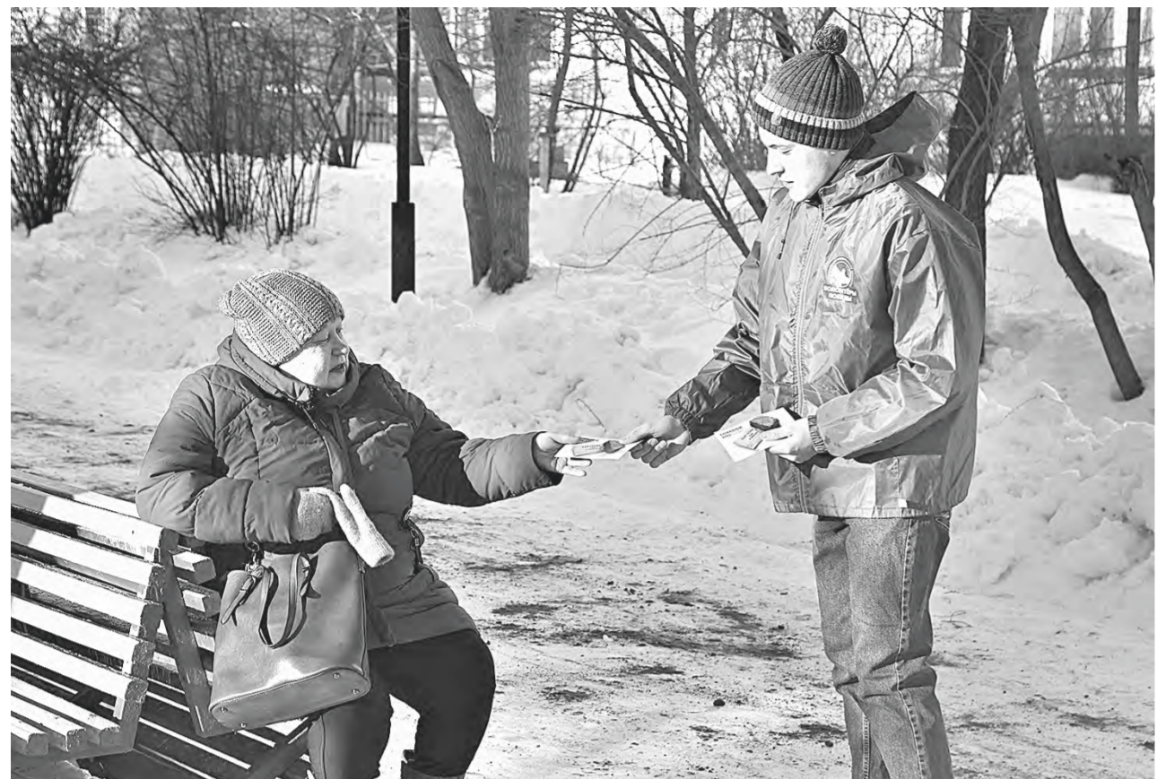
Волонтеры напомнили о судьбе города-героя.