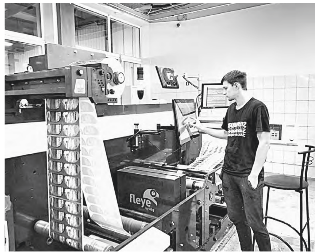
Для качественного производства создан особый микроклимат.

Одно из основных производств – изготовление этикеток. Раньше в типографии сырье для них закупали сразу в нарезку. Оно поступало опре-