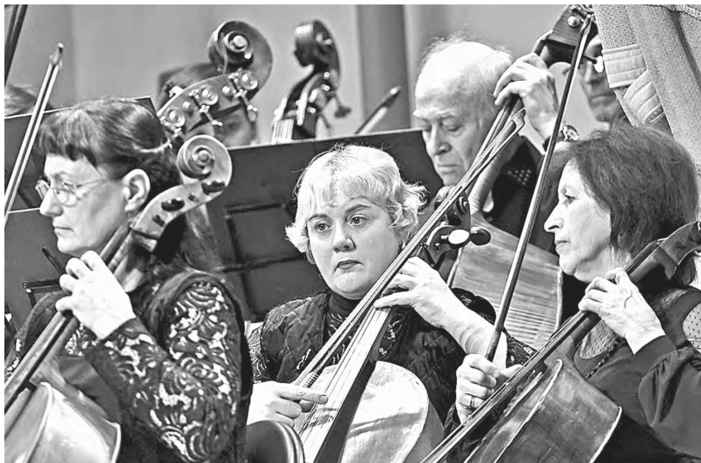
Филармонический оркестр исполнил седьмую симфонию Шостаковича.