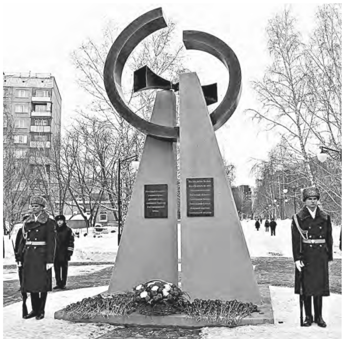
Монумент на Ленинградской аллее.