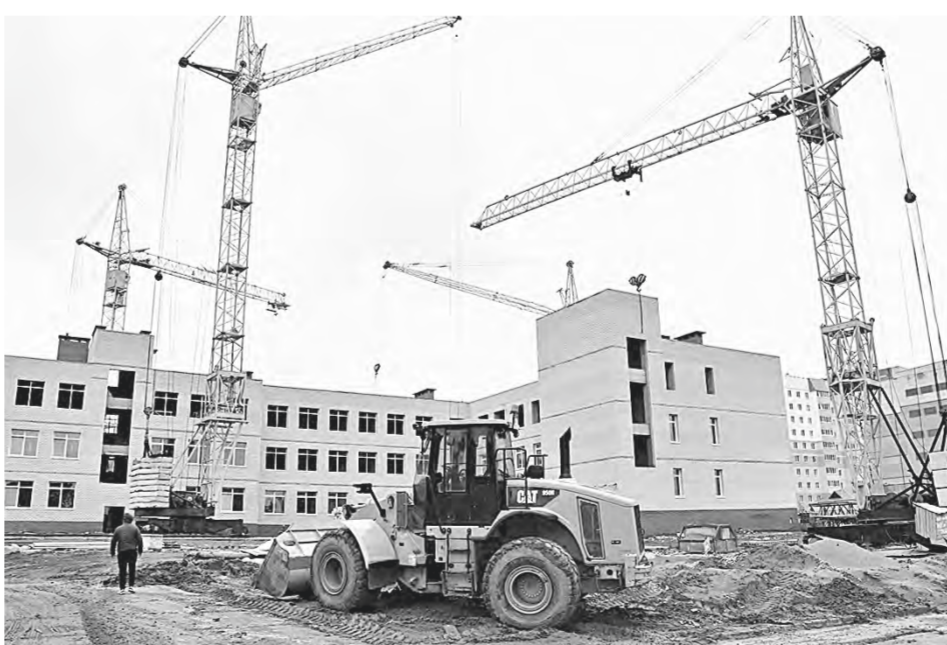
Алтайский край находится во втором месте в СФО по общей площади жилых помещений, приходящихся на человека.

В рамках мероприятия состоялось заседание коллегии Минстроя России. На заседании обсуждались результаты работы и достижения строительной отрасли и жилищно-коммунального хозяйства за последние двадцать лет. Так, за этот период в России введено в эксплуатацию более 200 млн квадратных метров жилья, построено более 100 тыс. километров дорог, реконструировано более 10 тыс. школ и детских садов. Также на форуме работало несколько дискуссионных площадок, где обсуждались вопросы реализации строительного потенциала регионов России, развития инфраструктуры и ЖКХ, подготовки молодых специалистов для строительной отрасли. В зоне культурных проектов Корпорация «Туризм.РФ» представила шесть различных курортов, туристических кластеров и территорий. Один из них – первый за тридцать лет всепогодный бальнеологический курорт «Белокуриха Горная» в Алтайском крае. Открытие объекта запланировано на 2027 год. «Белокуриха Горная» – это масштабный проект, который включает в себя несколько гостиничных комплексов, аквапарк курорт и спа-отель. Ожидается, что к 2030 году туристический поток на эту площадку превысит 211 тысяч человек.