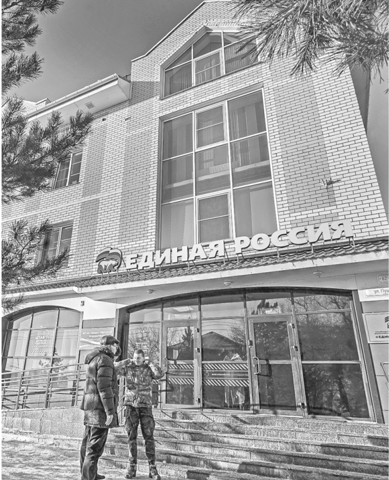
В дискуссии, которая прошла в Штабе общественной поддержки, приняли участие ветераны боевых действий.