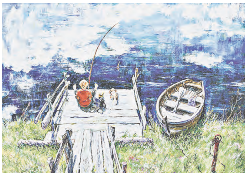
«Над облаками» (2020).