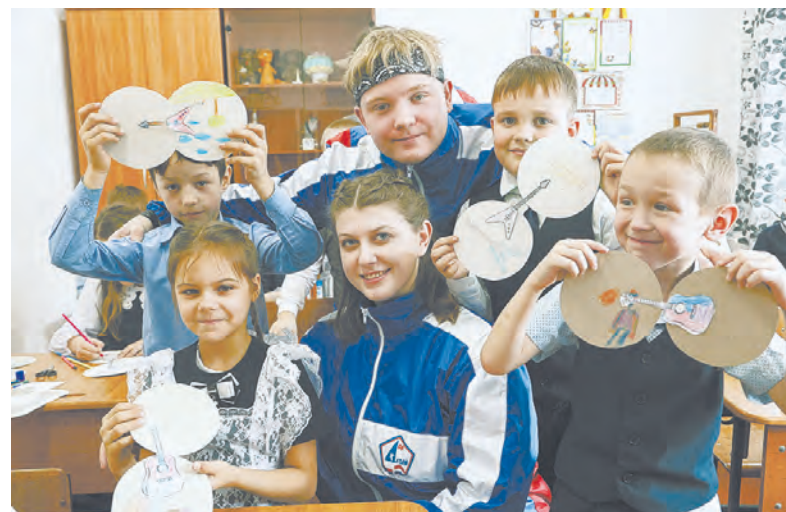
Алтайские волонтеры, известные своей активностью, получают еще больше мер поддержки.