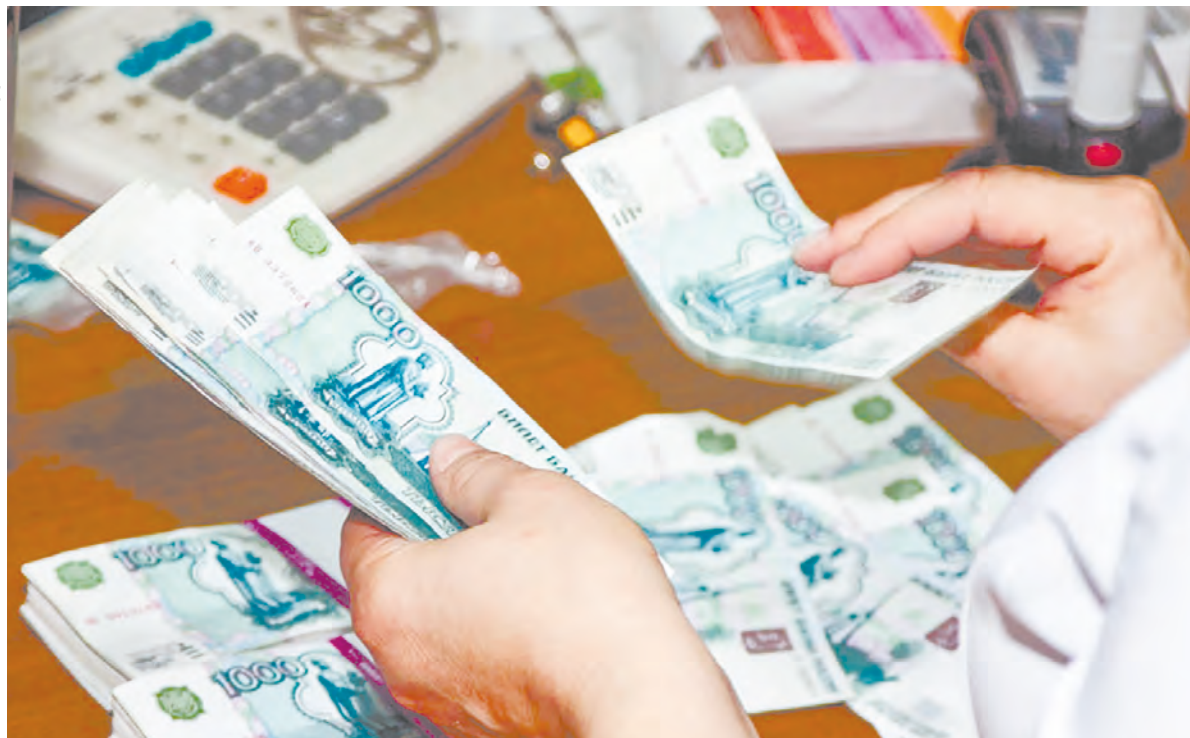
В текущем году увеличиваются выплаты различным категориям населения, в том числе матерям.