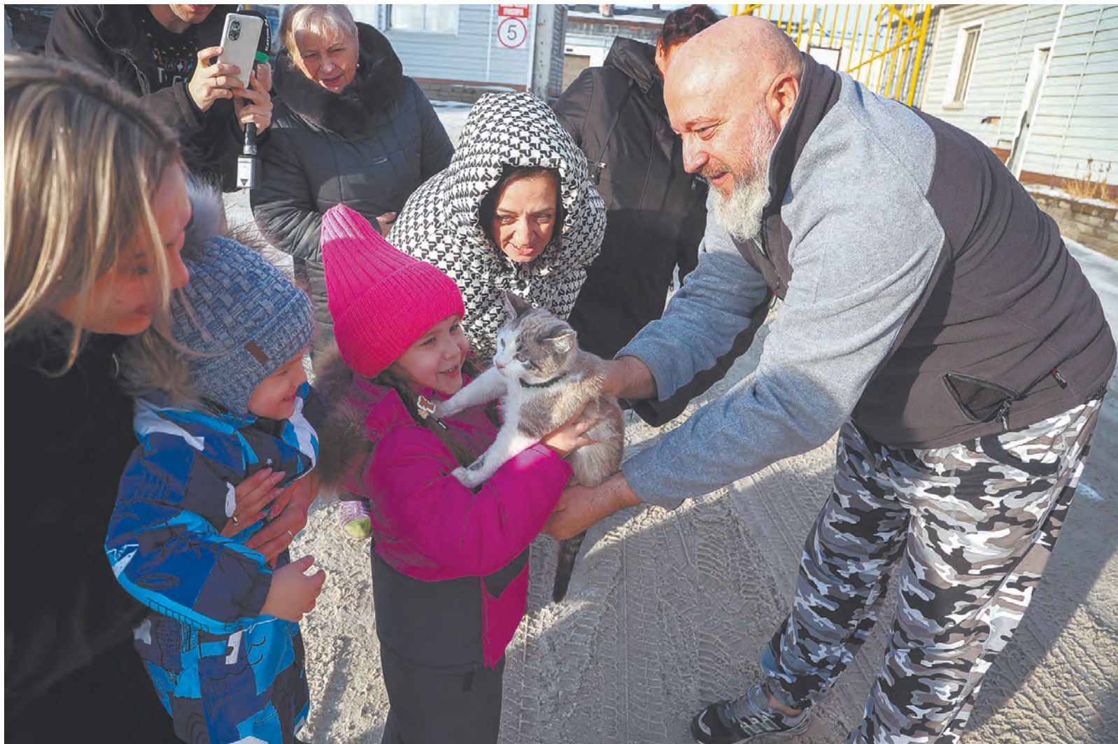
Тиш обрёл новую семью.

Так пушистый талисман воинов Алейской мотострелковой бригады стал известен всей стране. Если кто-то еще не понял: это – не про котика, а про невероятные, исполненные добра и любви к ближнему сердца человеческие.