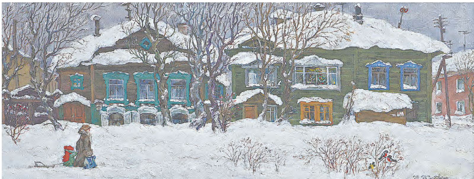
В композиции пейзажа «Утро 1 января» нет ничего случайного, как всегда у Клековкина.