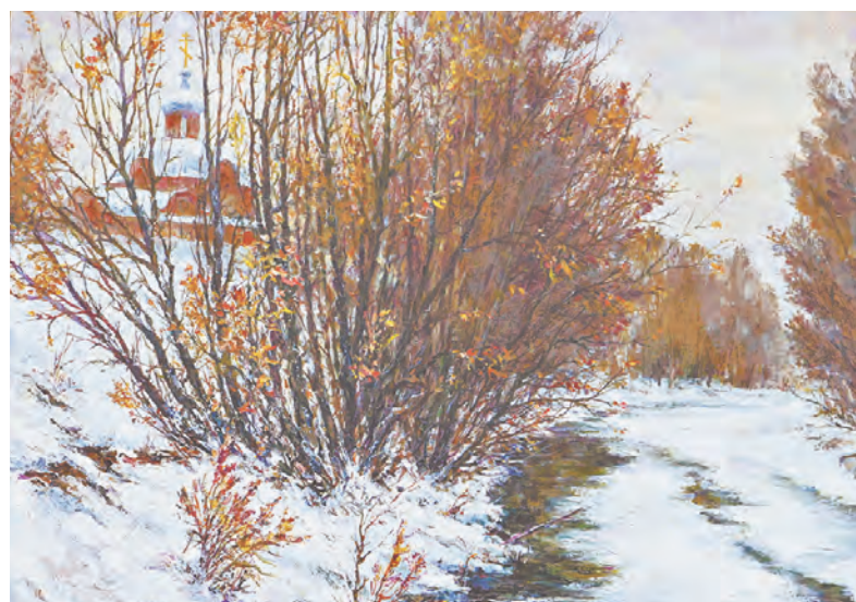
«Устье реки Барнаулки» (2010).

Если живописи Клековкин учился, будучи студентом самого первого набора Новоалтайского художественного училища у известного