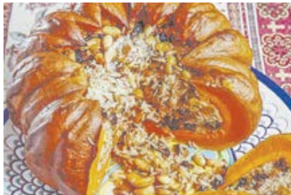
Армянское новогоднее блюдо хапама.