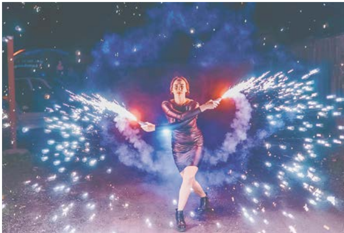
Бывают интересные моменты, которые хочется повторить. И огненное искусство – как раз из этого числа.