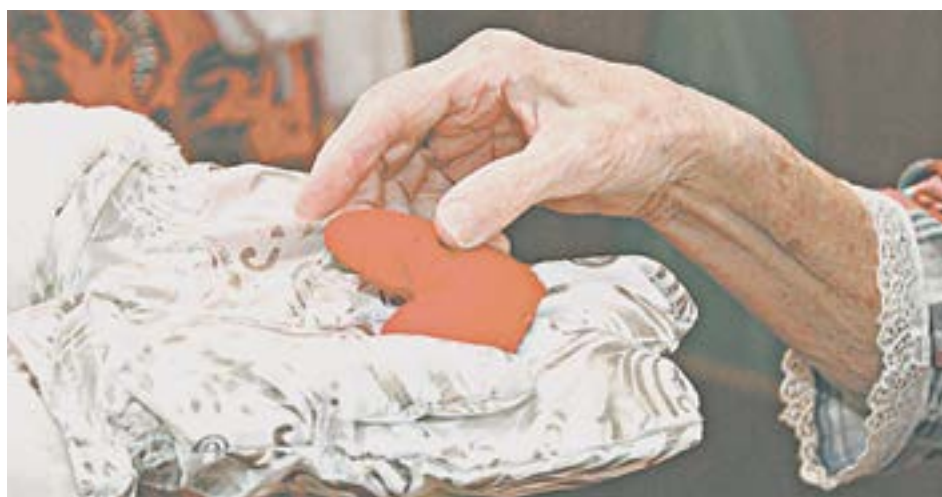
Сердечное тепло от «Капли добра».