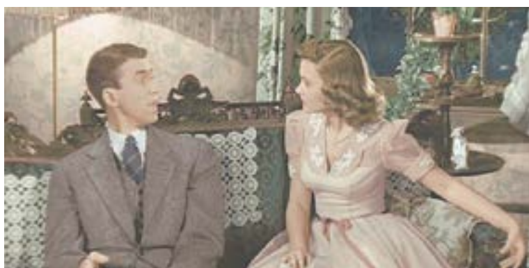
«Эта замечательная жизнь».