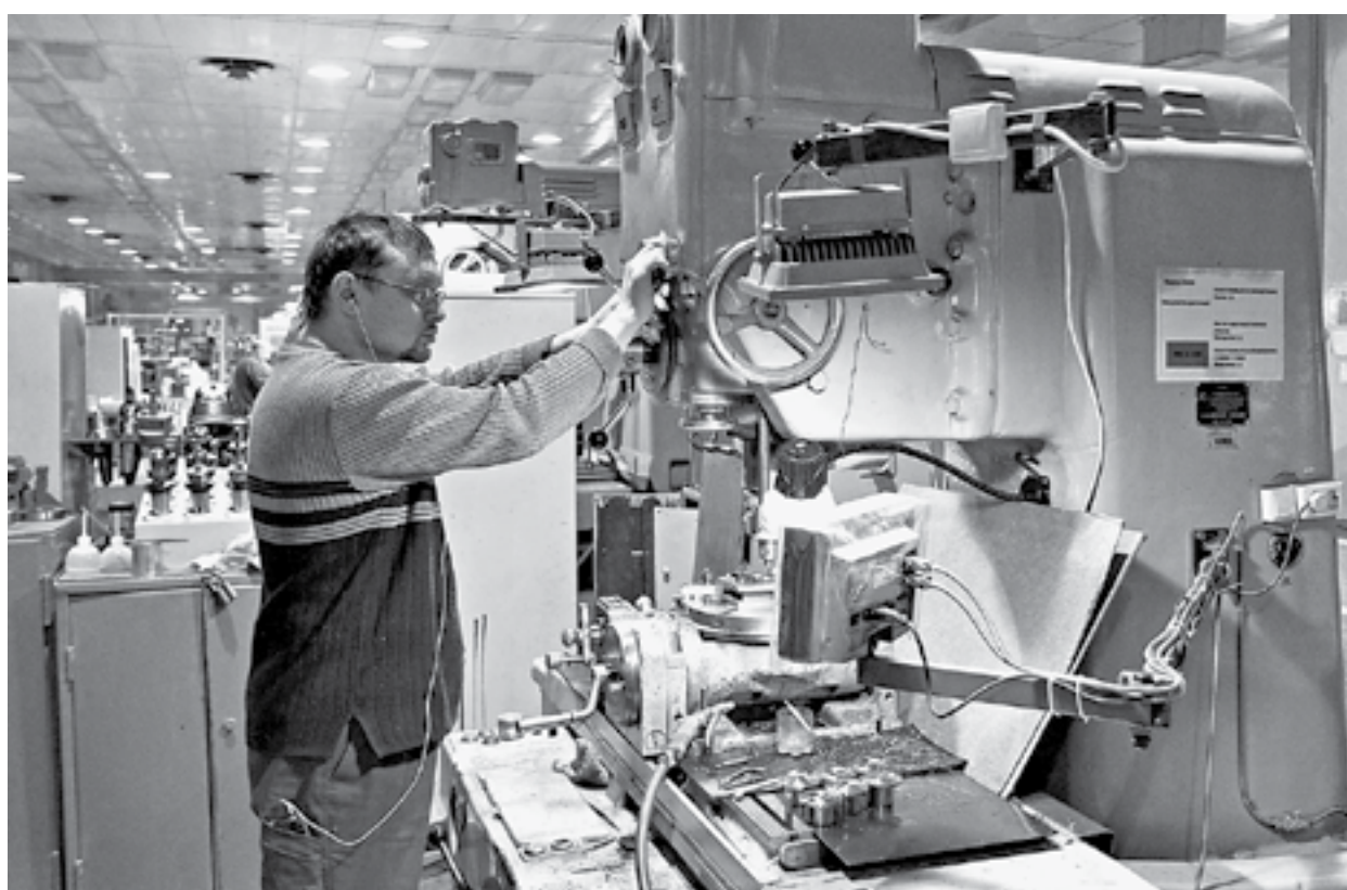
Объемы производства растут.

– Мы долгие годы отставали по этому показателю и сегодня, в общем-то, тоже отстаем, хотя и идем с приростом, – сказал министр. – Сейчас уровень зарплат в обрабатывающей промышленности края составляет 71% от общего показателя по стране. То есть мы отстаем на 29%. Но нужно