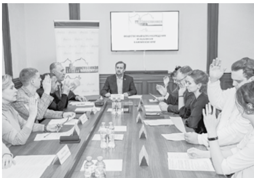
Работа общественного штаба наблюдения за выборами Президента РФ.

Как рассказал председатель комиссии Общественной палаты Алтайского края по вопросам образования, науки и культуры, руководитель мониторингово-аналитической и информацион-