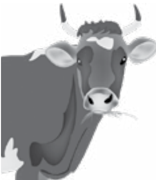
Инфографика О. ТАРАСОВОЙ.

Цена 1 литра молока по региону Сибирского федерального округа (ноябрь 2023 г., руб.)