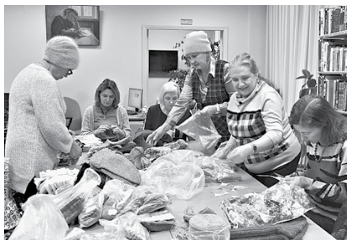
Связанные изделия упаковываются для отправки.

– Сейчас необходимо помочь бойцам, участвующим в специальной военной операции на Украине. Мы стараемся согреть их в прямом смысле слова. Я вяжу носки, изготовила около 15 пар, – рассказывает она.