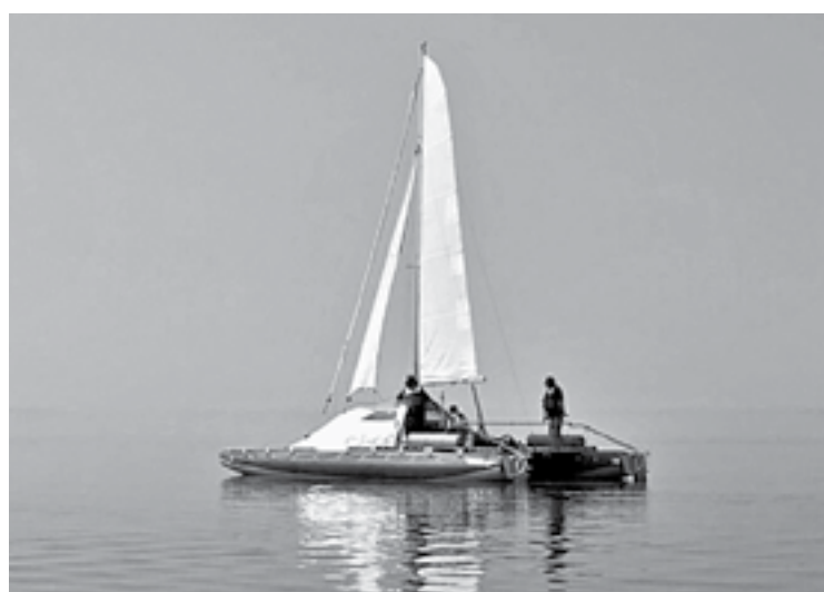
Катамаран, на котором предстоит пересечь земной шар.