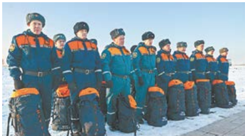
В мероприятии участвовало более 700 специалистов.