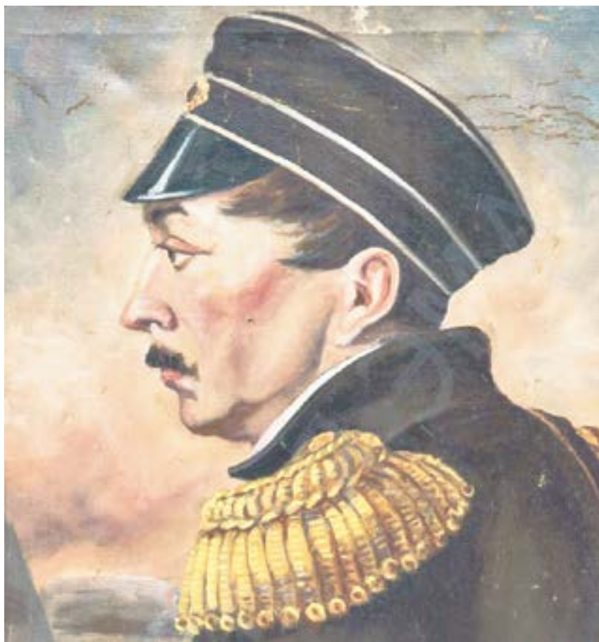
Адмирал Павел Нахимов