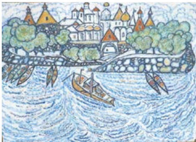
Владимир Муратов. «Соловьи» (горячая эмаль).