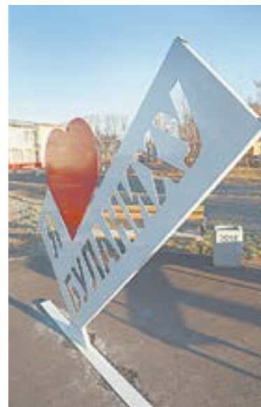
Буланихинцы любят свое село.

– Если люди хорошие, пусть приезжают. У меня жена татарка, и вообще в селе много смешанных браков. Интернационал – это здорово. Дети в них рождаются красивые, здоровые, умные. Но знаете, бывает, в семье несколько ребятшек, и все – разные. А если человек характером не очень, и с соседями не ладит, то какая уже разница, русский он или узбек?