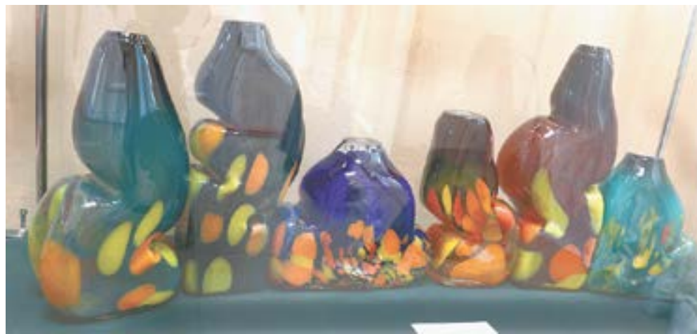
Ольга Кобылинская. Декоративная композиция «Алтай» (1987).