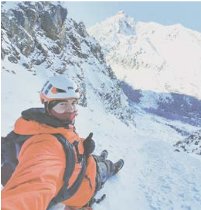
Отдых на лавинном выносе, ущелье Антру.

– О таком университете можно было только мечтать.