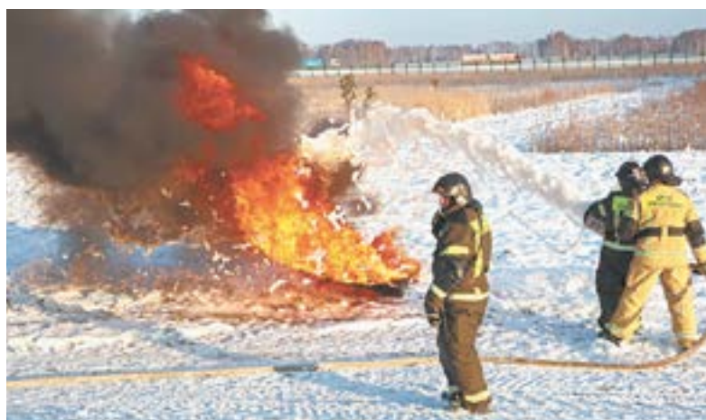
Готовность к ЧС – 100%.