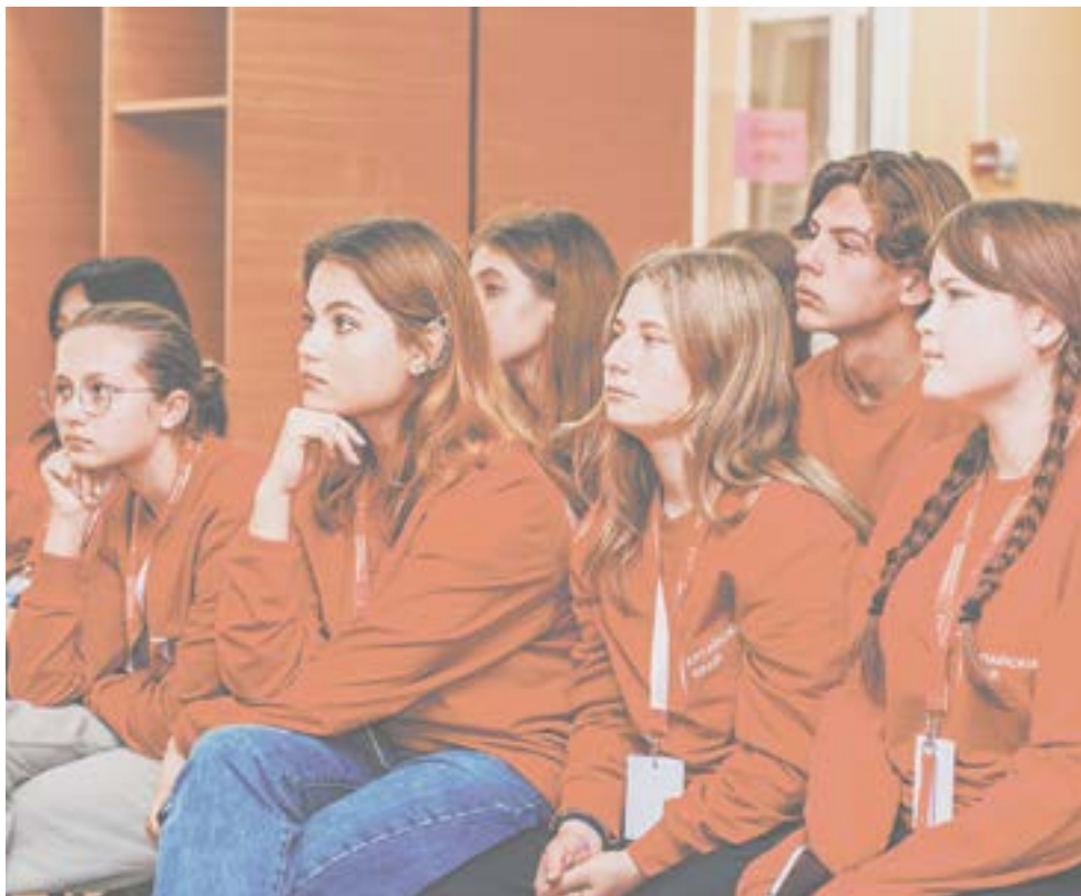
Школьники внимательно слушают предпринимателей.

Одна девушка шла в одиннадцатый класс, но так и не определилась, чем заниматься дальше. Мы разобрали ее ситуацию вместе со всеми, выяснили ее желания. И когда через месяц встретились с ней в другом лагере, то она поблагодарила меня за прошлую встречу и призналась, что тот разговор изменил ее жизнь. Она поняла, что хочет стать педагогом.