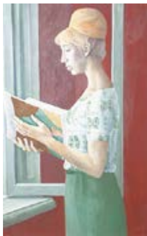
Работа Олега Филатчева.