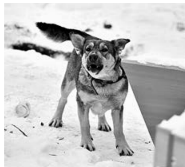
Когда собака лает на вас, лучше остановиться.

По нашим данным, ежегодно в Барнауле необходимо изымать из состава популяции порядка 1,8 тыс. бездомных собак, в целом по краю – не менее 18,7 тыс. особей. Ежегодные объемы изъятия, проводимые в согласованные сроки, позволяют сократить присутствие собак на ули-