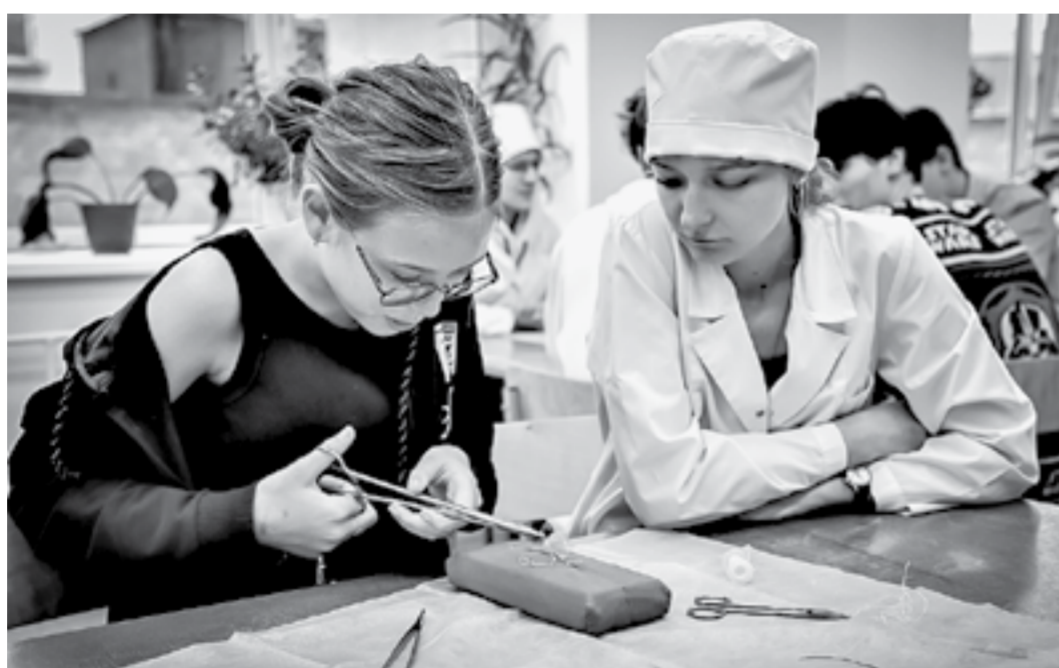
Попробовать себя в роли врача.