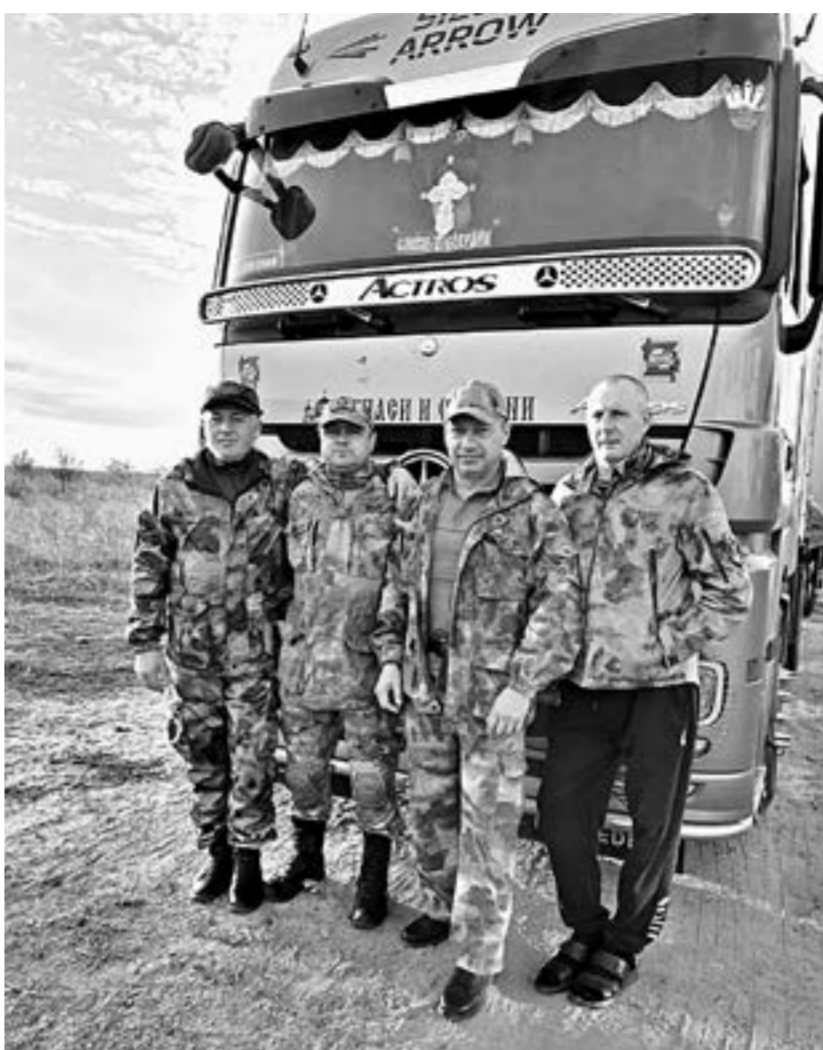
По пути к своим.

Сейчас мы уже имеем контакты наших земляков, отправившихся на