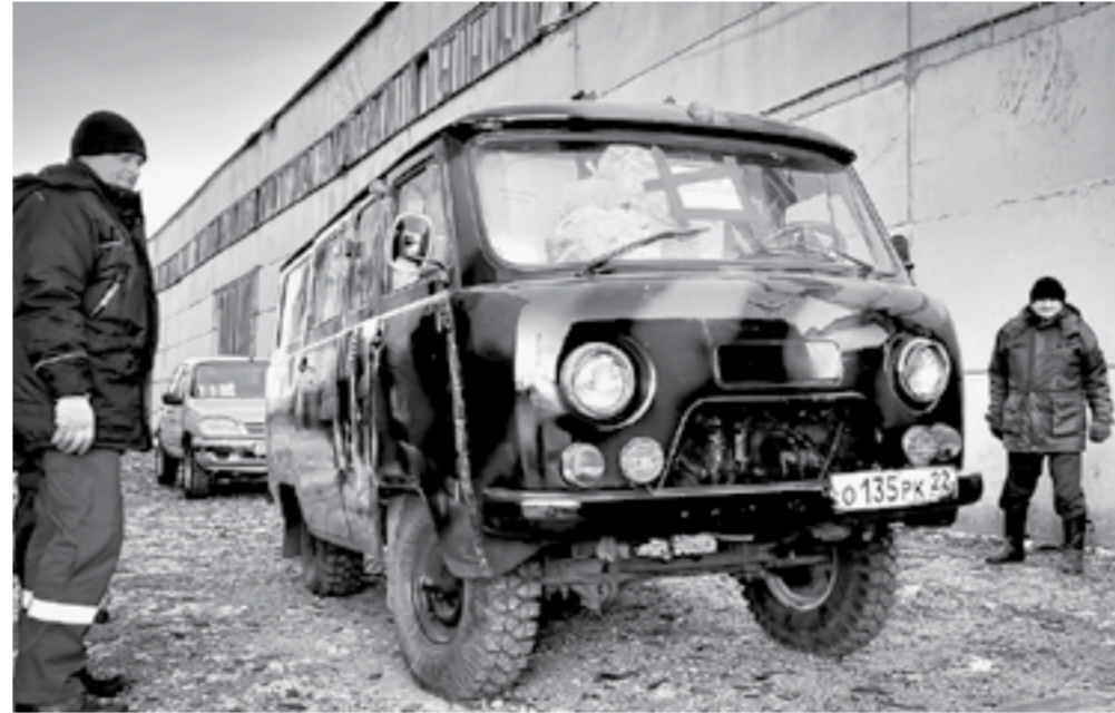
Несколько автомобилей отправилось в зону СВО.