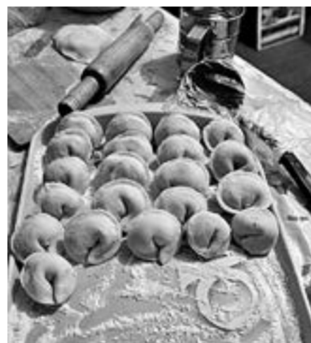
Гигант из Зырянки.

Учитель физкультуры и ОБЖ новозырянской школы на праздник пришла вместе с сыном Максимом не просто от-