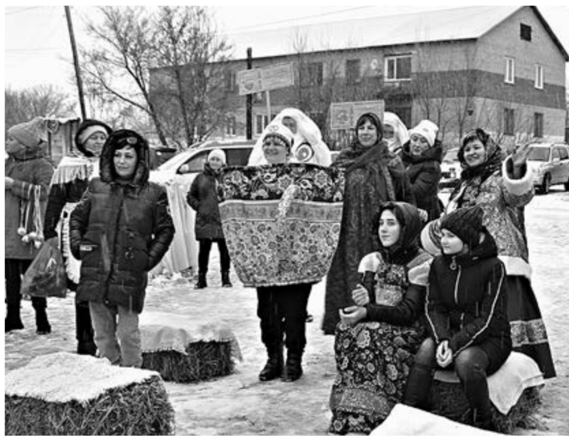
Кан на деревенской завалянке.

А рядом уже и не пельмени, почти что чебуреки в казане! В большом количестве