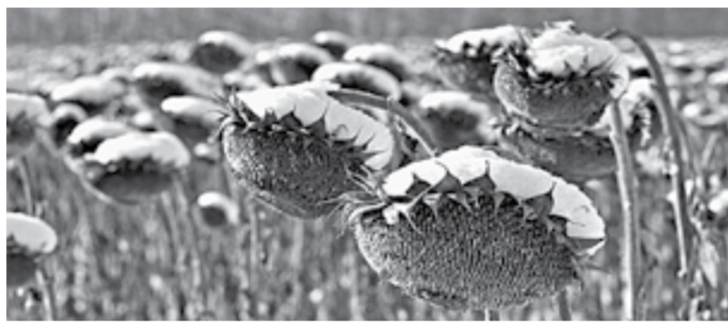
Аграрии собрали неплохой для нынешнего года урожай.