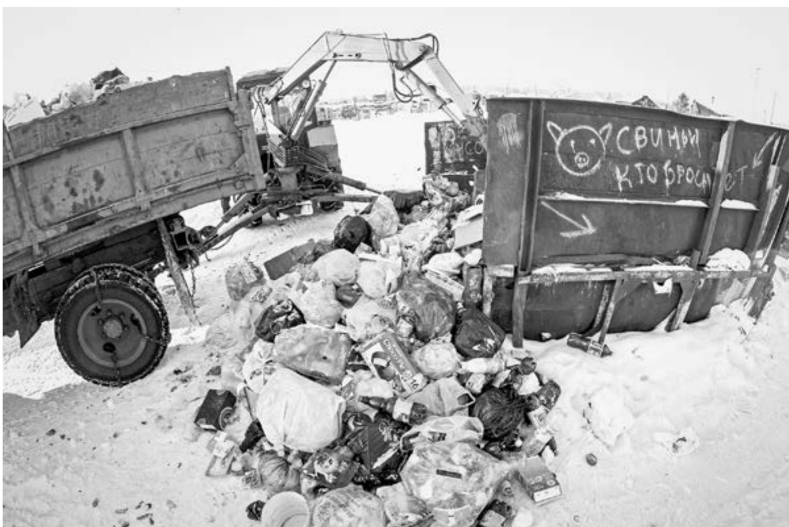
Зима – время, когда мусор больше накапливается.

Дом № 7а на барнаульской улице Профинтерна появился в 2013 году. Сначала новоселы