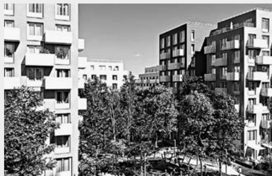
Так будет выглядеть жилищный комплекс по адресу: Барнаул, Змеиногорский тракт, 35б.

– Если его сглаживать, то можно потерять аллею, которая является основной ценностью будущего ЖК. Ради