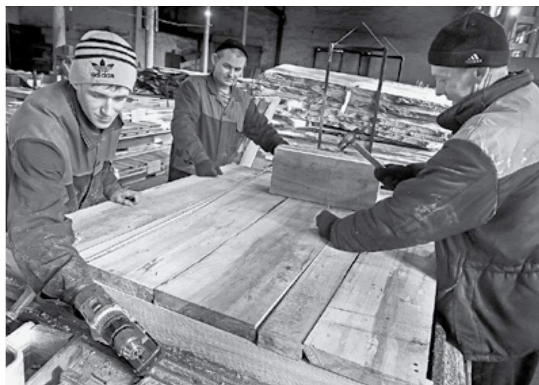
В цехе по изготовлению тары.

делали ручные тали, способные поднимать грузы от 1 до 3 тонн, потом от 3 до 5 тонн, а со временем стали изготавливать металлоконструкции для мостовых кранов грузоподъемностью до 50 тонн. Мы