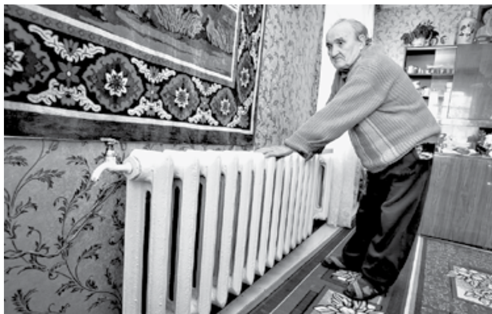
Главное, чтобы в доме было тепло.

На 2024 год предельные цены были утверждены для Барнаула на первое полугодие в 3639,84 руб./