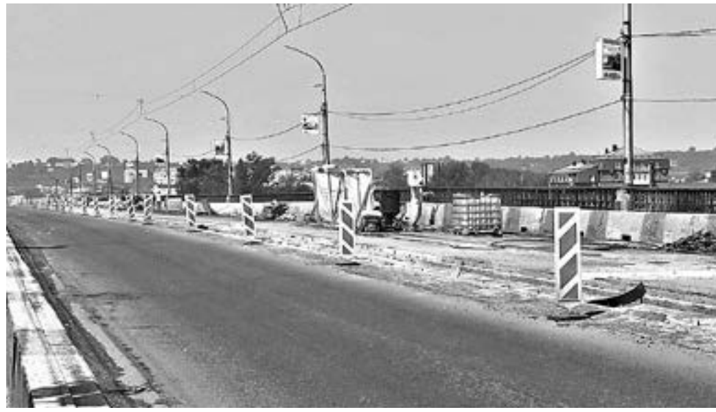
Бригады работали на объекте практически каждый день.

Наверное, только ленивый в наукограде не обсудил ход ремонта коммунального моста в Бийске в этом году. Скорее всего, это и правильно, ведь неудобства ремонтной кампании затронули не только бийчан, но и автомобилистов, тысячами проезжающих каждый день через эту переправу в Горный Алтай и Белокуриху. Ремонт завершается, а разговоры вокруг продолжаются.