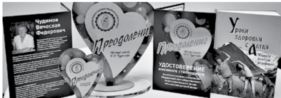
Сувенир – символическое сердце – лауреаты получают вместе с премией.