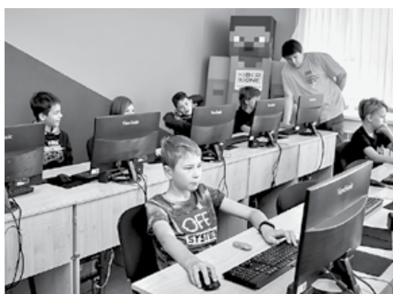
В школе занимаются более 130 учеников от 6 до 14 лет.

– Мы работаем по франшизе, – рассказывает она. – Это позволяет не разрабатывать свою программу, а пользоваться имеющейся. Партнеры предлагают удобный и качественный продукт, а изобретать колесо – нелогично. Головной офис международной компании-франчайзера находится