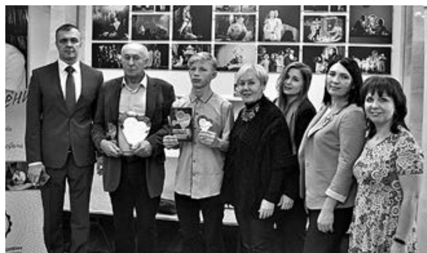
Лауреаты премии «Преодоление» принимали поздравления.