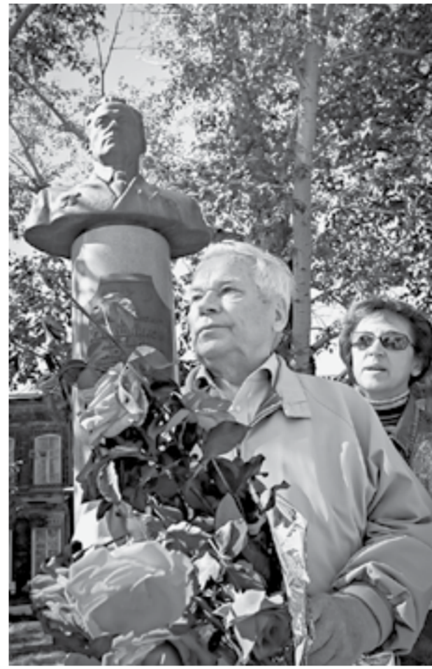
Михаил Калашников во время приезда в родную Курью.