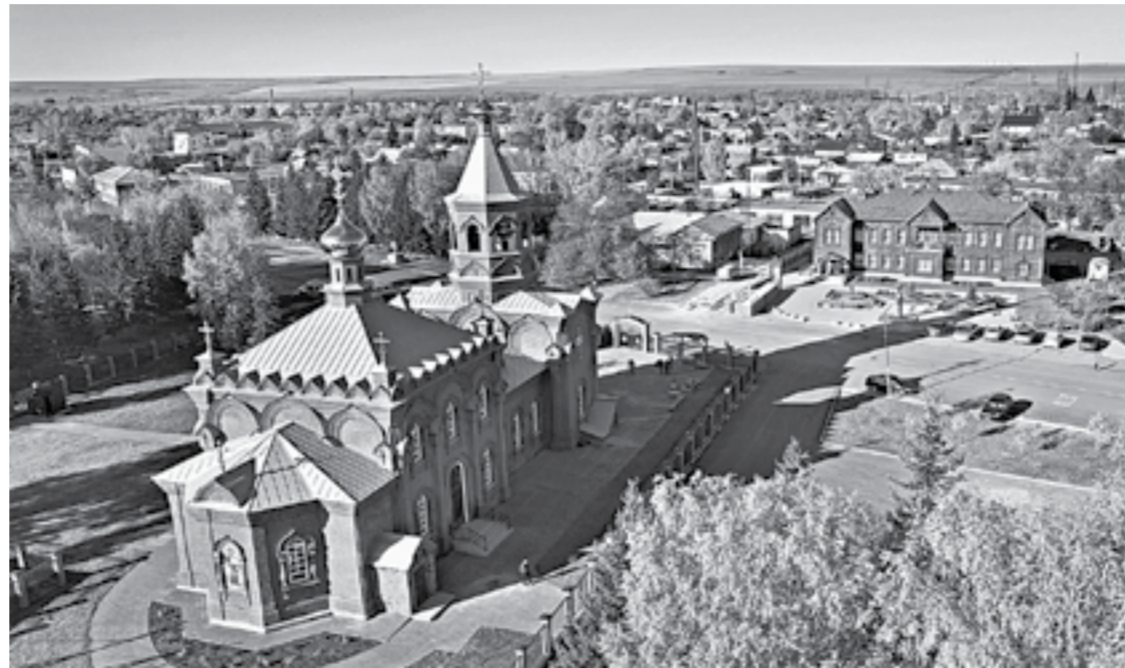
Музейный комплекс Калашникова стал украшением Курьи.

На сегодняшний день курьинский объект посетило более 150 тысяч человек. На один год приходится более 10 тысяч посетителей – из дальнего и ближнего зарубежья, разных концов страны. Не так давно были индийцы, казахи, египтяне, гости из Магадана, Керчи, Анапы... «Иной раз ходит по залам, и ни слова по-русски».