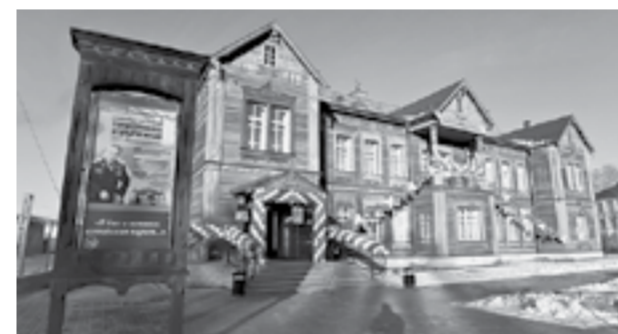
Со дня открытия музея минуло 10 лет.