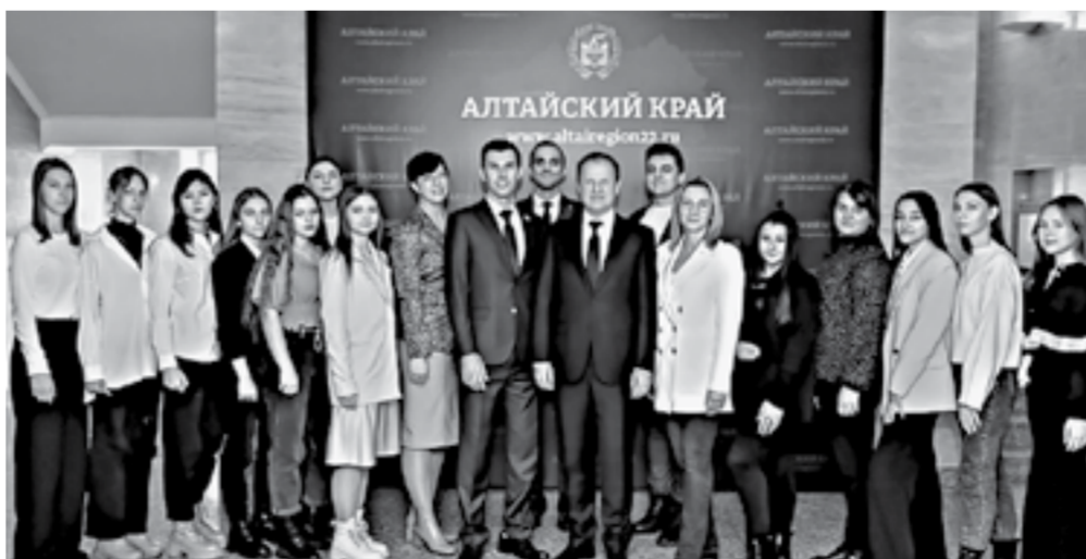
После подписания соглашения.

– Процветание сел – важный аспект развития не только нашего края, где около половины населения живет в сельской местности, но и всей страны. Именно за счет работы аграриев обеспечивается продовольственная безопасность – один из серьезнейших вопросов, ко-