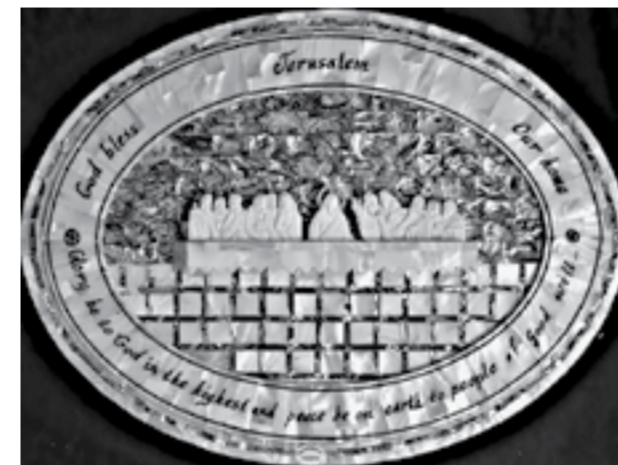
Настенное панно «Тайная вечеря» – подарок оружейнику от принца Иордании.