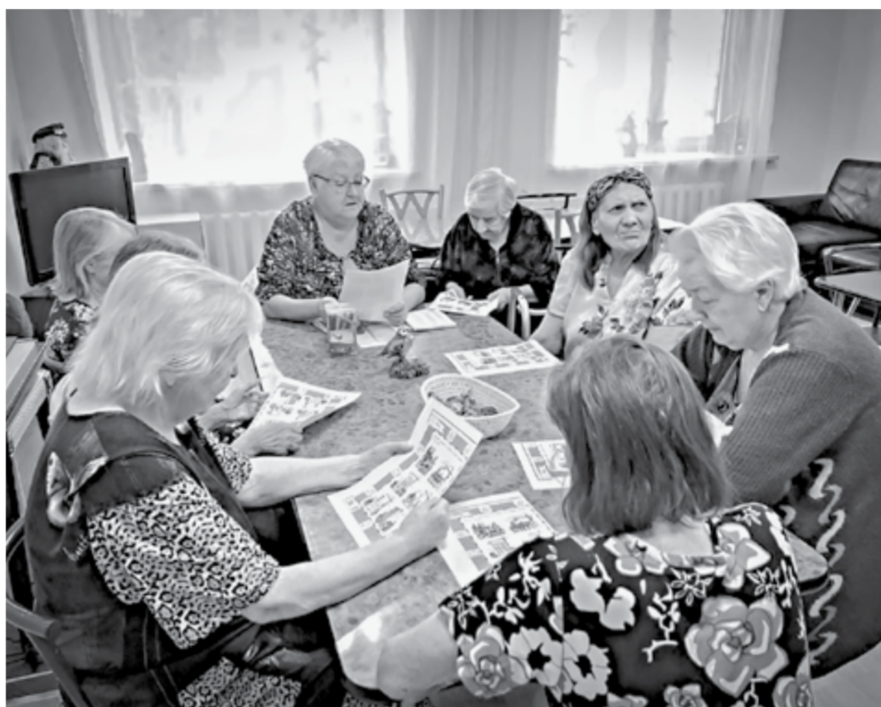
Групповое занятие с психологом.

Персонал создает для постояльцев не только комфортные условия, но и досуг. До прихода коронавируса