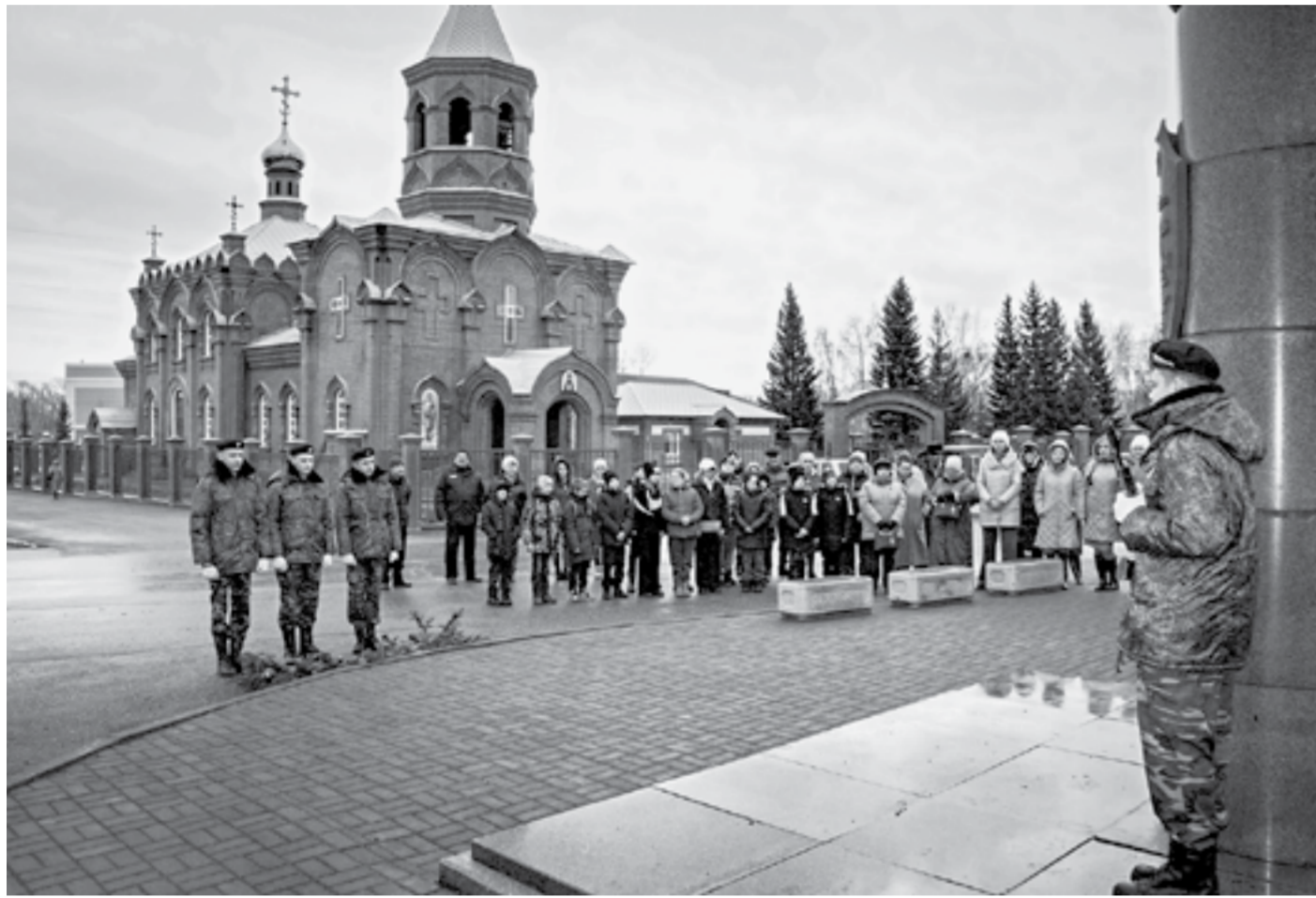
На митинге 10 ноября вспоминали знаменитого земляка.

Дмитрий СЕРДОВ По информации РИА Новости.