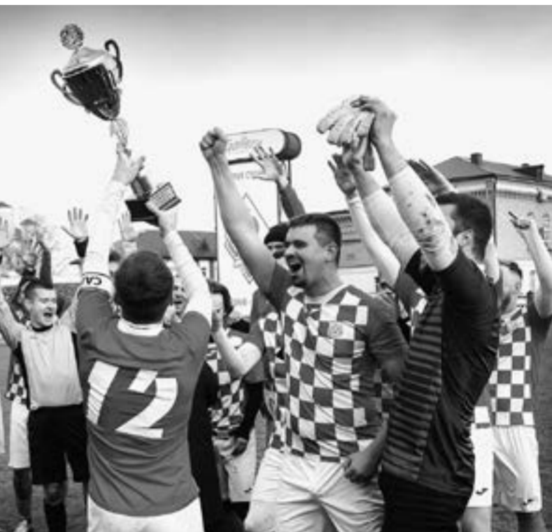
«Полимер» в год своего 45-летия неудержим.