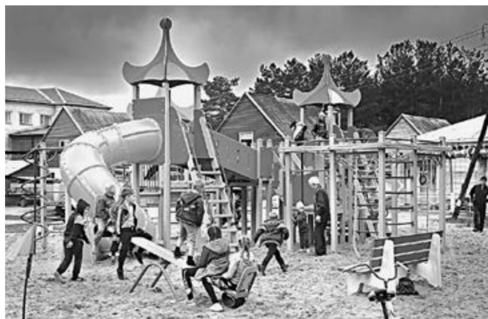
В проекте краевого бюджета предусмотрены затраты на реализацию общественных инициатив.

В ответ финансист заметил, что налог на прибыль организаций – это тонко