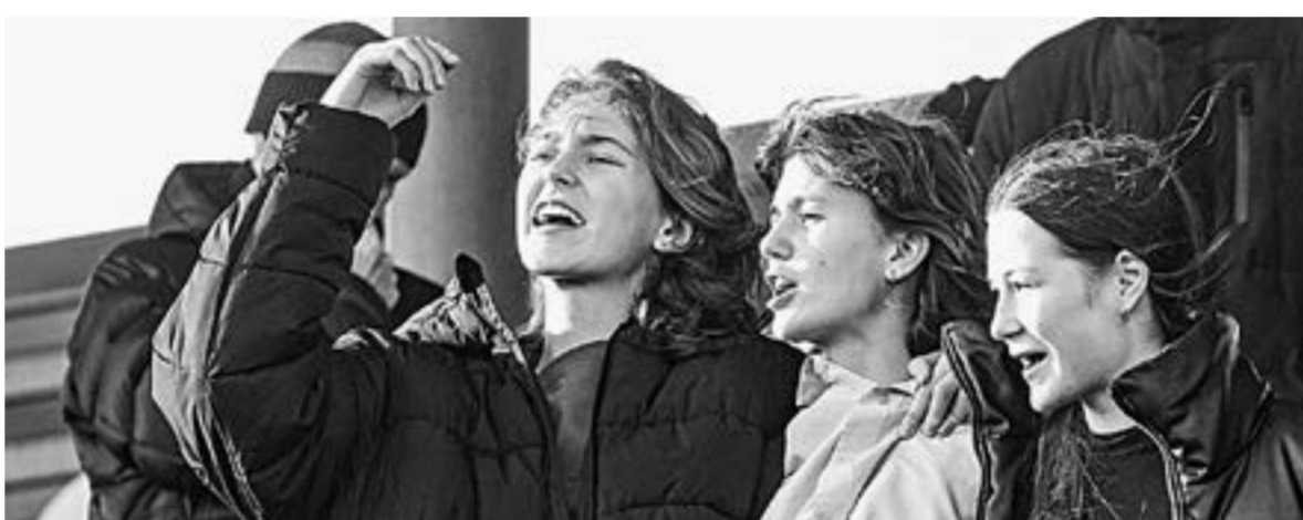
Городское дерби привлекло болельщиков разных поколений.

там состоится финальный этап чемпионата страны по футболу среди любительских команд третьего дивизиона. Полимеровцы будут представлять всю Сибирь и Дальний Восток.