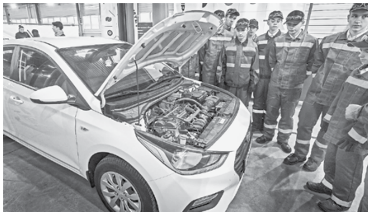
В мастерской по техобслуживанию и ремонту автомобилей Алтайского транспортного техникума.

Сориентироваться в многообразии профессий школьникам уже несколько лет помогает проект «Билет в будущее». Вместе с девятиклассниками барнаульской школы № 88 корреспонденты «АП» побывали на профессиональных пробах в мастерской Алтайского транспортного техникума, поискали неисправности под капотом автомобиля и заметили, что ребят это и правда впечатляет.