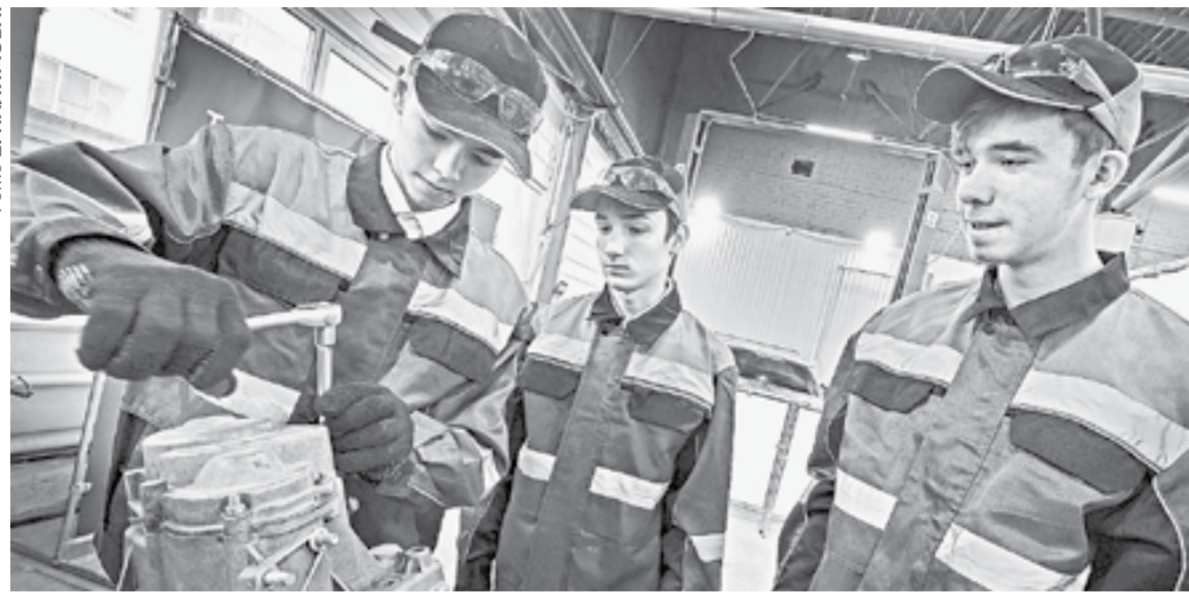
Такой формат работает лучше, чем обычная экскурсия.