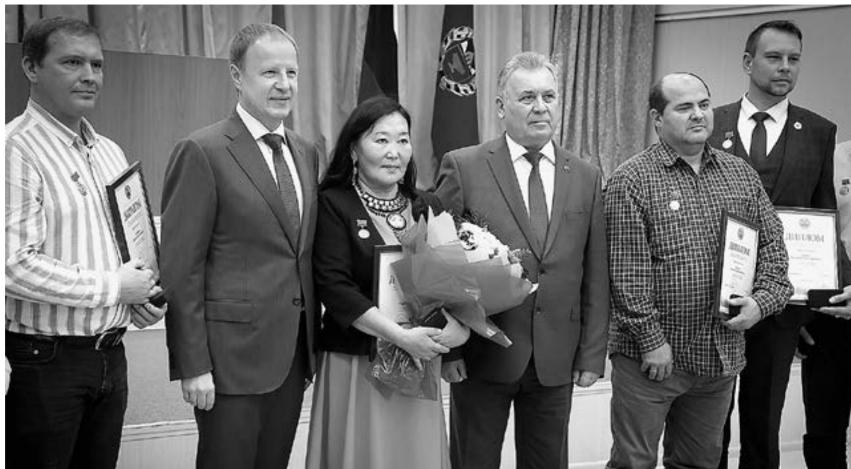
Поздравления принимают ученые из ФНПЦ «Алтай», город Бийск.