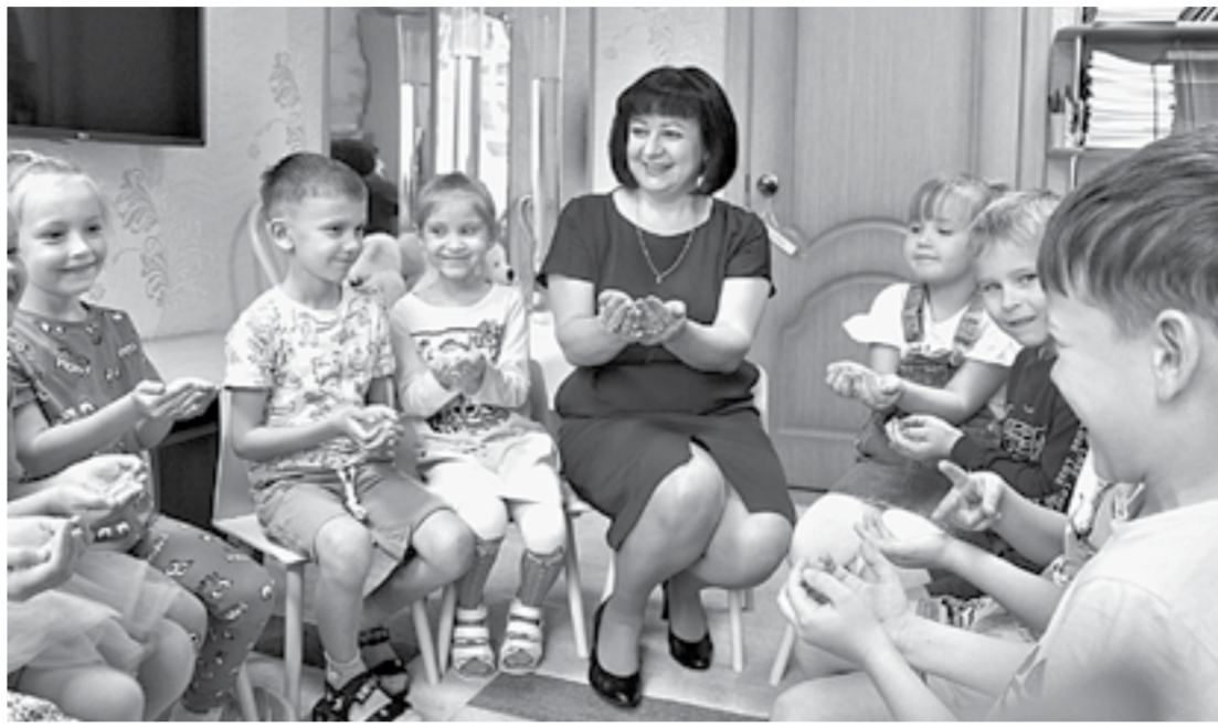
Групповые занятия проходят весело и интересно.

По исследованиям психологов, с которыми она абсолютно согласна, причинами такого всплеска являются генетические нарушения, плохие экологические условия, инфекционные заболевания женщины, неправильное питание и неправильный образ жизни.