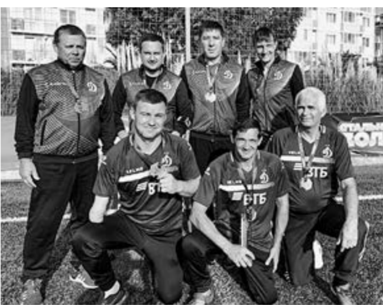
Команда «Динамо-Алтай» после награждения в Сочи.

Команда футболистов-ампутантов «Динамо-Алтай» триумфально завершила сезон, успешно выступив на турнирах в Абхазии и Сочи.