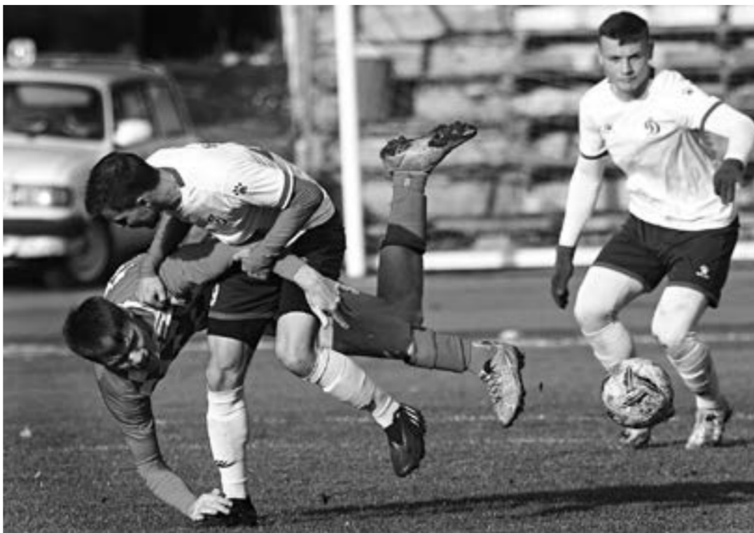
Матч – товарищеский, борьба – мужская!

Для «Полимера» «Матч дружбы» стал хорошей проверкой перед поездкой в Сочи. С 4 по 12 ноября