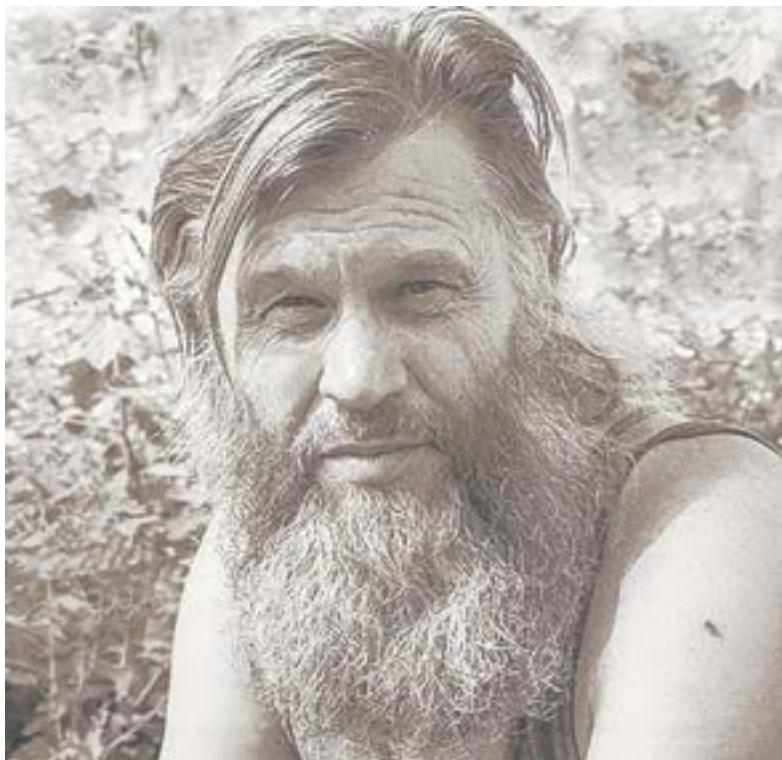
Владимир Ильич в плену.