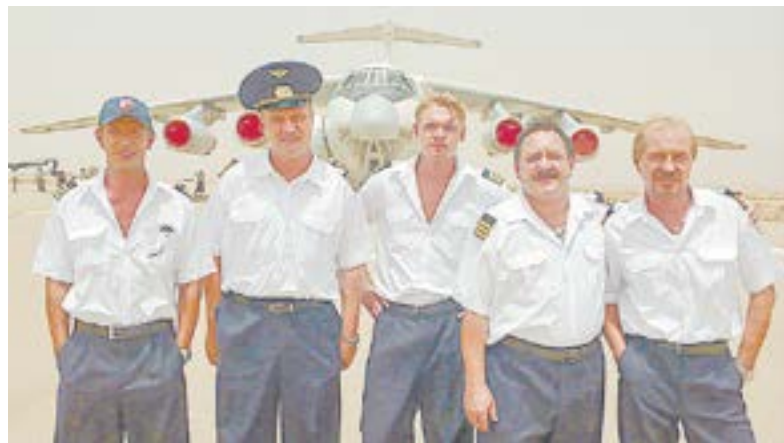
Актерский состав «Кандагара».

В 1992 году дважды летали в Сьерра-Леоне (Западная Африка), во Фритаун, с бронетехникой и сопутствующим грузом. Борт разгружали военные с автоматами, приехал премьер-министр. Нас держали тогда две недели в отеле до обратной загрузки. Наконец вызвали на вылет и загрузили... 5 тонн ананасов и тонну сигарет. В машину, которая легко 50 тонн берет. Наверное, ждали, когда урочай поспеет.