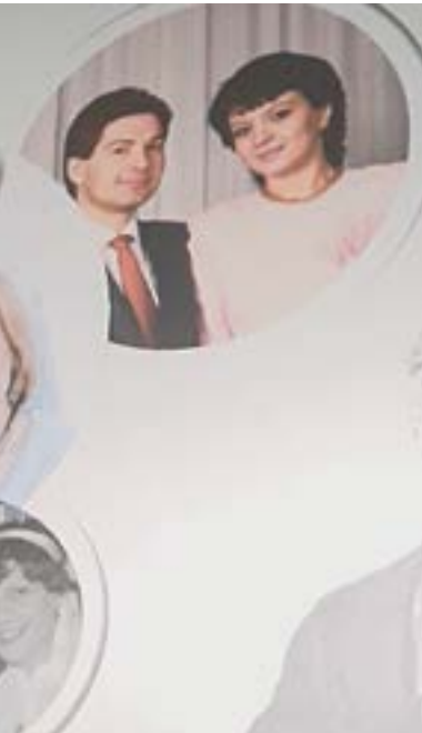
...и со своим мужем и детьми в США.

щать. Если работать над отношениями, то они будут увязать. При этом важно обращать внимание на три составляющих. Во-первых, нельзя навязывать человеку свое настроение, свой характер, нужно подстраиваться под собеседника. Во-вторых, в разговоре нужно искать общие интересы. В-третьих, в процессе общения рекомендует искать общих знакомых. Как только удастся решить эту задачу, то собеседник становится чуть ли не другом. Но нельзя при общении манипулировать человеком, так как он это почувствует.