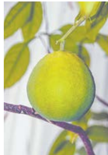
В зимнем саду спеют лимоны.

В мае в детсад № 189 пришли сотрудники Каменской межрайонной прокуратуры. Итог – иск в суд к администрации Каменского района и детского сада с требо-