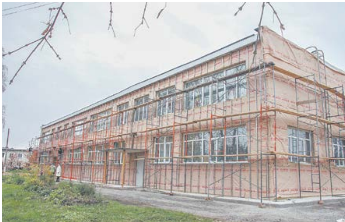
Детсад «укутывают» в теплую и красивую одежду.

Договор с подрядчиком подписан 28 августа. За это время рабочие полностью очистили межпанельные швы от старого материала, загерметизировали их. Поэтапно, участок за участком, укрывают стены теплоизоляционными материалами, приступают к обшивке фасада металлосайдингом.