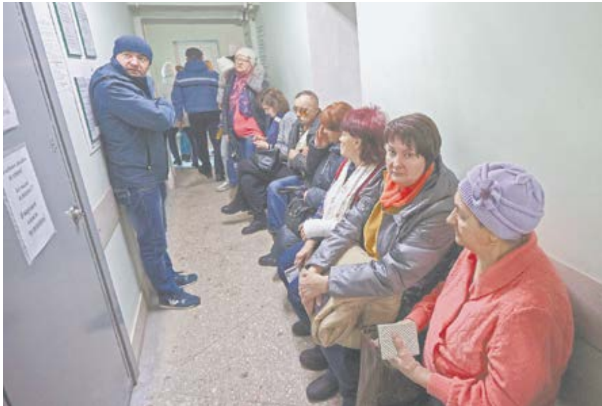
Когда талонов меньше, чем больных.

– Кадровый голод испытывает медицина всей страны – не только нашего региона. Не случайно ведь в Москве родился федеральный проект «Инцидент № 38», курируемый Министром здравоохранения России. Разработанные методические рекомендации легли в основу приказа № 416 Минздрава Алтайского края, где детально прописаны меры повышения доступности медицинской помощи, когда докторов не хватает. Документ регламентирует запись на прием по всем поводам. Поликлиника начинается с расписания, как театр с вешалки. В пилотный проект мы вошли подготовленными, так как уже несколько лет наши передовые медучреждения, включая краевой диагностический центр, работали над созданием такой модели. Опыт региона учтен федеральным документом, отныне – основным для первичного звена медици-