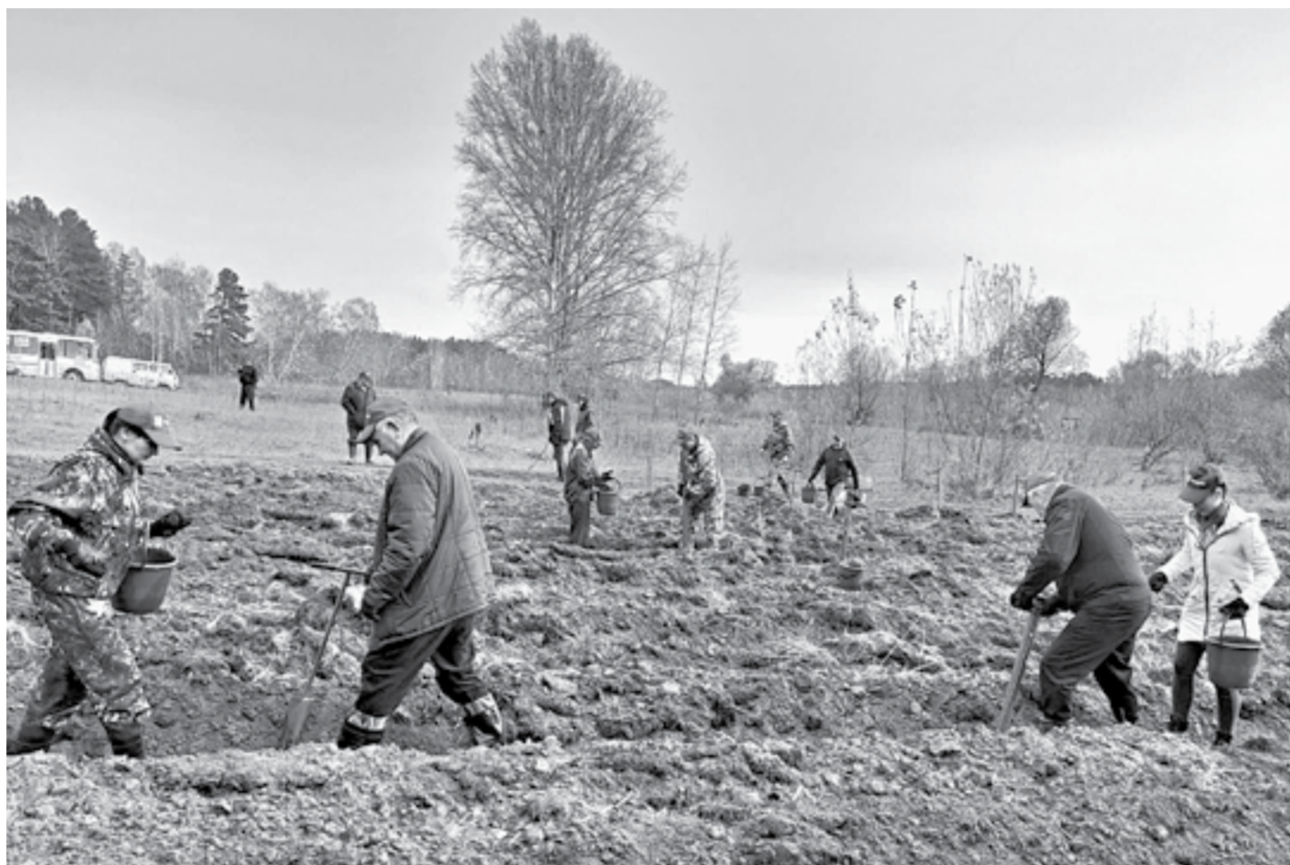
Вместе работа спорится быстрее.