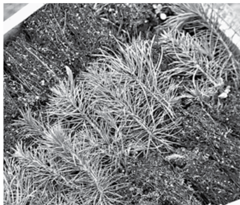
Саженцам сосны еще расти и расти.