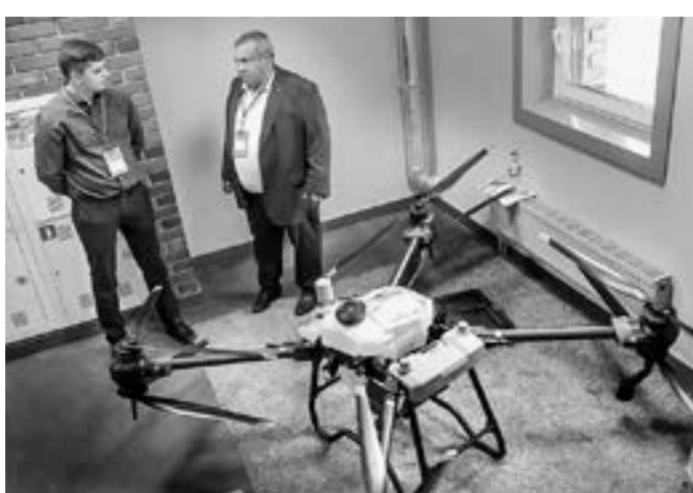
Агродроны – будущее сельского хозяйства.

– В прошлом году число хакерских «набегов» на государственные учреждения и предприятия нашей страны увеличилось многократно. Сейчас активность несколько ниже, но попытки взлома стали гораздо изощренней, и направлены они на утечку персональных данных. Поэтому представителям бизнеса нужно пересмотреть подходы к защите, возможно, перестроить сетевую архитектуру. К сожалению, многие компании, обеспечивающие цифровую безопасность, заточены под работу с большими корпорациями и госструктурами. Малому бизнесу уделяется недостаточное внимание, хотя он также