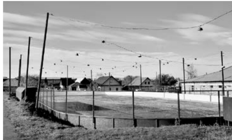
Новая хоккейная коробка – самый дорогостоящий проект Камня.