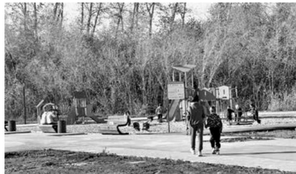
Благодаря ППМИ в Каменском районе обустроили пять детских площадок.