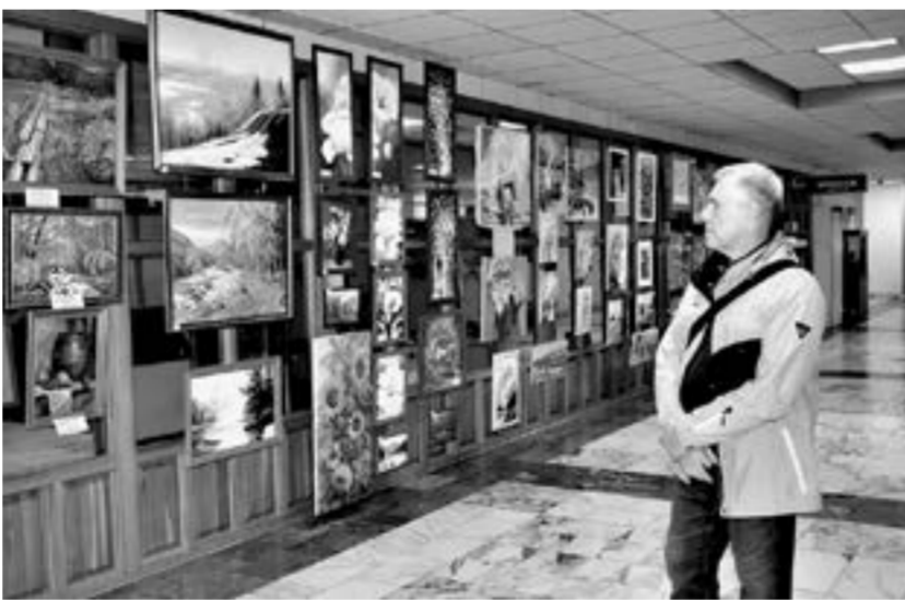
Выставка объединения «Семицвет» в Белокурихе стала юбилейной.

Один из уроков общественности и права Краснощёковской средней школы учитель и ученики провели... прямо в районном суде.