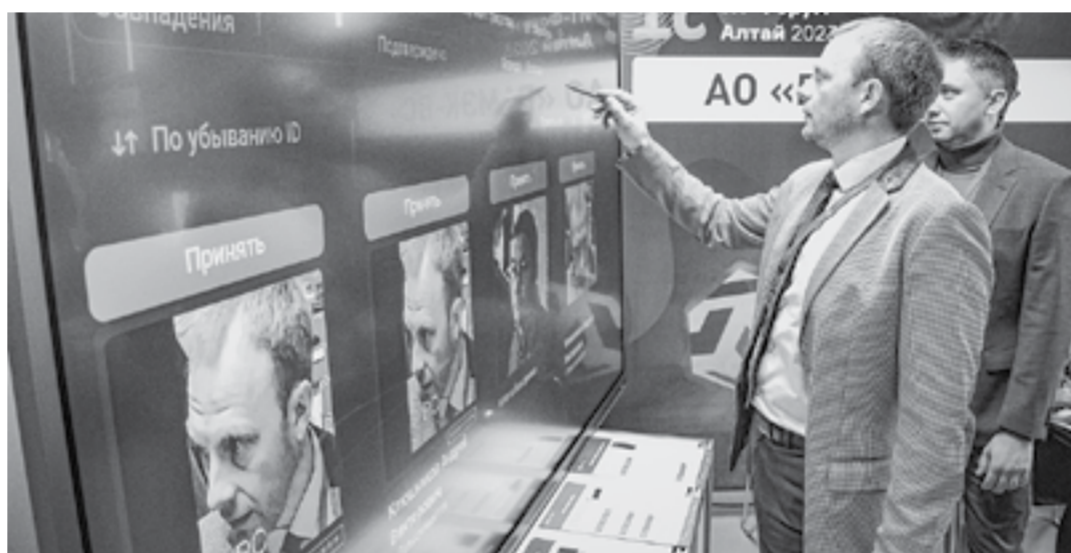
Отечественная система распознавания лиц.