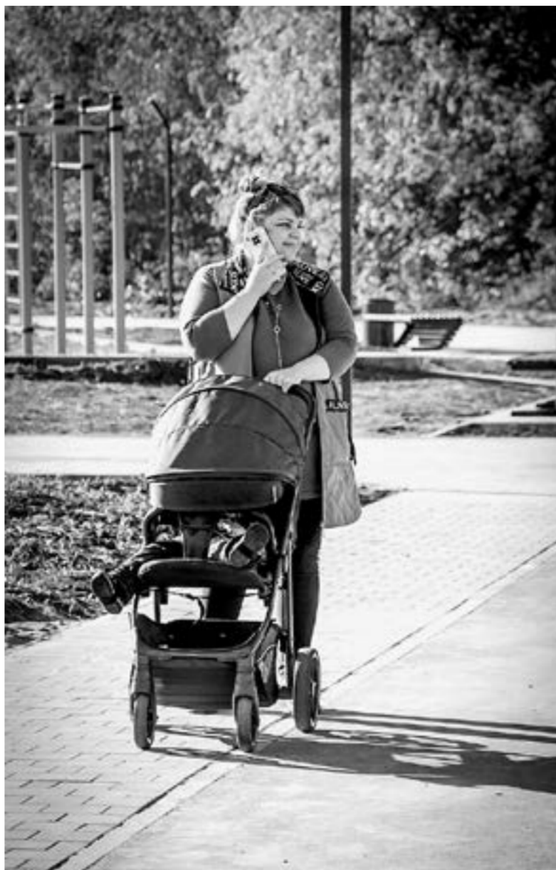
Гулять в парке Зелёный клин одно удовольствие.

Таким же путем пошли еще одни «первопроходцы», жители станции Плотинная, относящейся к городу. Теперь у ребятшек в центре станционного поселка есть место для игр.