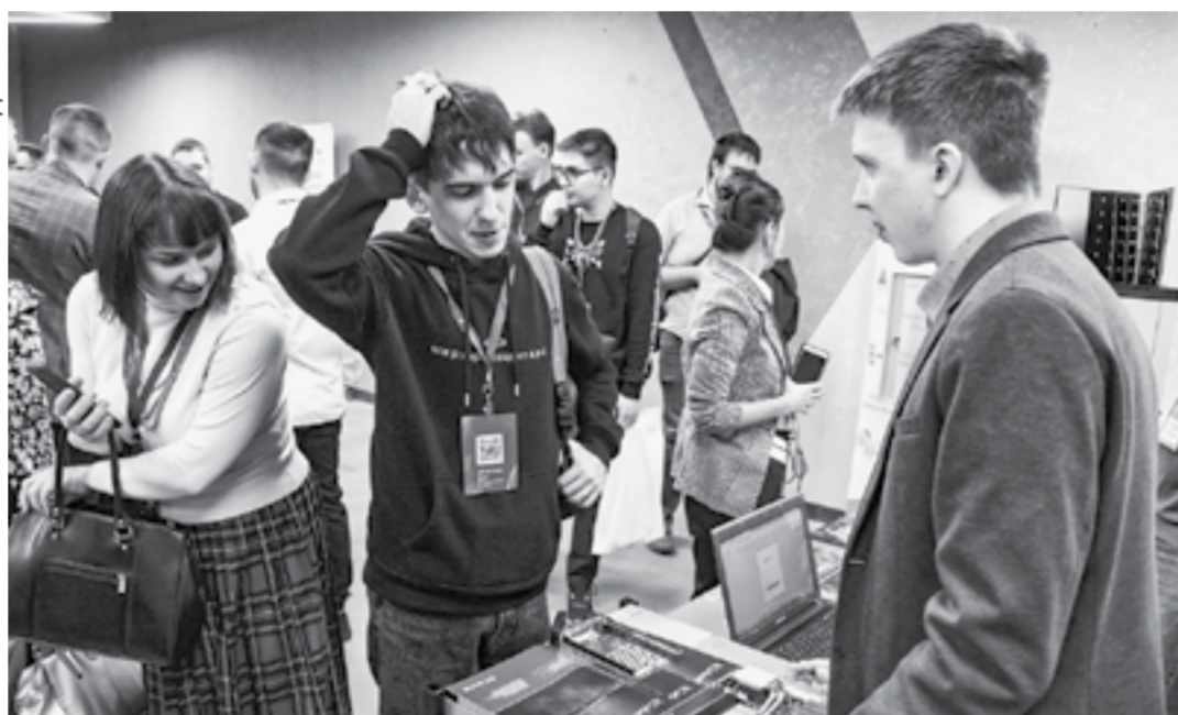
Некоторые разработки заставляют задуматься.

ниях сфера информационных технологий как страны, так и края демонстрирует небывалый рост. Это подтверждают десятки выставочных стендов, на которых были представлены разработки российских компаний.